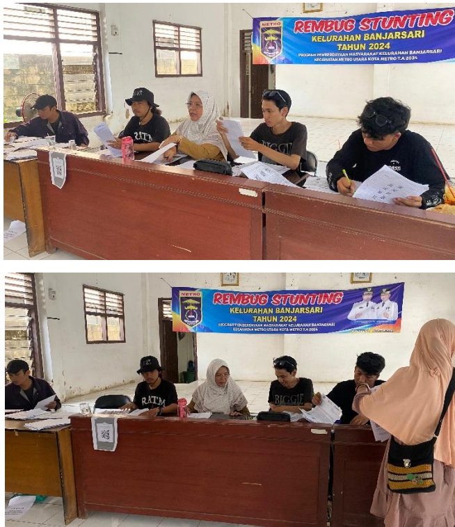
Gambar 2.6 Panitia Pembagian Beras Bulog di Kelurahan Banjarsari