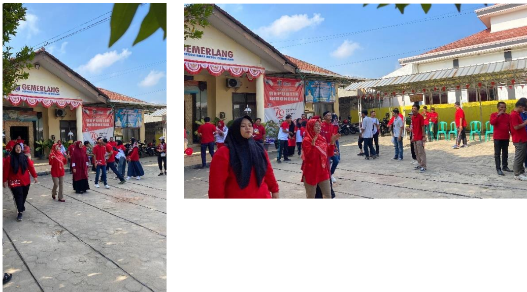
Gambar 20.8 lomba di Kecamatan Metro Utara

Kegiatan ini berlangsung dengan semangat yang tinggi dan mendapatkan apresiasi dari semua peserta. Partisipasi mahasiswa PKPM IIB Darmajaya tidak hanya memperluas pengalaman mereka dalam berorganisasi, tetapi juga mempererat hubungan dengan karyawan dan instansi terkait.