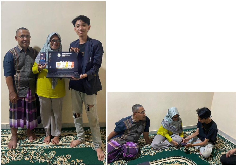
Gambar 2.4 Penjelasan dan Penyerahan Akun Penjualan Shoope Canting Batik Metro