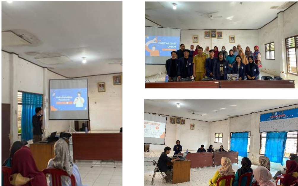
Gambar 2.5 Penjelasan dan Foto Bersama Pelaku UMKM untuk melakukan sosialisasi

Meskipun hasil sosialisasi ini sudah menunjukkan kemajuan yang positif, diperlukan langkah-langkah lanjutan untuk memastikan semua UMKM di Kelurahan Banjarsari Metro Utara dapat sepenuhnya mengadopsi dan memanfaatkan teknologi digital. Oleh karena itu, disarankan untuk terus melakukan pendampingan dan evaluasi secara berkala guna mendukung keberhasilan proses digitalisasi UMKM.