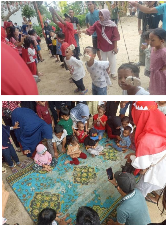
Gambar2.7 lomba di RW 08 dan 09

Kegiatan ini berjalan dengan sukses dan mendapatkan sambutan positif dari warga. Partisipasi mahasiswa PKPM IIB Darmajaya tidak hanya memperkaya pengalaman berorganisasi mereka tetapi juga mempererat hubungan dengan komunitas lokal.