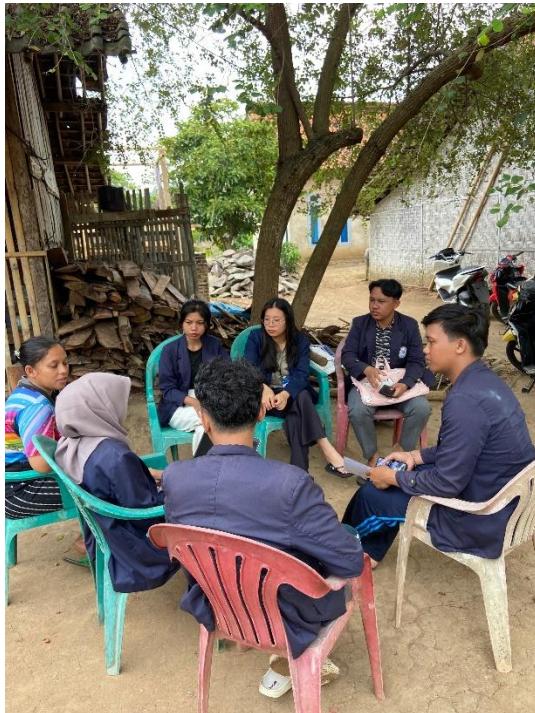
Gambar 2.5 Kunjungan ke UMKM Opak Singkong