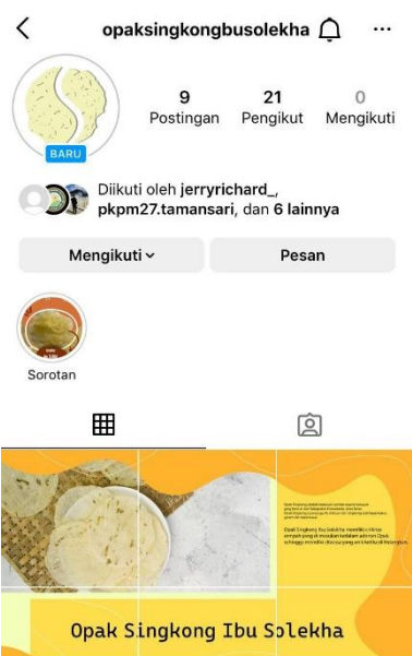
Gambar 2.3 Hasil Desain Feed Instagram