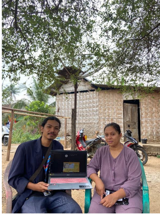
Gambar 2.4 Penyerahan serta penjelasan Desain