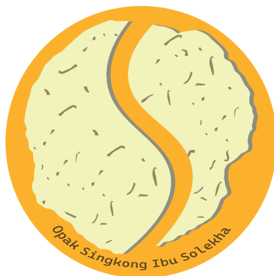
Gambar 2.2 Hasil Desain Logo