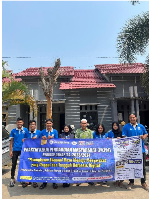
Dokumentasi Pelepasan Oleh DPL