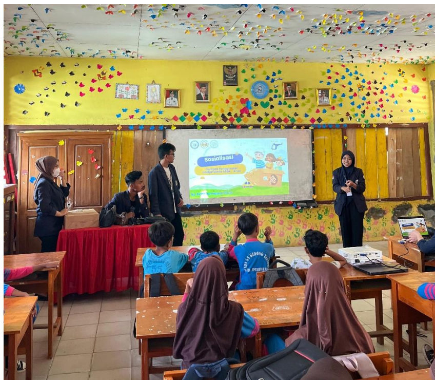
Dokumentasi Sosialisasi ke SDN 55 Gedong Tataan