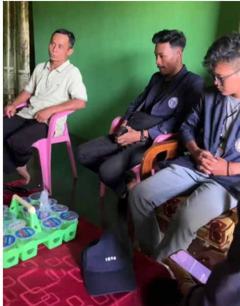
Dokumentasi Kunjungan ke Dusun Way Layap I