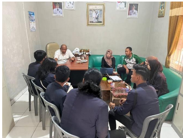
Dokumentasi Laporan Kepada Pihak Desa