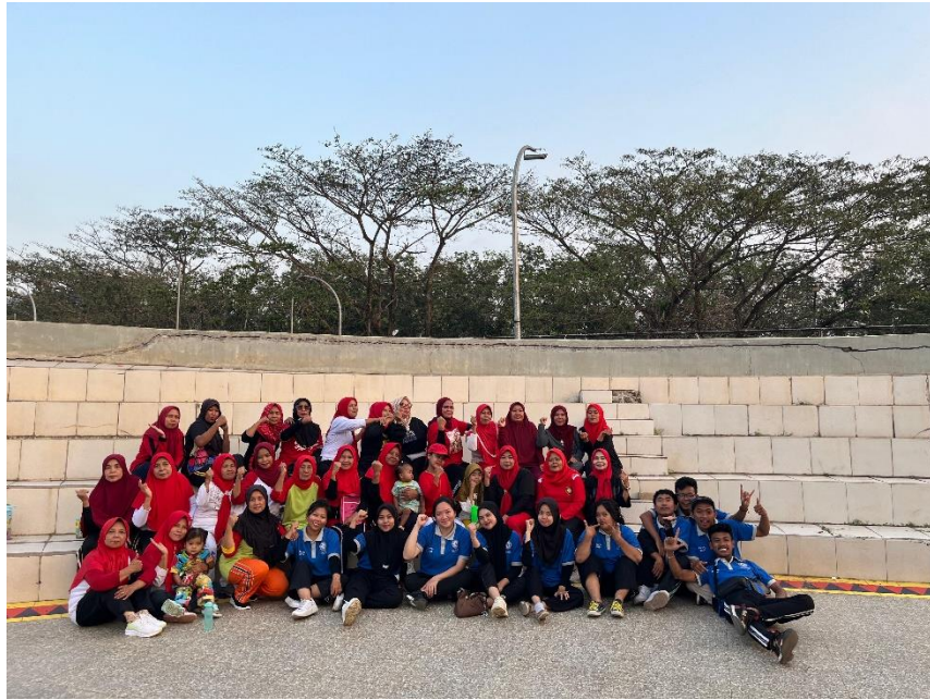
Dokumentasi Senam Rutin Di Dusun Sidototo