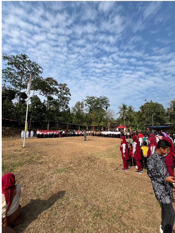
Dokumentasi Upacara Kemerdekaan Indonesia Ke-79