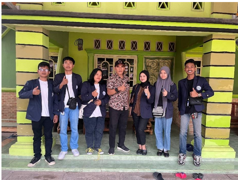
Dokumentasi Kunjungan Ke Dusun Kebagusan II