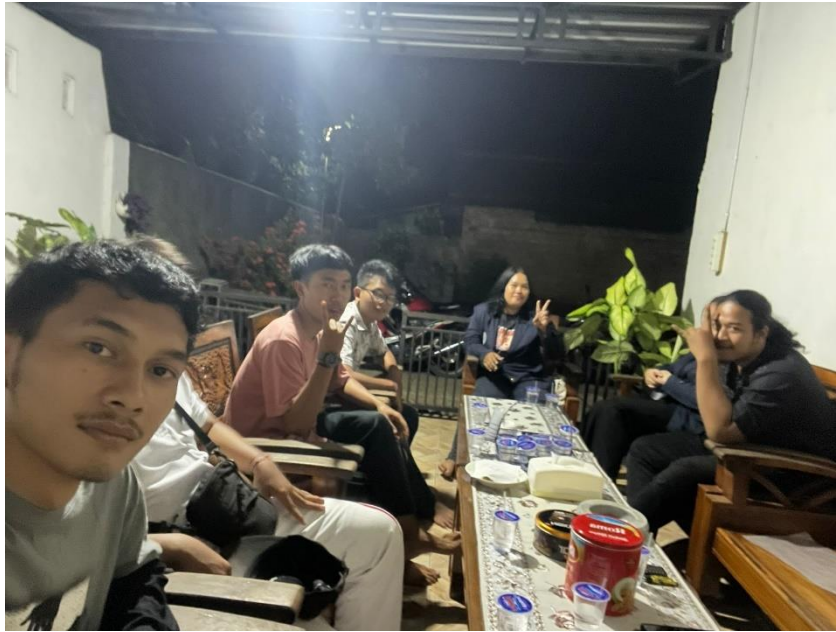
Dokumentasi Kunjungan Ke Kediaman Bapak Kepala Desa