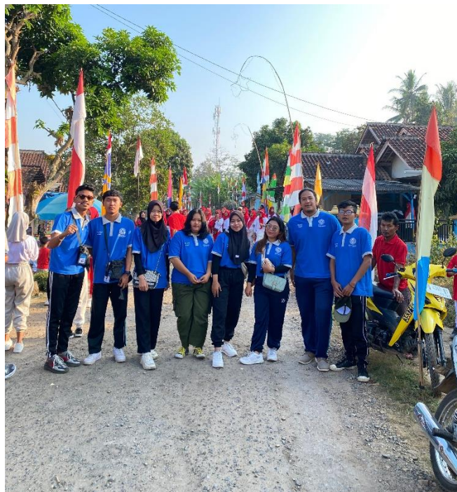
Dokumentasi Kegiatan Jalan Sehat Desa Kebagusan