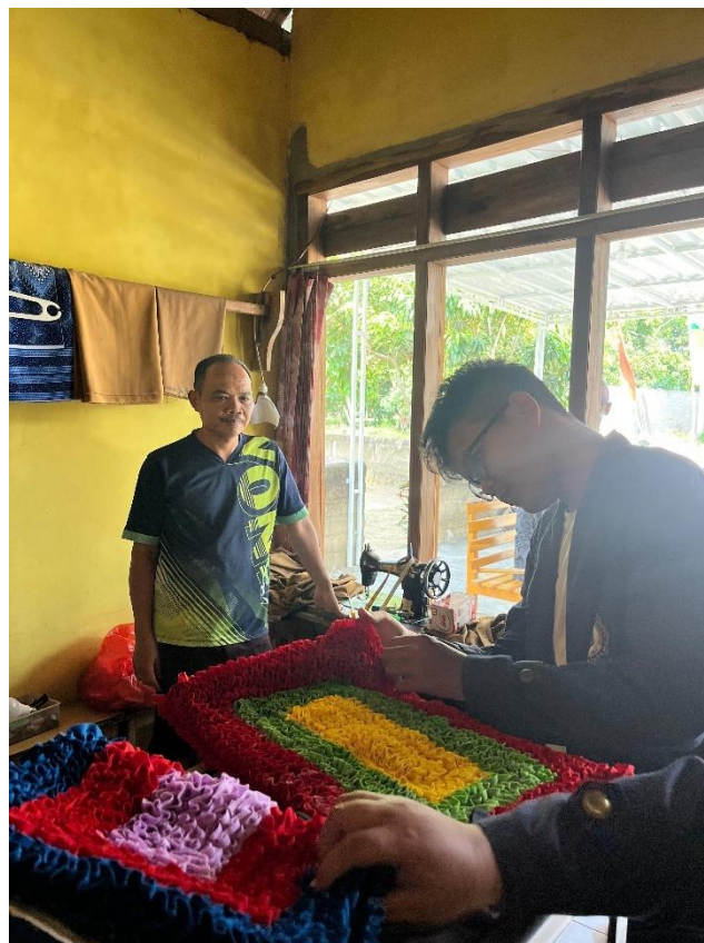
Dokumentasi survey UMKM Taylor Way Layap II