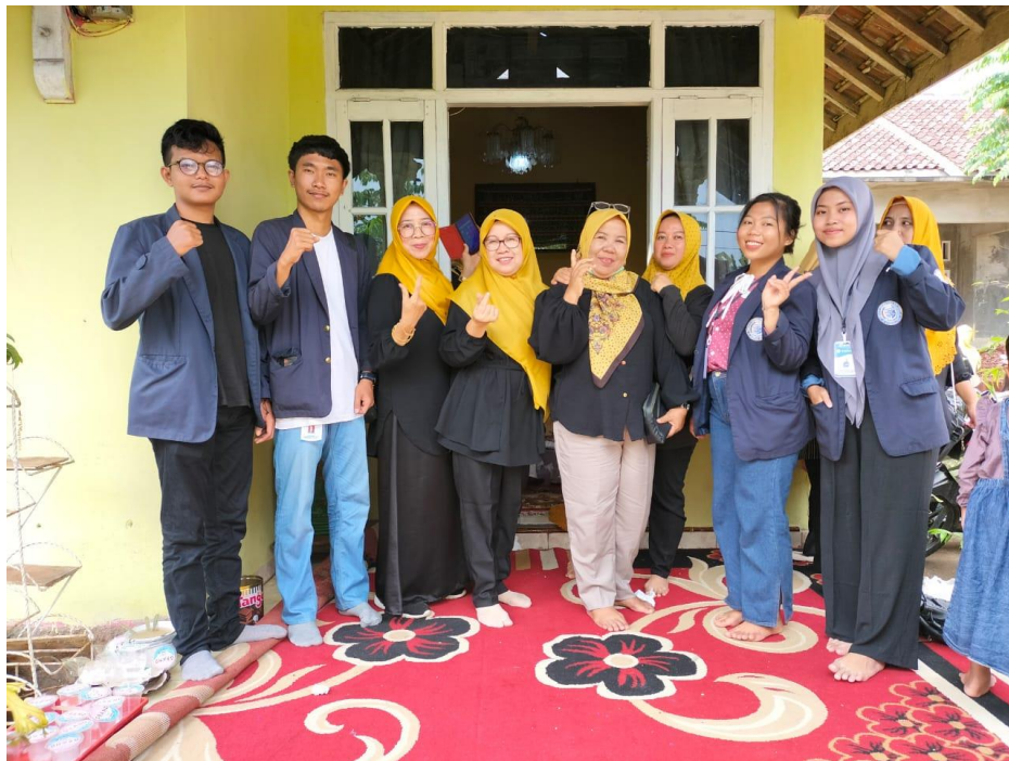
Dokumentasi Rapat Kader PLI Desa Kebagusan