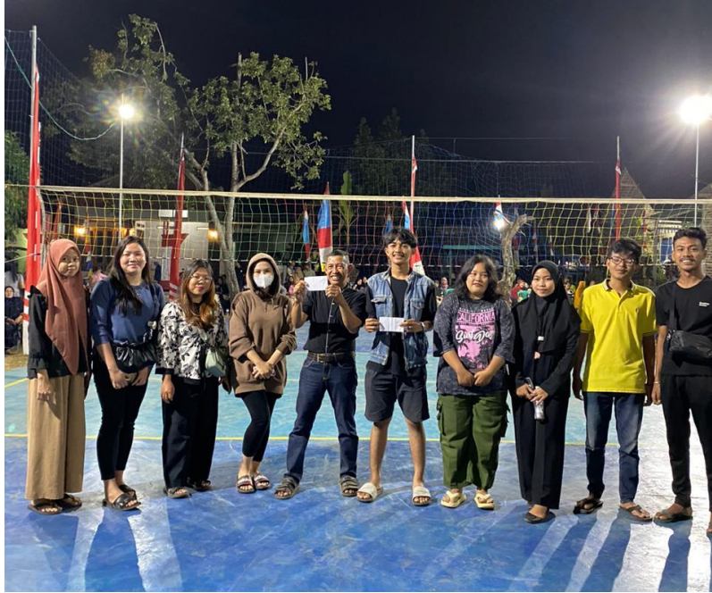
Dokumentasi Menghadiri Open Tournament Bola Volley