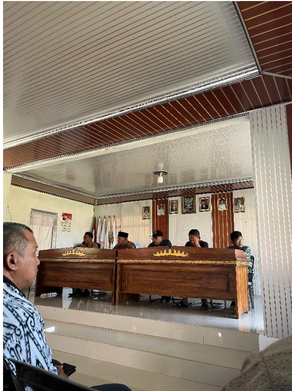
Dokumentasi Rapat Jalan Sehat Bersama Perangkat Desa