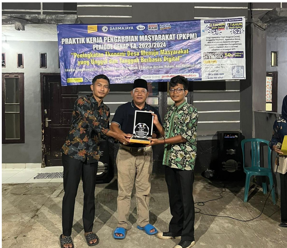
Dokumentasi Penyerahan Plakat Kepada Kepala Desa Kebagusan