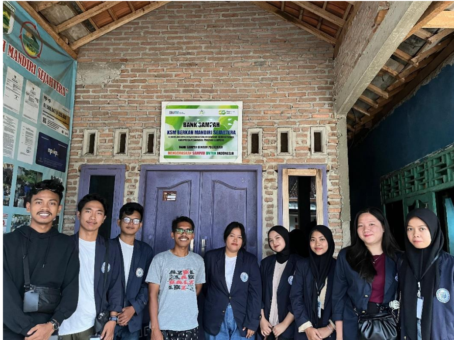
Dokumentasi Kunjungan Ke Bank Sampah