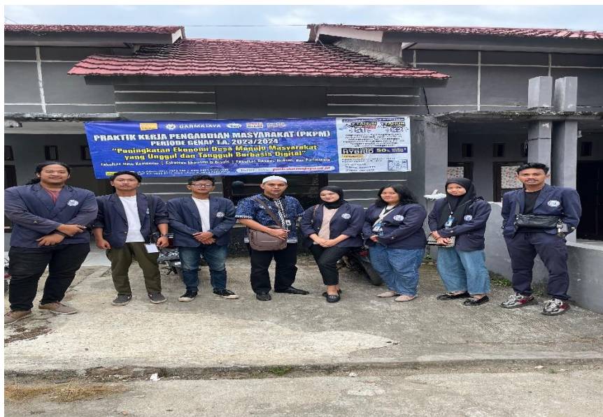
Dokumentasi DPL Datang ke-2 Di Posko Anak PKPM