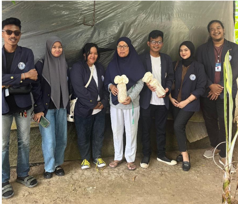
Dokumentasi survey UMKM Jamur