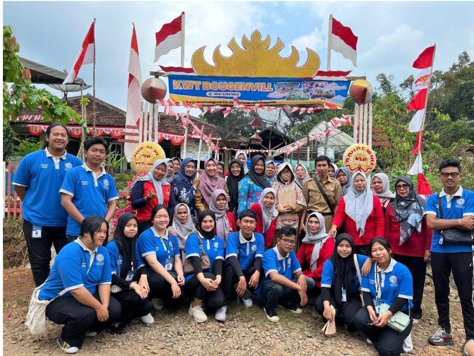
Dokumentasi Menghadiri Perlombaan KWT Dusun Triharjo