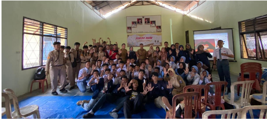
gambar 2 11 Sosialisasi Forum Anak