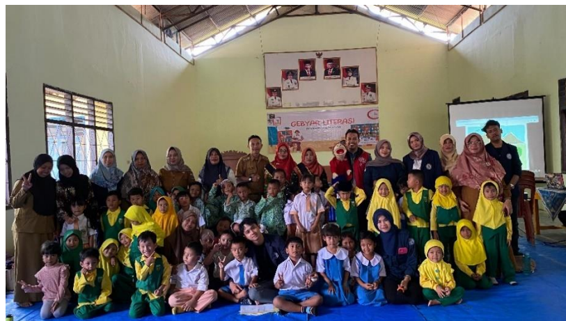
gambar 2 9 Sosialisasi Forum Anak

Salah satu kegiatan yang dilakukan pada saat PKPM adalah melakukan sosialisasi Forum Anak bersama Kelurahan Ganjar Agung yang dihadiri oleh beberapa anak-anak dari TK yang ada di Kelurahan Ganjar Agung dengan memberikan materi tentang pentingnya belajar dan satu hari tanpa gadget serta melakukan beberapa aktivitas lainnya yang membangun anak-anak menjadi anak yang tidak malu di depan publik atau komunitas, contoh kegiatannya seperti bernyanyi dan menari bersama.