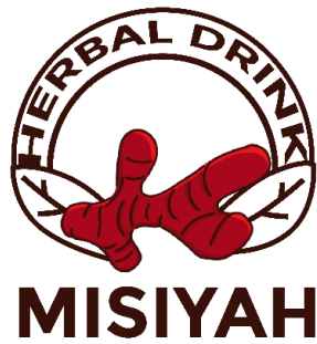
gambar 2 15 Desain Logo UMKM Herbal Drink