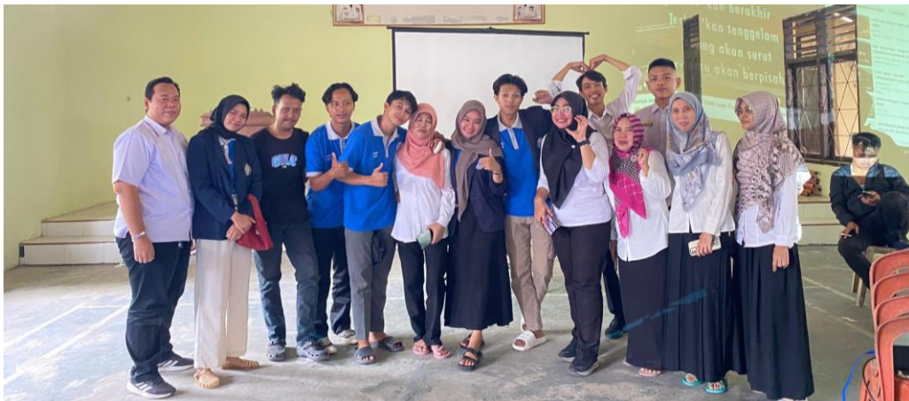
gambar 2 6 Aparatur desa yang terlibat program Smart Village

Bimbingan ini diharapkan dapat memberikan aparatur desa/kelurahan pengetahuan dan keterampilan yang diperlukan untuk menjalankan dan mewujudkan program SMART VILLAGE secara efektif, serta mendukung pencapaian tujuan pembangunan desa yang berkelanjutan.