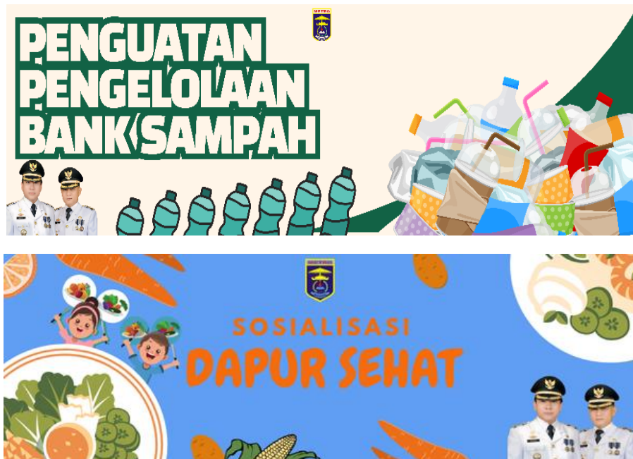
gambar 2 10 Desain Banner untuk kegiatan di kelurahan Ganjar Agung