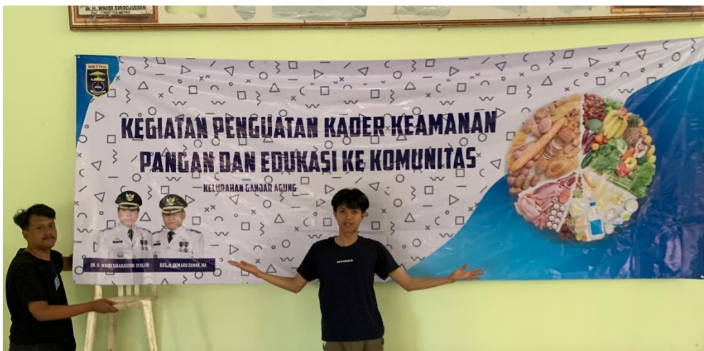
gambar 2 8 Pemasangan Banner Penguatan kader keamanan pangan