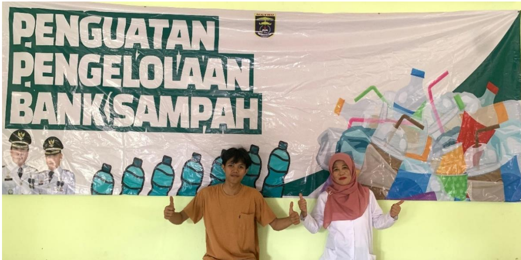
gambar 2 7 Pemasangan Banner Penguatan Pengelolaan Bank sampah

Melalui pendekatan desain yang strategis dan kreatif, diharapkan banner dan poster ini akan menjadi alat yang efektif dalam menginformasikan dan memotivasi warga Ganjar Agung untuk berpartisipasi aktif dalam setiap acara dan program yang ada.