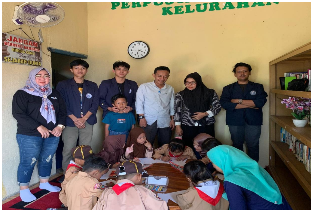
gambar 2 12 Kegiatan Rumah Pintar Kelurahan Ganjar Agung

Setiap hari jumat di Perpustakaan Kelurahan Ganjar Agung yang memiliki beberapa kegiatan, salah satunya adalah Rumah Pintar yaitu dengan melakukan kegiatan membaca buku, menulis huruf dan angka, membuat kreasi origami dan lain-lain bersama anak-anak TK di Kelurahan Ganjar Agung.