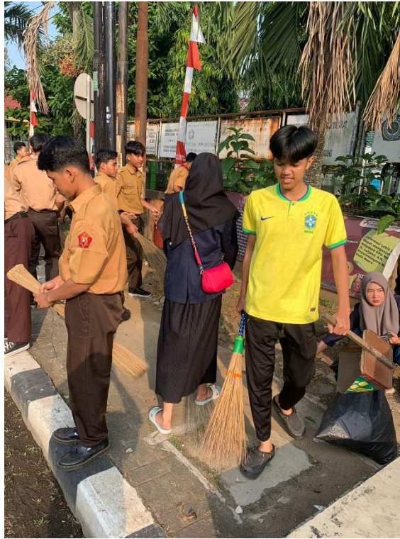
gambar 2 14 Gotong Royong