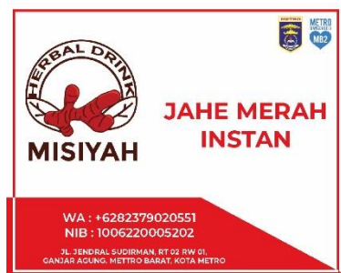
gambar 2 16 Desain Stiker UMKM Herbal Drink

UMKM Herbal Drink milik ibu misiyah menjadi salah satu UMKM yang menarik perhatian kami karena ibu misiyah menjual produk minuman herbal seperti jahe merah, temulawak dan kunyit dengan melakukan produksi dan pemasaran seorang diri tanpa bantuan dari manapun, dengan bahan dan alat seadanya dan ibu misiyah sangat menjaga kualitas dari produknya tersebut dan tanpa menggunakan bahan pengawet lainnya. Karena keterbatasan dalam memasarkan produk serta kurang menariknya Stiker yang digunakan oleh ibu misiyah maka kelompok kami melakukan Re-branding dengan merubah stiker yang lama menjadi stiker yang lebih menarik perhatian konsumen