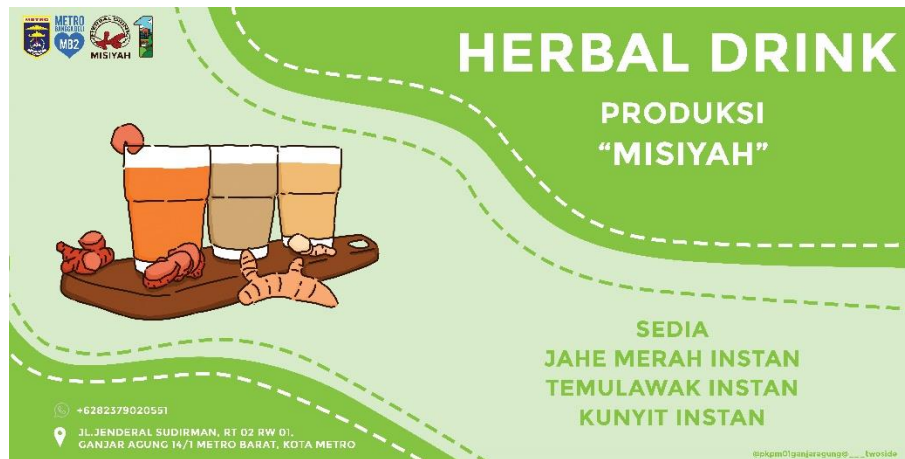
gambar 2 17 Desain Banner UMKM Herbal Drink

kurang menariknya benner yang digunakan oleh ibu misiyah maka kelompok kami melakukan Re-branding dengan merubah benner yang lama menjadi benenr yang lebih menarik perhatian konsumen