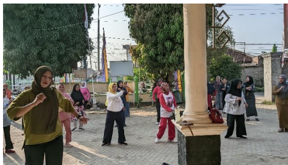
Mengikuti senam pagi di kantor kelurahan