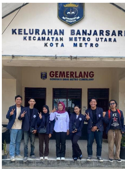
Foto Bersama Lurah Banjarsari