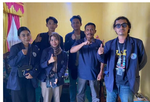
Silaturahmi dengan Kepala Kelurahan serta RW Se-Kelurahan Banjarsari