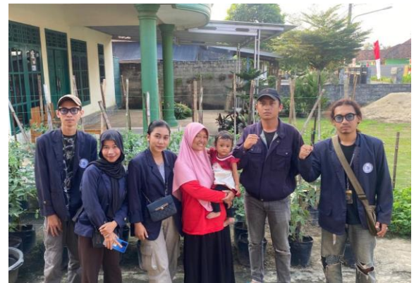
Kunjungan UMKM Yumna Food Industry