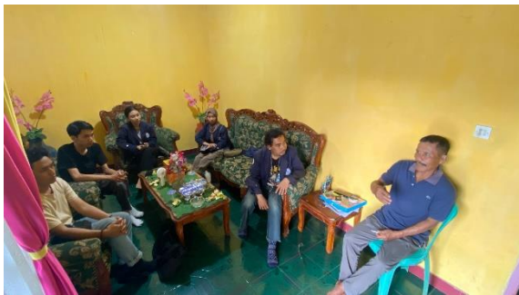
Bincang Hangat dengan RW 05