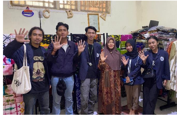
Kunjungan UMKM Canting Batik Metro