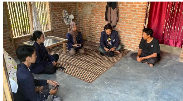
Bincang Hangat dengan RW 07