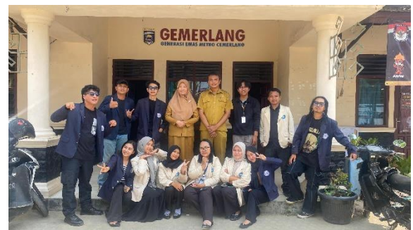
Perpisahan PKPM Darma Wacana