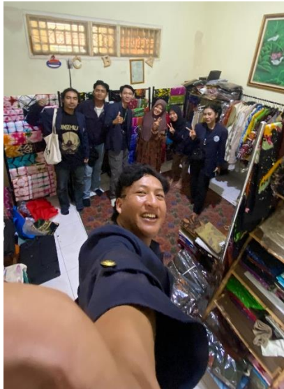
Kunjungan UMKM Canting Batik Metro