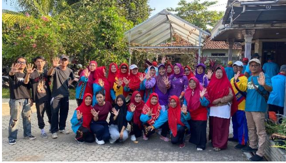
Foto bareng bersama PWRI Metro Utara