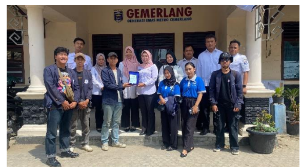
Penyerahan Plakat Kepada Kelurahan Banjarsari