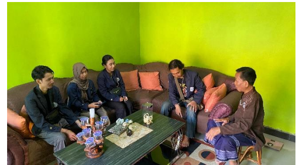
Bincang Hangat dengan RW 08