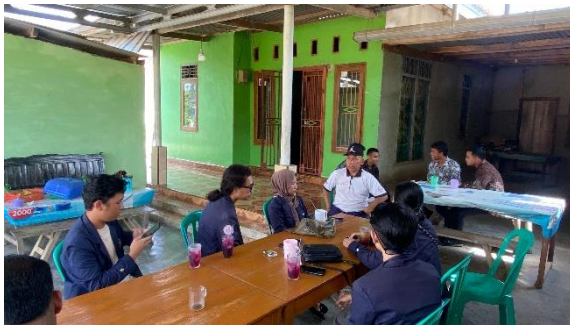
Bincang Hangat dengan RW 06