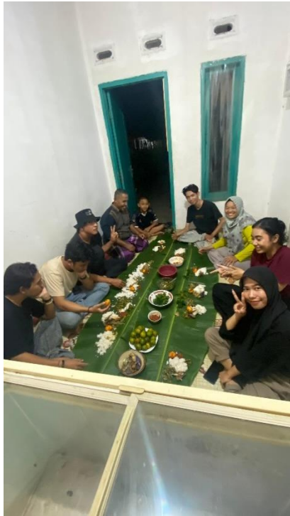
Makan bersama UMKM Yumna Food Industry