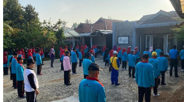
Senam Bersama PWRI Metro Utara