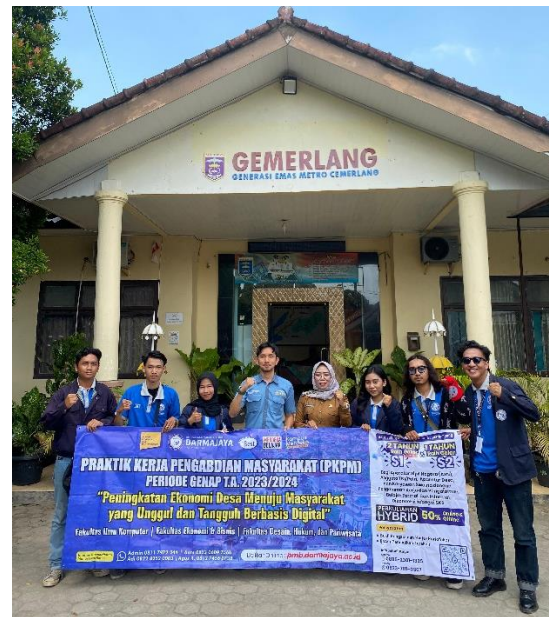
Kegiatan Pelepasan Mahasiswa PKPM di Kecamatan Metro utara