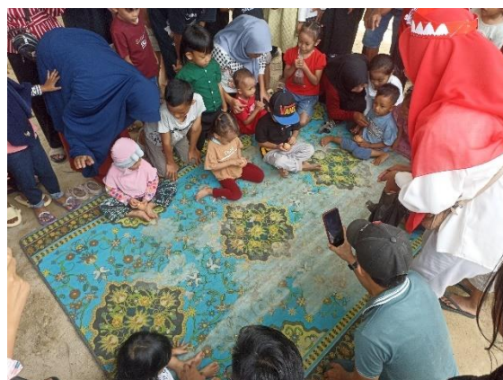
Gambar 2. 9 Lomba Mengupas Telur di RW 08 dan RW 09