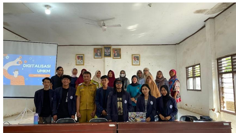
Gambar 2. 6 Foto Bersama Pelaku UMKM