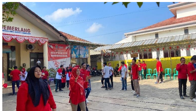
Gambar 2. 10 Lomba Balap Kelereng di Kantor Kecamatan

Kegiatan ini berlangsung dengan semangat yang tinggi dan mendapatkan apresiasi dari semua peserta. Partisipasi mahasiswa PKPM IIB Darmajaya tidak hanya memperluas pengalaman mereka dalam berorganisasi, tetapi juga mempererat hubungan dengan karyawan dan instansi terkait.