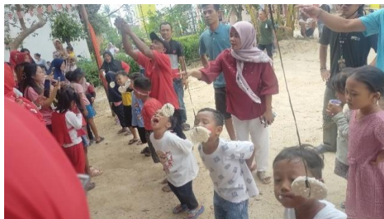
Gambar 2. 8 Lomba Makan Kerupuk di RW 08 dan RW 09

Kegiatan ini berjalan dengan sukses dan mendapatkan sambutan positif dari warga. Partisipasi mahasiswa PKPM IIB Darmajaya tidak hanya memperkaya pengalaman berorganisasi mereka tetapi juga mempererat hubungan dengan komunitas lokal.