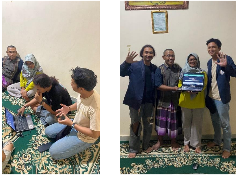
Gambar 2. 3 Penjelasan Sekaligus Penyerahan website Yumna Food Industry