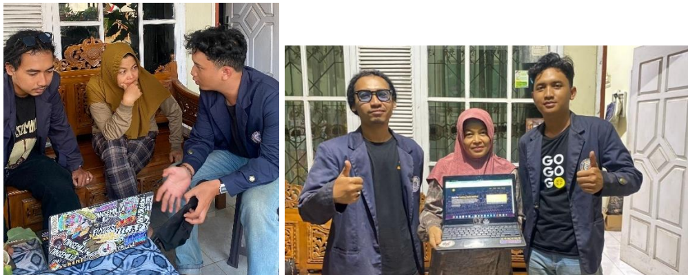
Gambar 2. 4 Penjelasan Sekaligus Penyerahan website Canting Batik Metro