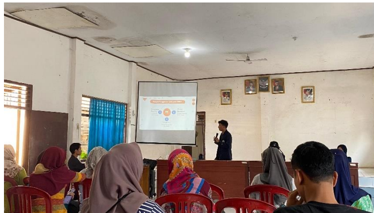
Gambar 2. 5 Pemaparan Materi Penyuluhan Digitalisasi Kepada Pelaku UMKM

Meskipun hasil sosialisasi ini sudah menunjukkan kemajuan yang positif, diperlukan langkah-langkah lanjutan untuk memastikan semua UMKM di Kelurahan Banjarsari Metro Utara dapat sepenuhnya mengadopsi dan memanfaatkan teknologi digital. Oleh karena itu, disarankan untuk terus melakukan pendampingan dan evaluasi secara berkala guna mendukung keberhasilan proses digitalisasi UMKM.