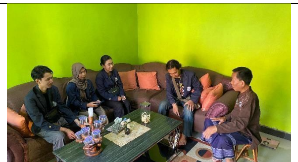
Bincang Hangat dengan RW 08