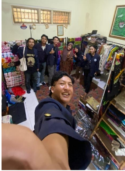
Kunjungan UMKM Canting Batik Metro