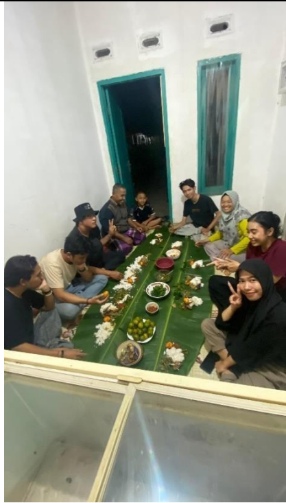
Makan bersama UMKM Yumna Food Industry