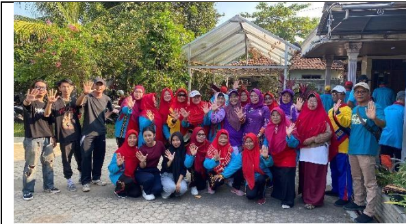
Foto bareng bersama PWRI Metro Utara