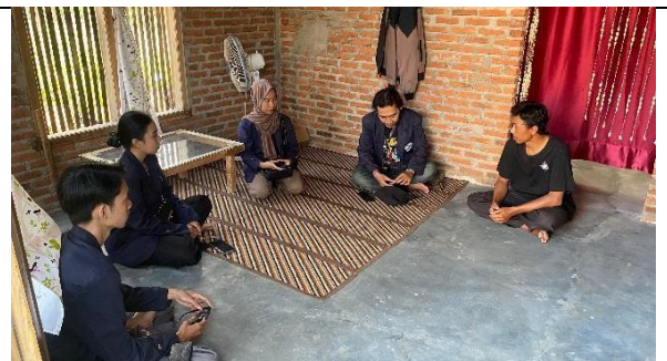
Bincang Hangat dengan RW 07