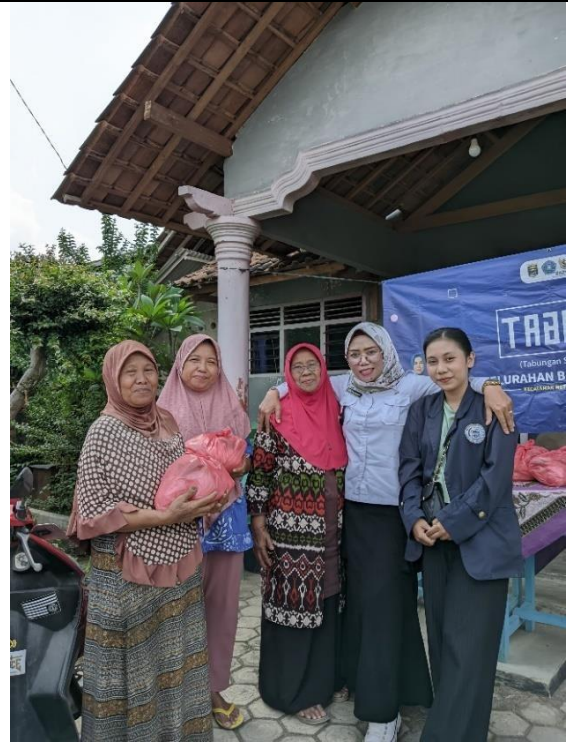
Pembagian TABUH (Tabungan Subuh)