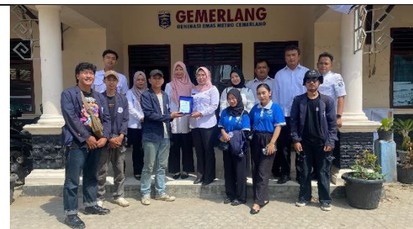
Penyerahan Plakat Kepada Kelurahan Banjarsari