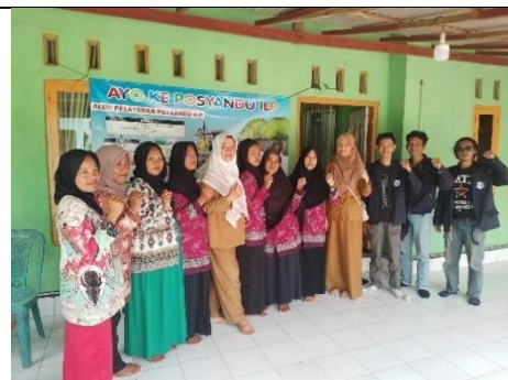
Mengikuti kegiatan posyandu