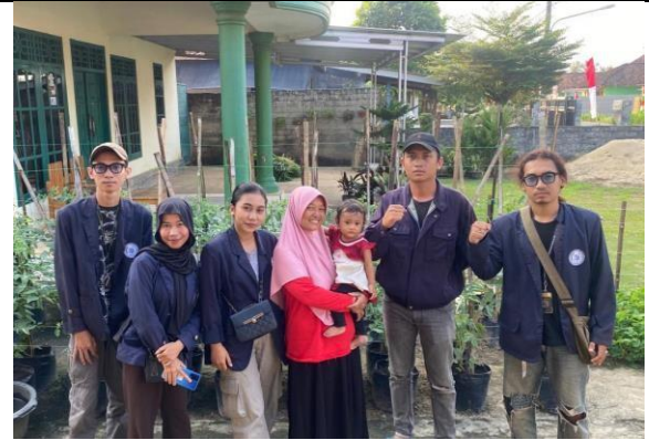
Kunjungan UMKM Yumna Food Industry