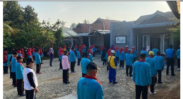
Senam Bersama PWRI Metro Utara