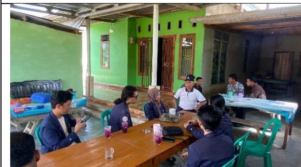
Bincang Hangat dengan RW 06