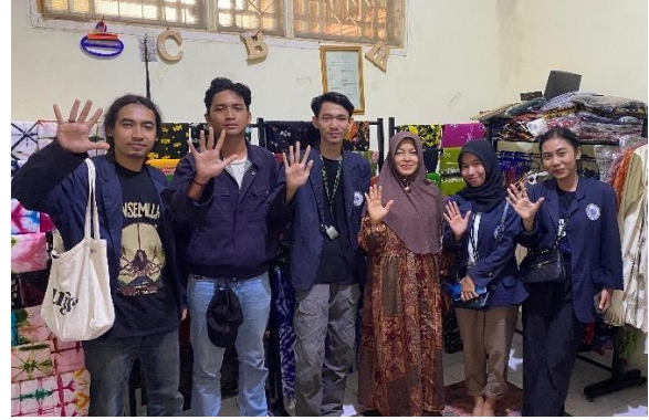
Kunjungan UMKM Canting Batik Metro