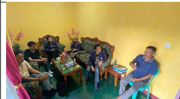
Bincang Hangat dengan RW 05