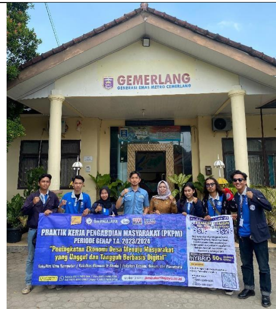
Kegiatan Pelepasan Mahasiswa PKPM di Kecamatan Metro utara