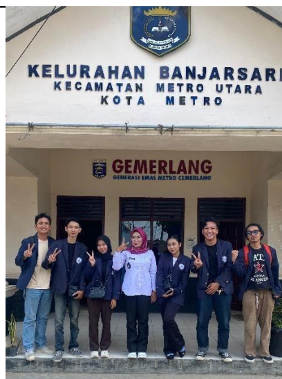
Foto Bersama Lurah Banjarsari