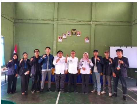
Penarikan Mahasiswa PKPM