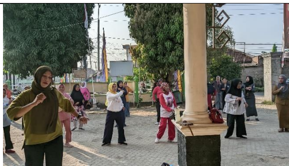
Mengikuti senam pagi di kantor kelurahan