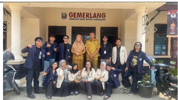
Perpisahan PKPM Darma Wacana