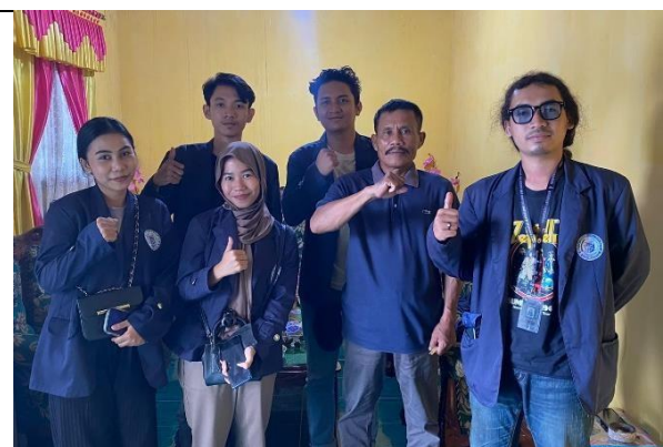
Silaturahmi dengan Kepala Kelurahan serta RW Se-Kelurahan Banjarsari