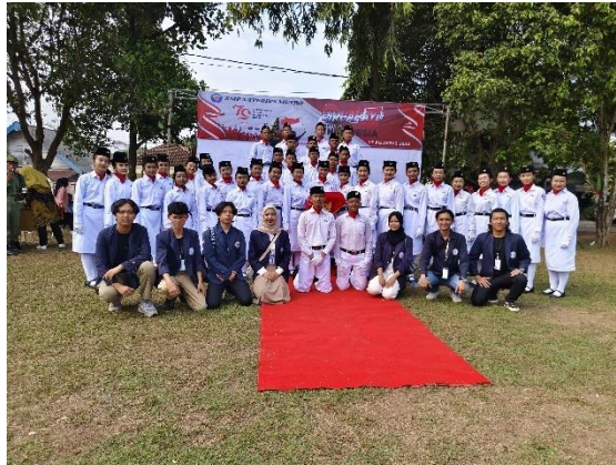
Upacara Hut RI Ke 79 di Lapangan Xaverius bersama siswa-siswi SMP Xaverius dan warga setempat