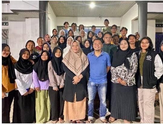
Pembubaran Panitia acara Gebyar Festival Forum Anak Kelurahan Yosorejo sekaligus perpisahan dengan Karang taruna Yosorejo.