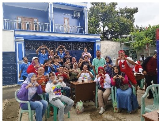
Mendatangi gelaran kegiatan Pasar Seger di RW 08 Kelurahan Yosorejo