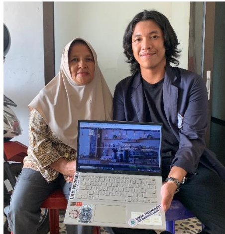
Menjelaskan sistem penggunaan website dan serah terima website tersebut