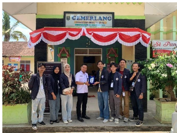
Berpamitan kepada Kepala desa dan penyerahan kenang kenangan