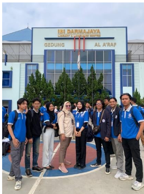
Pelepasan dan Pemberangkatan mahasiswa PKPM di Kampus IIB Darmajaya