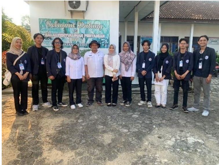
Kunjungan ke kantor Badan Penyuluhan Pertanian Metro Timur