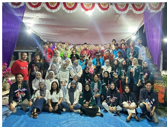
Menghadiri dan berkontribusi pada acara malam puncak Hut RI di RW 08 Kelurahan Yosorejo.