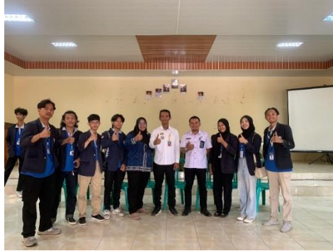
Pemaparan hasil program kerja dan Penjemputan mahasiswa/I PKPM di Kantor Kecamatan Metro Timur