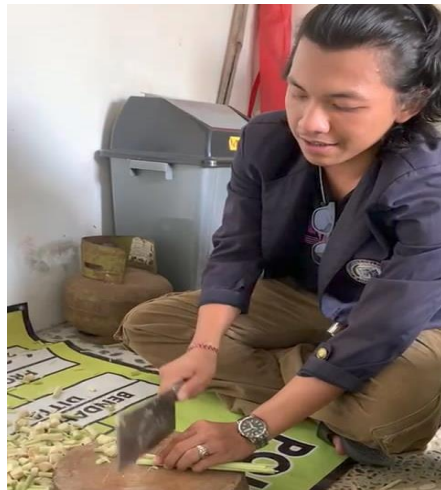
Proses pembuatan produk ASHA