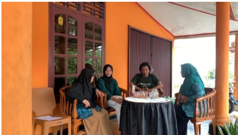
Proses shooting film ILM