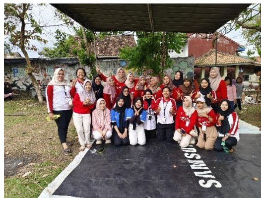
Berkontribusi membantu jalannya acara perlombaan menyambut Hut RI