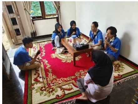
Kunjungan UMKM Edukasi Lebah Madu Trigona dan UMKM ASHA