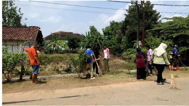
Melakukan kegiatan gotong-royong bersama mahasiswa PKM Universitas Muhammadiyah Metro