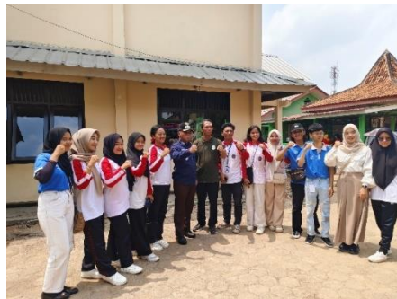
Berkontribusi membantu jalannya acara Gebyar Festival Forum Anak Kelurahan Yosorejo