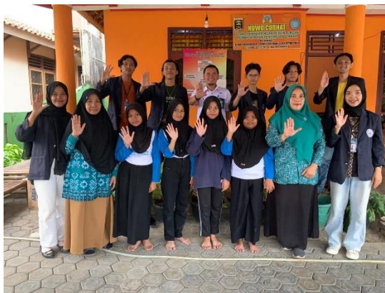
Pengambilan video iklan layanan masyarakat di Rumah Peluk bersama Lurah, Ibu-ibu PKK dan Anak-anak Forum Anak Kelurahan Yosorejo