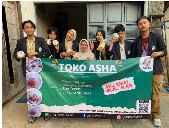
Penyerahan hasil program kerja ke UMKM ASHA