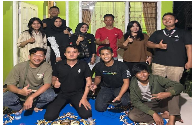
Kunjungan Ke Karang Taruna