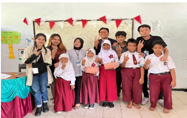
Mengajar di SDN 10 Metro Pusat