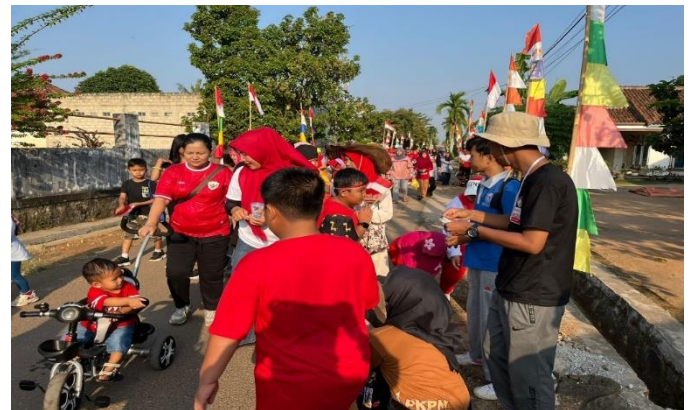
Menjadi Panitia Jalan Sehat