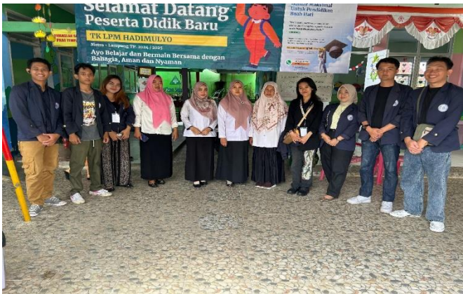
Foto Bersama Guru TK LPM