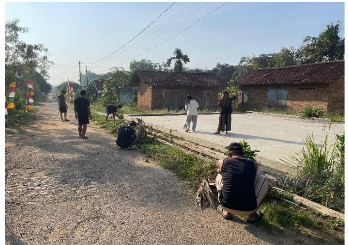
Kegiatan Gotong Royong