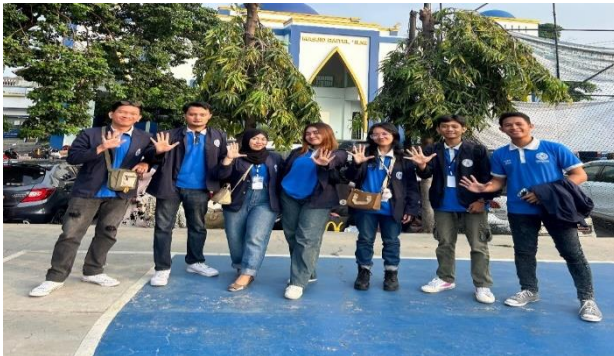
Pelepasan Mahasiswa PKPM