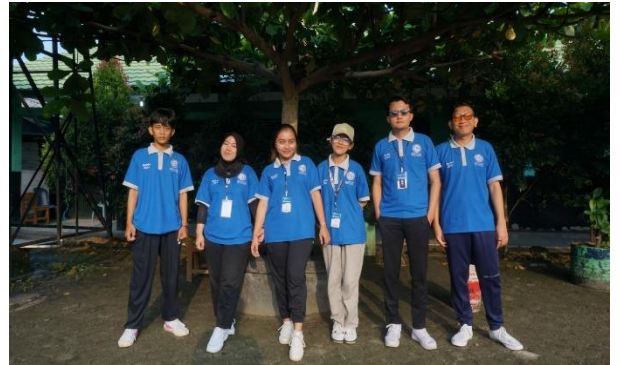
Senam Bersama Ibu-Ibu PKK