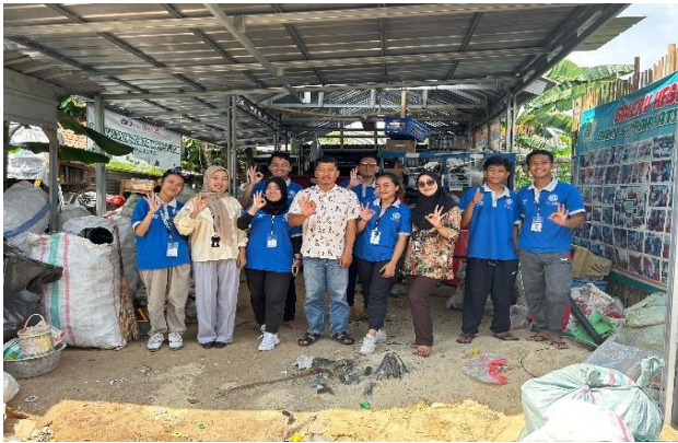
Kunjungan Ke Bank Sampah Unit