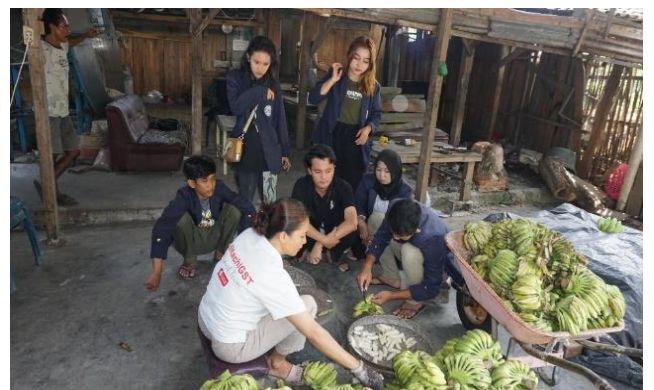
Proses Pembuatan Keripik Pisang