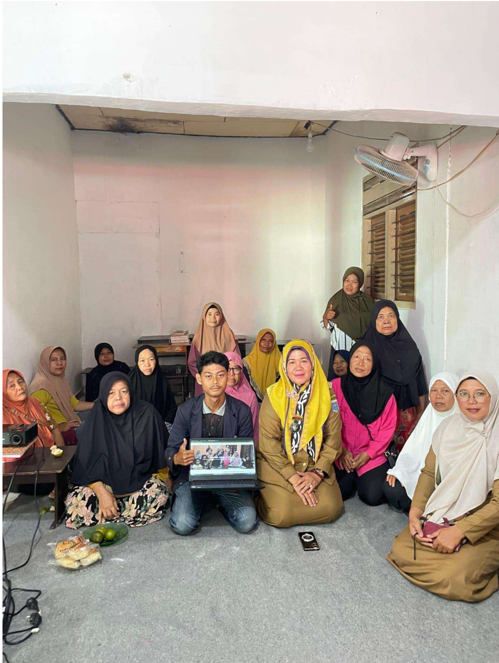
Gambar 2..2 Penyerahan Website UMKM Sentra Jamu Tradisional