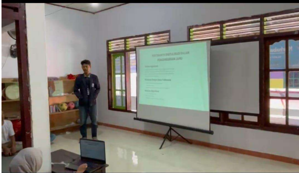
Gambar 2.7 Sosialisasi Digitalisasi UMKM Sentra Jamu Tradisional