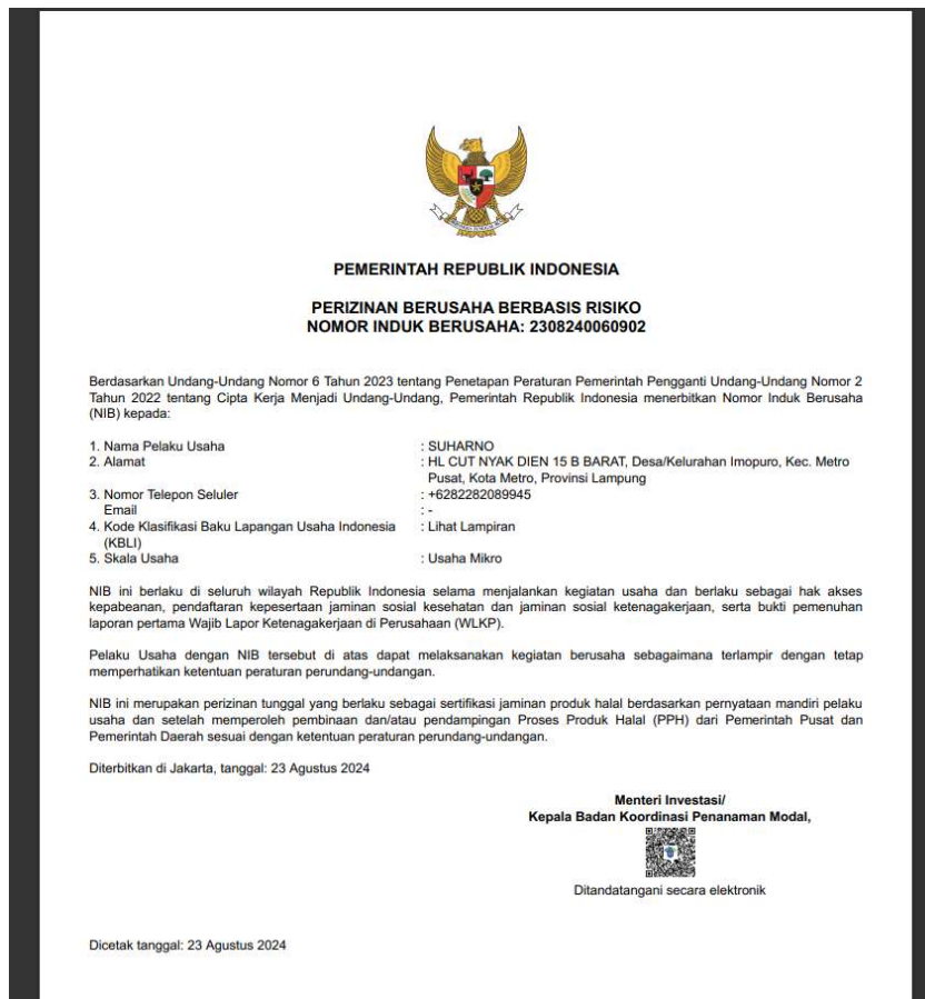
Gambar 2.3 NIB UMKM Jamu Tradisional

NIB atau Nomor Induk berusaha adalah identitas yang perlu dimiliki oleh para pelaku usaha. Identitas ini menjadi penting lantaran para pelaku usaha baru bisa mengajukan Izin Usaha dan Izin Komersial atau Operasional sesuai dengan bidang usahanya masing-masing setelah memiliki NIB, Proses pembuatan Nomor Induk Berusaha (NIB) dimulai dari pembuatan akun yang akan diakses melalui website Online Single Submission (OSS), lalu masukan username dan password. Setelah masuk ke beranda website (OSS). Pilih menu permohonan baru, lalu lengkapi data pelaku usaha, bidang usaha, produk bidang usaha dan terakhir memilih Klasifikasi Baku Lapangan Usaha Indonesia (KBLI). KBLI adalah pengklasifikasian aktivitas/kegiatan ekonomi Indonesia yang menghasilkan produk/output, baik berupa barang maupun jasa, berdasarkan lapangan usaha untuk memberikan keseragaman konsep, definisi, dan klasifikasi lapangan usaha dalam perkembangan dan pergeseran kegiatan ekonomi di Indonesia. Berikut ini merupakan sertifikat NIB UMKM Jamu Tradisional terlihat pada gambar 2.3