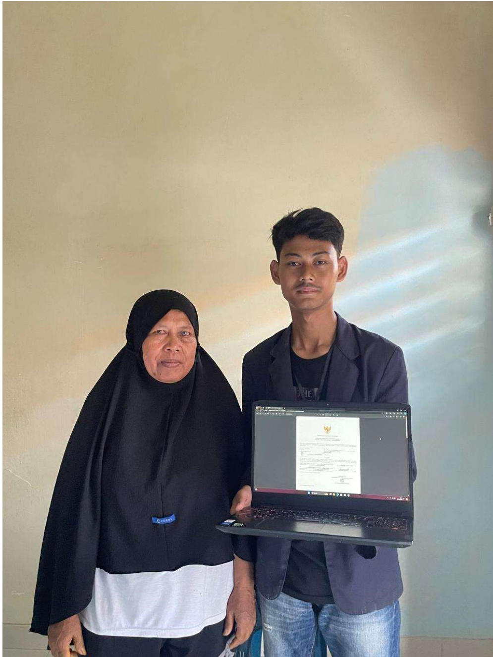
Gambar 2.4 Penyerahan NIB UMKM Jamu Tradisional