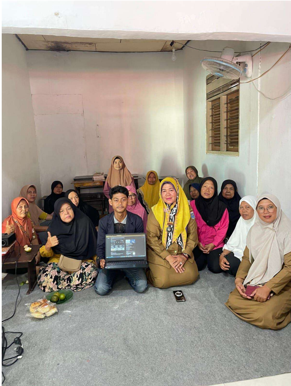
Gambar 2.6 Menampilkan Google Maps UMKM Sentra Jamu Tradisional