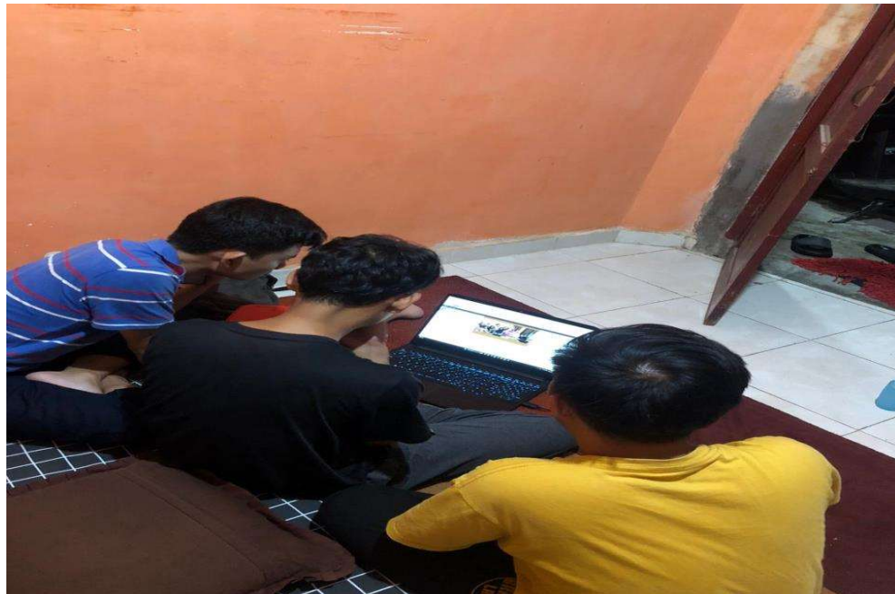
Gambar 2.1 Tampilan Website UMKM Sentra Jamu Tradisional Imopuro