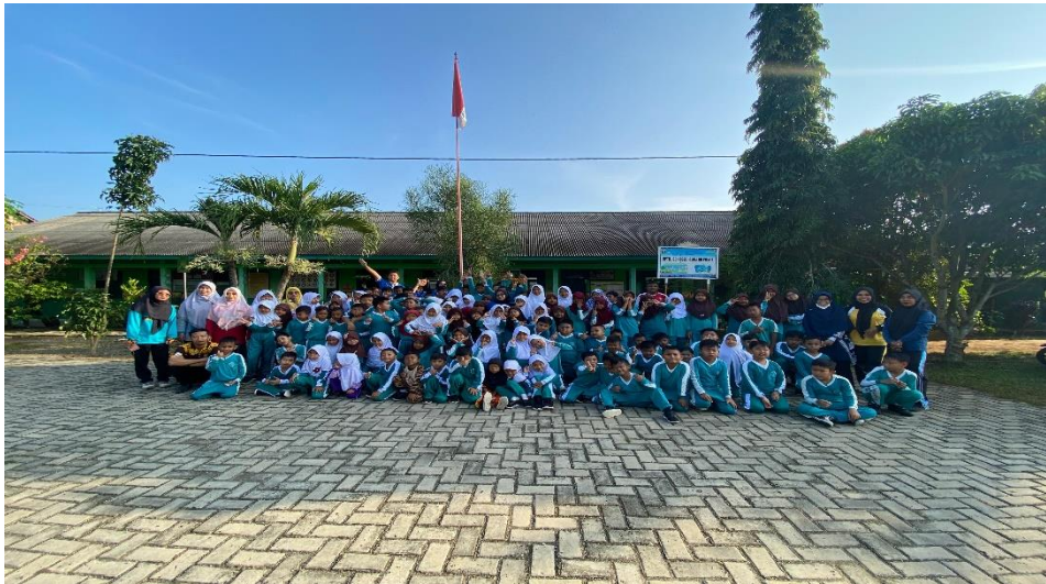
Sosialisasi Bijak Bermedia dan Bullying di SDN 08 Metro Pusat