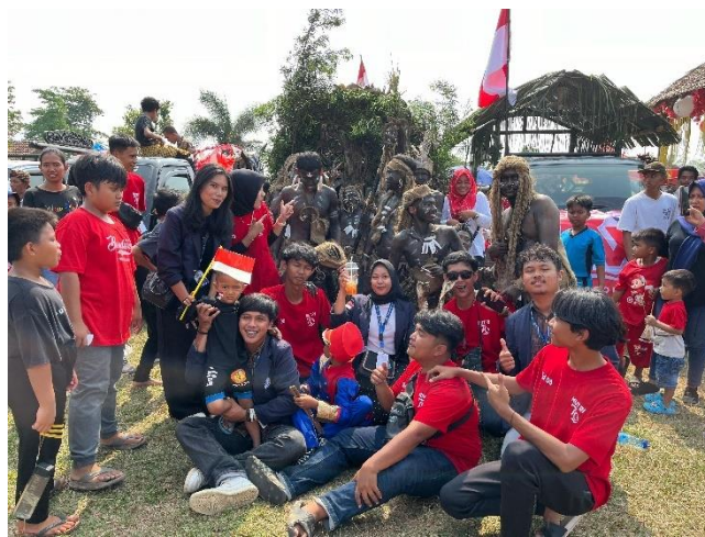
Kegiatan Lomba Agustusan dan Karnaval Budaya