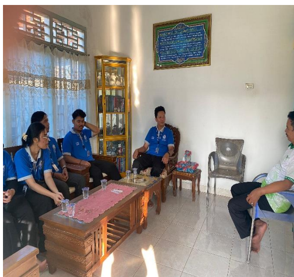
Silaturahmi dengan Ketua RW 09 dan RT 25 Kelurahan Yosomulyo