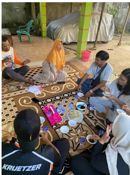
Silaturahmi dengan Ketua RW 09 dan RT 25 Kelurahan Yosomulyo