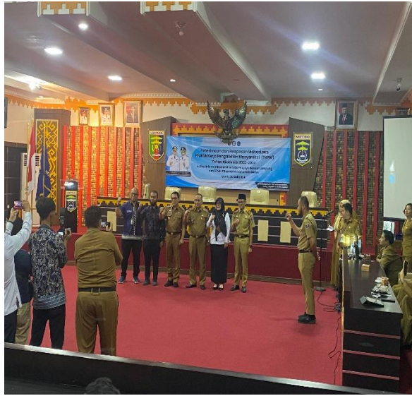
Kegiatan Pelepasan Mahasiswa PKPM