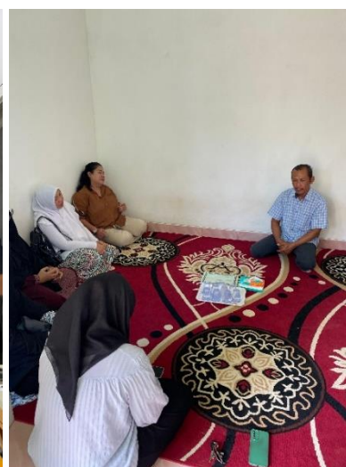
Kunjungan UMKM Kampung Lebah Dan Labany Susu Kambing