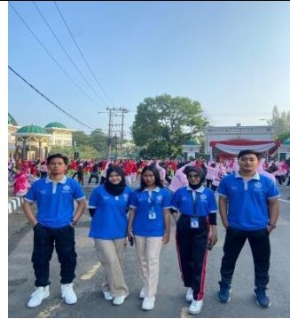
Mengikuti Kegiatan Jalan Sehat & Senam Bersama di Taman Kota Metro