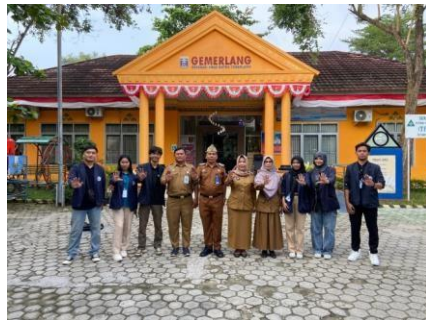
Mengikuti Apel Kecamatan di Kecamatan Metro Timur