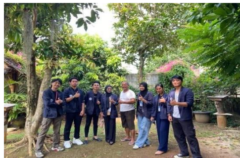
Mengunjungi UMKM Madu Klanceng