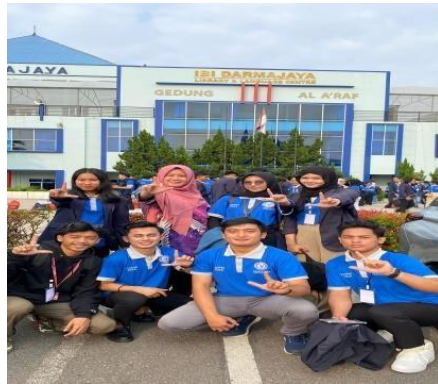
Penyerahan Peserta PKPM ke lokasi