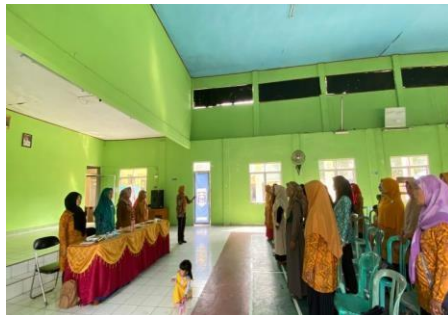
Sosialisasi penyakit kanker bersama ibu-ibu PKK