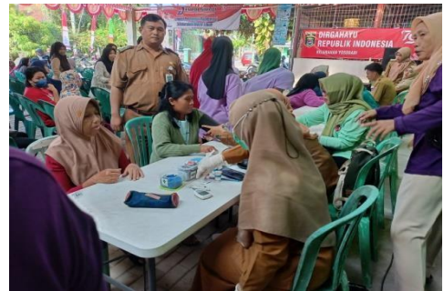
Sosialisasi JEMPOL (Jemput Pelayanan Kolaborasi)