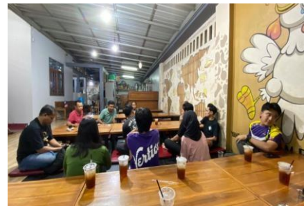
Rapat bersama ketua rt 11 dan pemilik-pemilik UMKM