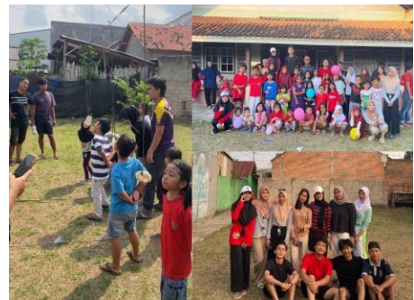
Pelaksanaan Lomba Hut RI