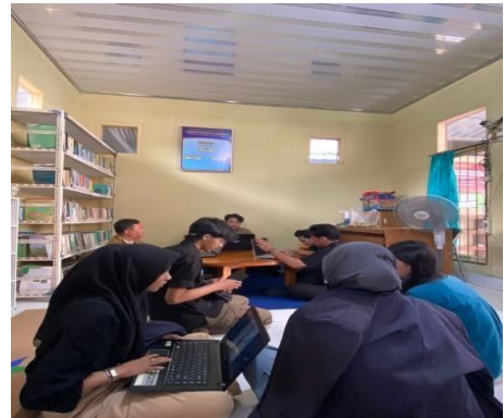
Penginputan data buku perpustakaan kelurahan kedalam web.