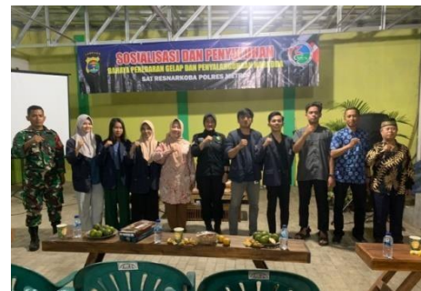
Sosialisasi dan Penyukuhan BNN