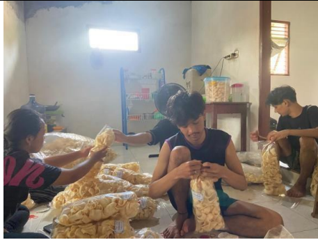
Survei UMKM Kerupuk Bawang Masisso