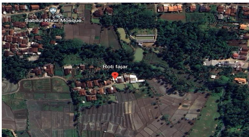
Gambar 1. 2. peta UMKM roti Fajar