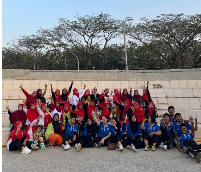
Gambar 9 Mengikuti Senam Rutin Ibu Ibu

Senam sangat bermanfaat dalam mengembangkan komponen fisik dan kemampuan gerak (motor ability). Orang-orang yang terlibat senam akan berkembang daya tahan ototnya, kekuatannya, penergiya, kelenturannya, koordinasi, kelincahan, serta keseimbangan.