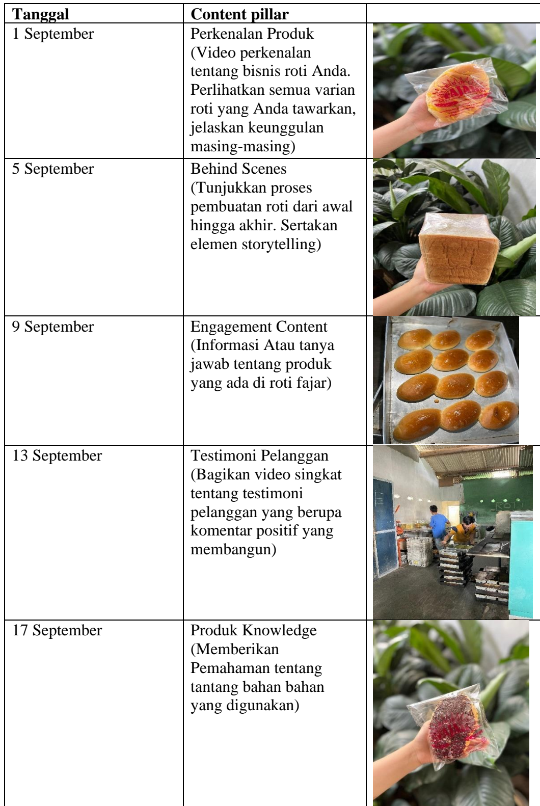
Tabel 3 Content Pillar