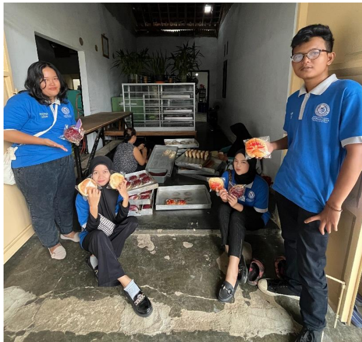
Gambar 4 Survey UMKM Roti Fajar

Penelitian ini dilakukan untuk mengidentifikasi strategi pemasaran yang dibutuhkan oleh pemilik UMKM. Selain itu, kajian ini juga merupakan tahap awal sebelum merancang dan menerapkan strategi pemasaran dan pengembangan inovasi produk UMKM terkait. Dengan melakukan penelitian, kita dapat mengetahui kebutuhan apa saja yang dibutuhkan UMKM dan melaksanakan program dan rencana pengembangan inovasi sesuai kebutuhan para pemangku kepentingan.