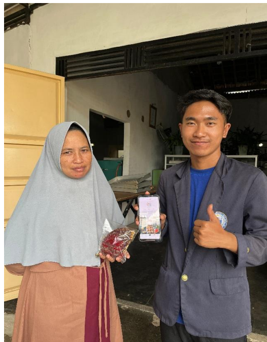
Gambar 20 Penyerahan Program Kerja