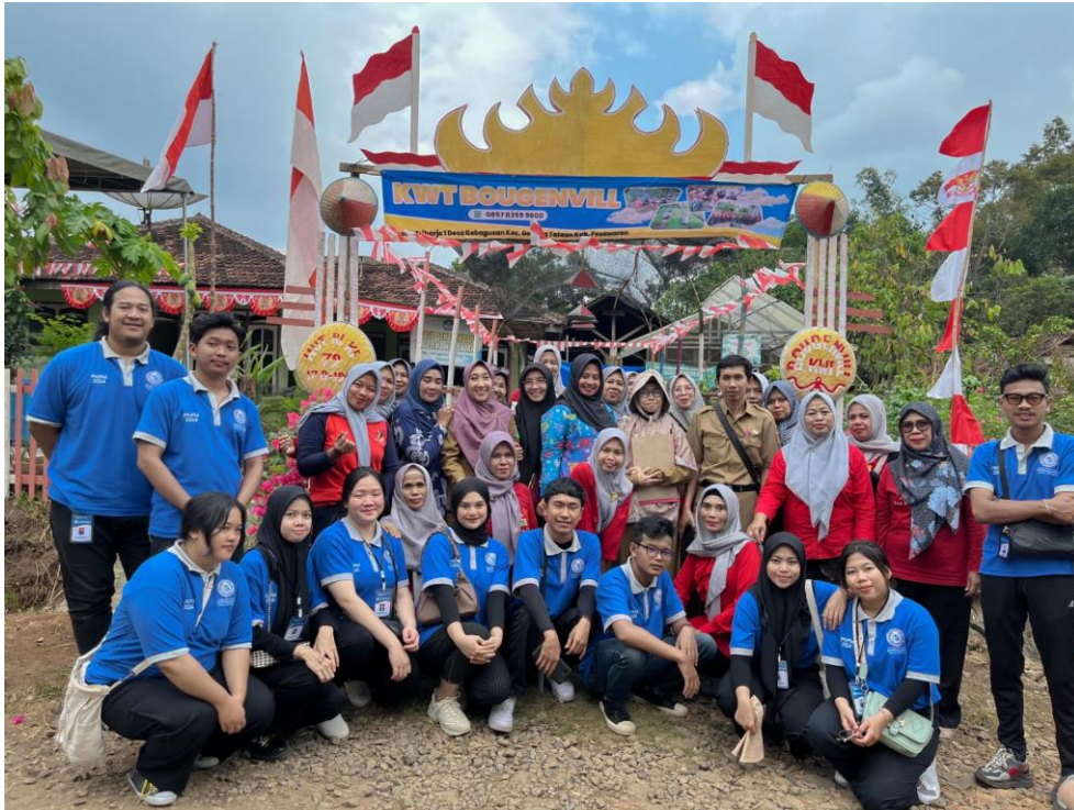
Gambar 11 Foto Bersama Anggota KWT Di Triharjo