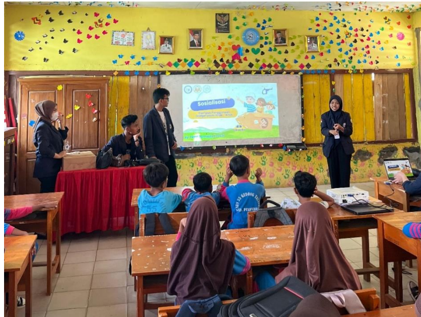
Gambar 7 Sosialisasi Dampak Gadget Pada anak anak

Sosialisasi ini bertujuan untuk memberikan pemahaman yang seimbang tentang dampak gadget bagi anak-anak, serta mengajak orang tua dan siswa untuk lebih bijak dalam mengelola penggunaan teknologi di kehidupan sehari-hari.