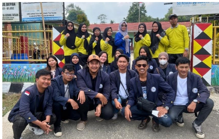
Gambar 8 Foto Bersama Guru di SDN 53 Grdong Tataan