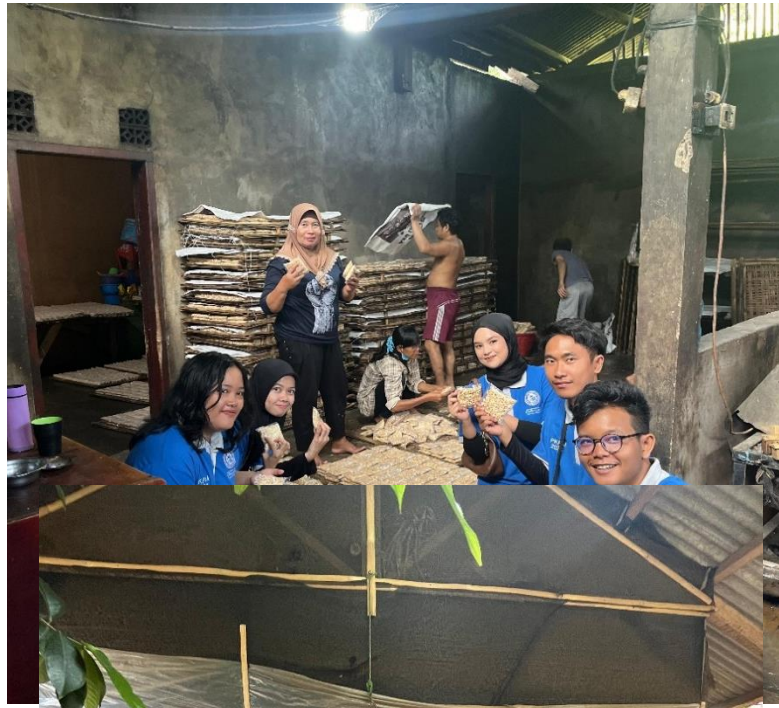
Gambar 5 Survey Kunjungan Ke Industri Pembuatan Tempe