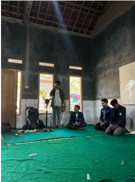
Gambar 17 Sosialisasi Digital Marketing