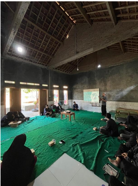
Gambar 18 Sosialisasi Digital Marketing