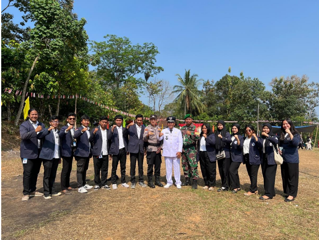
Gambar 14 Foto Bersama Kepala Desa Desa Kebagusan