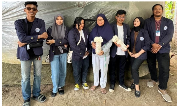
Gambar 6 Survey Kunjungan Ke UMKM Budidaya Jamur Tiram