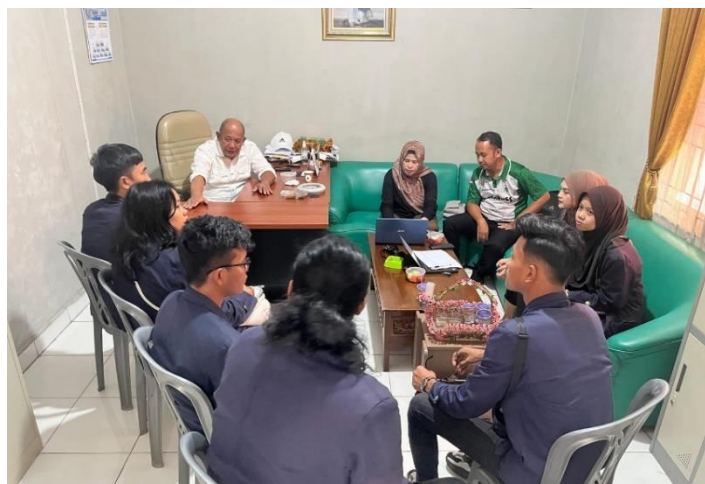
Gambar 3 Silaturahmi Ke Balai Desa

Melakukan kunjungan silaturahmi ke kantor desa setempat. Kami duduk bersama Kepala Desa dan beberapa anggota perangkat desa, membahas berbagai program dan inisiatif yang dapat kami laksanakan selama masa KKN. Suasana penuh keakraban dan semangat kolaborasi tampak jelas, mencerminkan komitmen kami untuk berkontribusi dalam pengembangan desa.