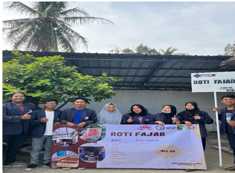
Gambar 16 Design Banner Promosi