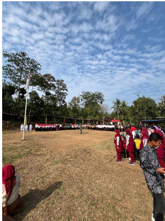
Gambar 13 Pelaksanaan Upacara Kemerdekaan

Pelaksanaan upacara 17 Agustus dalam rangka memperingati Hari Kemerdekaan Republik Indonesia berlangsung dengan penuh semangat nasionalisme. Seluruh peserta PKPM, warga desa, serta perangkat desa berpartisipasi aktif dalam upacara yang diadakan di lapangan utama desa. Upacara dimulai dengan pengibaran bendera merah putih yang diiringi oleh lagu kebangsaan Indonesia Raya, dilanjutkan dengan pembacaan teks Proklamasi, dan pidato dari kepala desa yang mengingatkan pentingnya menjaga persatuan dan kesatuan bangsa. Kegiatan ini menjadi momentum penting untuk memperkuat rasa kebangsaan dan kebersamaan di antara seluruh warga desa dan peserta PKPM.