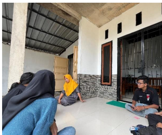
Gambar 12 Pengajuan Program Kerja Kepada Owner Roti Fajar

diskusi produktif dengan pemilik UMKM Roti Fajar. Kami mempresentasikan proposal program kerja kami yang bertujuan untuk mendukung pengembangan dan pemasaran produk UMKM tersebut. dengan pemilik UMKM memberikan tanggapan positif dan masukan berharga. Diskusi ini diharapkan dapat mempererat kerjasama dan memberikan manfaat nyata bagi kedua belah pihak dalam upaya memajukan usaha lokal dan meningkatkan kesejahteraan masyarakat.