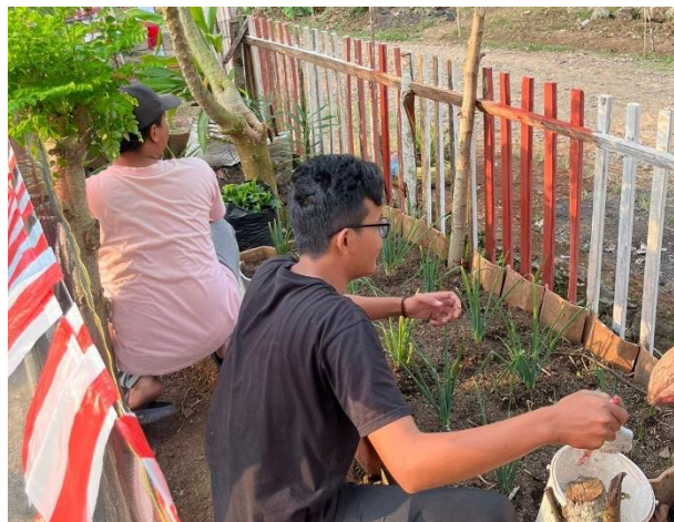
Gambar 10 Gotong Royong KWT

Salah satu tujuan gotong royong adalah menumbuhkan sikap gotong royong antar masyarakat. Ini adalah tempat di mana orang ingin membantu dan mendukung orang lain yang membutuhkan, menyelesaikan masalah bersama, memperkuat persaudaraan, dan memperkuat rasa solidaritas.