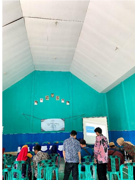
Gambar 2.5 Praktek Pembukuan Menggunakan Aplikasi Buku Kas

Gambar 2.4 menunjukkan pemamparan materi pelatihan yaitu apa itu pembukuan, tujuan pembukuan, manfaat pembukuan, dan cara pembuatan pembukuan.