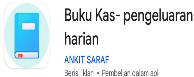
Gambar 2. 1 Aplikasi Buku Kas

keuangan yang lebih tertib dan rapi, yang pada akhirnya dapat mendukung pengambilan keputusan bisnis yang lebih baik. Pelatihan ini menggunakan aplikasi yang bernama Buku Kas yang berguna untuk melakukan pembukuan suatu usaha, aplikasi ini sangat mudah ditemui pada playstore yang ada di smartphone . Dan pelatihan ini disampaikan menggunakan metode diskusi interaktif, serta praktik langsung. Peserta diberikan kesempatan untuk mencoba langsung mencatat transaksi menggunakan aplikasi yang telah diinstal pada smartphone mereka. Instruktur juga memberikan panduan dan solusi atas berbagai masalah yang ditemui peserta selama praktik pelatihan.