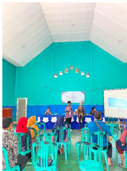
Gambar 2.4 Pemaparan Materi Pelatihan

Gambar 2.3 menunjukkan contoh transaksi yang telah di input di buku kas lalu di cetak ke Pdf. Tampilan yang telah di cetak Pdf sama seperti pencatatan menggunakan buku namun yang membedakannya yaitu lebih cepat dan efisien apabila menggunakan aplikasi buku kas, bisa dimana saja dan kapan saja membuat pembukuan nya.