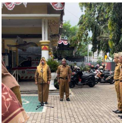
Lampiran 6. Mengikuti Kegiatan Apel rutin di Kecamatan Metro Pusat