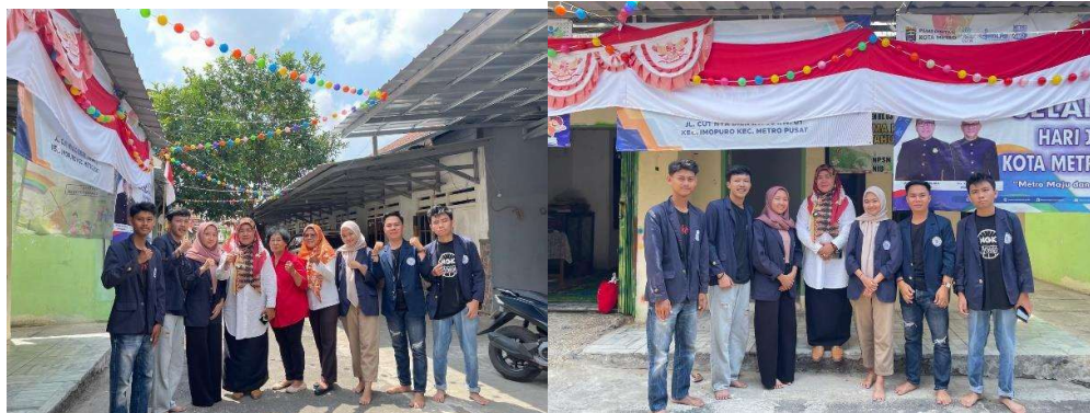
Lampiran 8. Mengikuti Kegiatan Rutin Posyandu dan Promosi Darmajaya