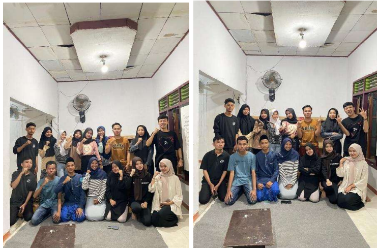
Lampiran 4. Sosialisasi Pertemuan dengan Forum Anak