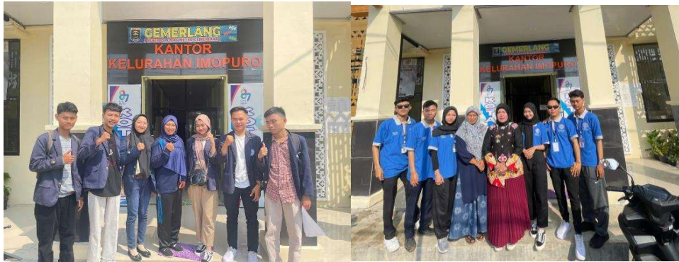
Lampiran 1. Pengenalan Mahasiswa PKPM di Kelurahan Imopuro