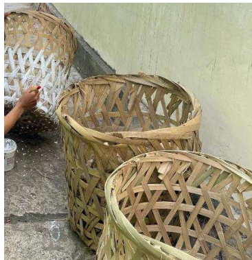
Lampiran 3. Pembuatan dan peletakkan Tempat sampah untuk kebutuhan masyarakat