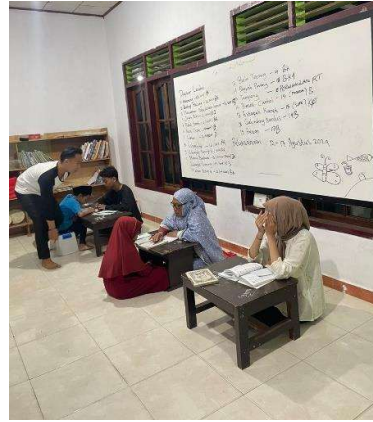
Lampiran 5. Sosialisasi di TPA dan melakukan pembelajaran tentang Pentingnya Pendidikan Agama usia dini