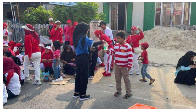
Lampiran 10. Mengikuti Senam Bersama Kelurahan Imopuro dan Melakukan Event Produk jamu