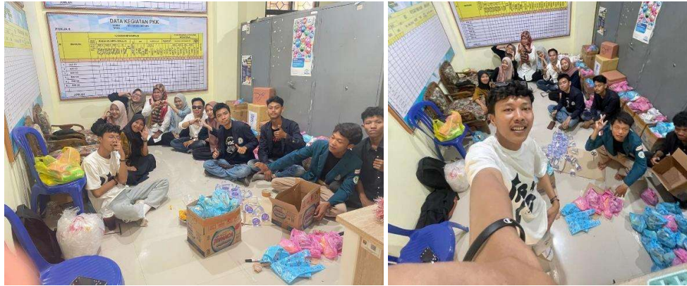
Lampiran 9. Membantu Kelurahan untuk Mempersiapkan Senam Bersama