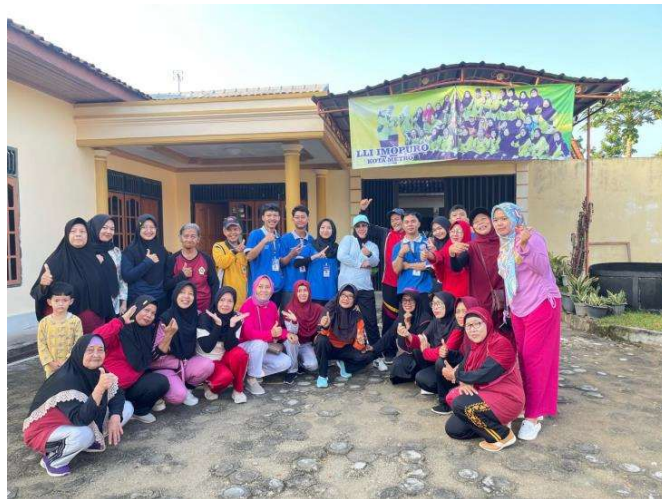
Lampiran 2. Mengikuti Senam Rutin di Kelurahan Imopuro