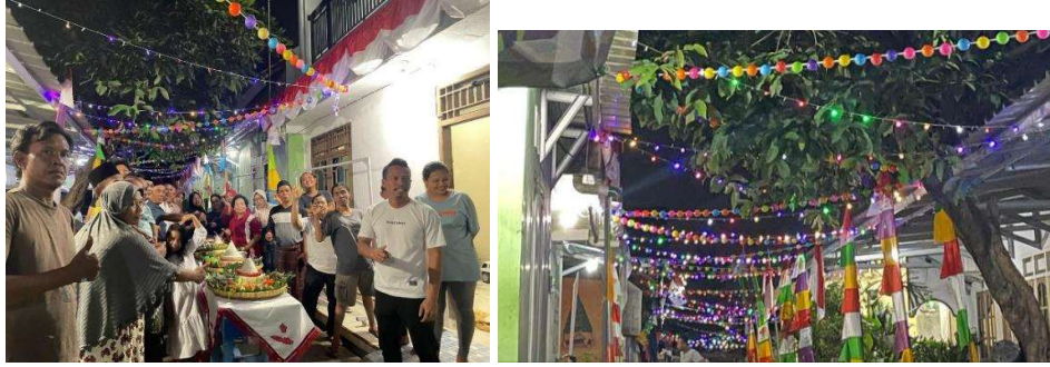
Lampiran 7. Membantu menghias dan mengikuti kegiatan HUT RI