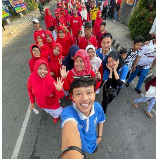
Lampiran 11. Mengikuti dan Memandu Kegiatan Jalan Sehat di Kecamatan Metro Pusat Perayaan HUT RI