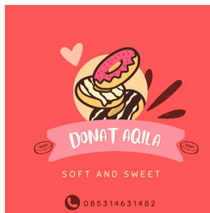
Gambar 3.2 Hasil Desain Logo UMK Donat Aqila

Dengan ini saya memberikan pelatihan pembuatan desain logo UMKM kepada pemilik UMKM Donat aqila.