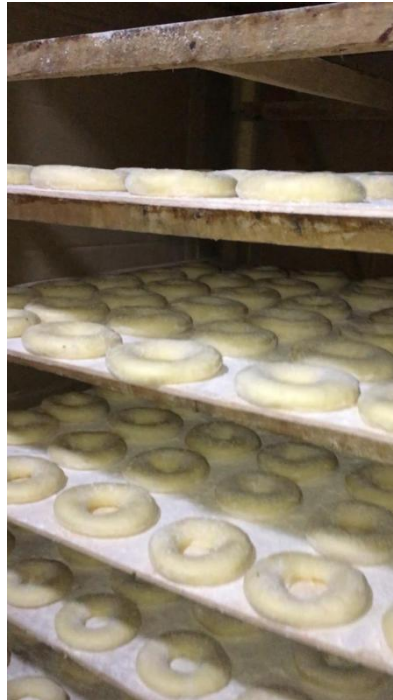
Gambar 2.4 Proses Pengorengan Donat Aqila