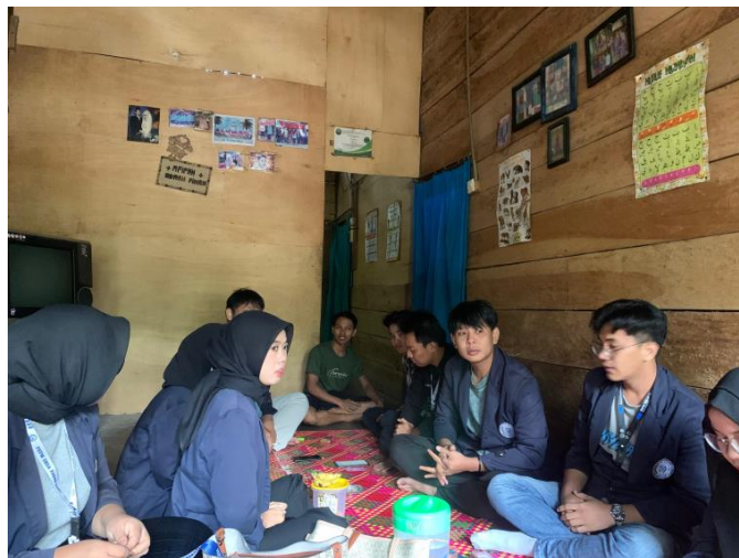
Gambar 2.1 Kunjungan Ke Umkm

Kunjungan dan permohonan izin kepada pemilik UMKM Donat aqila guna keberlangsungan acara. Hal ini diperlukan guna menjalin silaturahmi kepada pemilik UMKM agar mempunyai hubungan yang baik antara mahasiswa dan mahasiswi terhadap UMKM, dan juga dapat mempererat ikatan dalam membantu mengerjakan mengembangkan UMKM selama kegiatan PKPM.