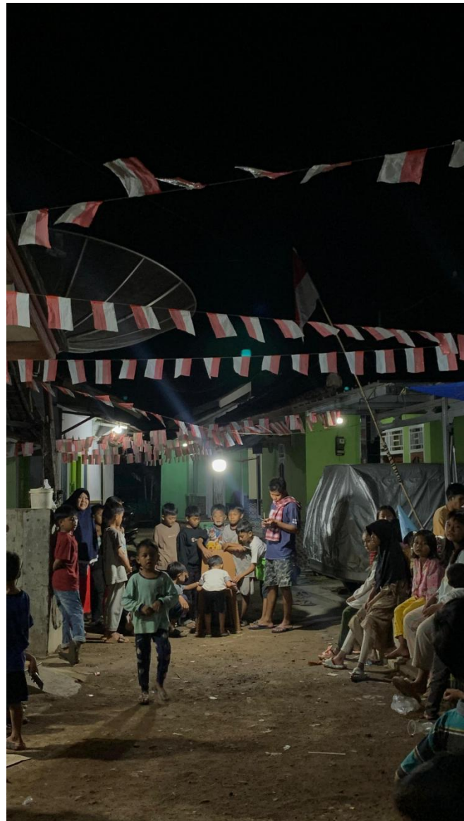
Gambar 2.6 Mengikuti Kegiatan Perlombaan

Lomba ini dilaksanakan supaya menjadi kesempatan untuk semua masyarakat dapat bersosialisasi dan melatih kerjasama dengan warga desa dan mahasiswa PKPM. Lomba ini dilaksanakan agar memeriahkan HUT-RI