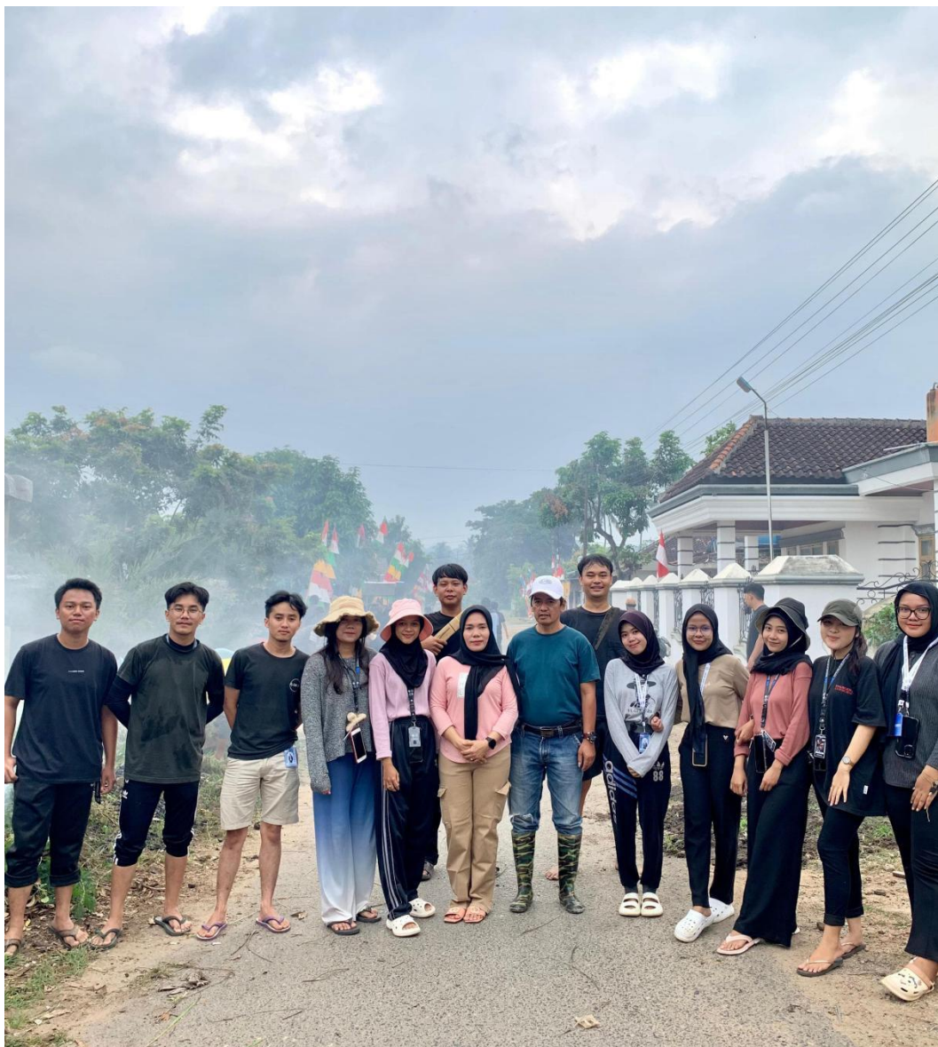
Gambar 2.5 gotong royong dengan warga desa

Salah satu kegiatan yang dilakukan pada saat PKPM yaitu melakukan gotong royong dengan upaya melakukan bersih bersih halaman agar dapat terlihat bersih dan membuat warga sekitar nyaman.