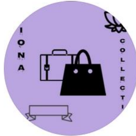
1.1.5 logo Viona Collection sebelum re-branding