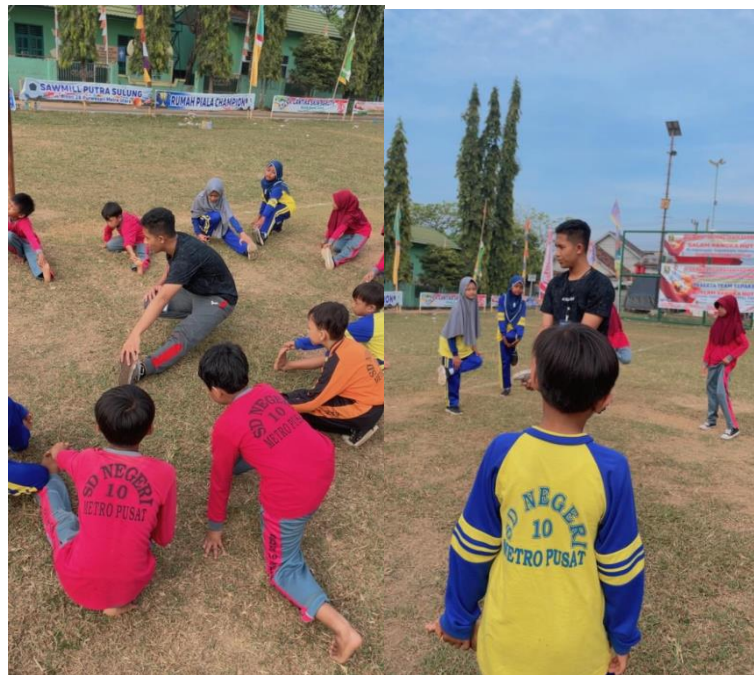
Gambar 1. 14 Memberikan Plajaran PJOK