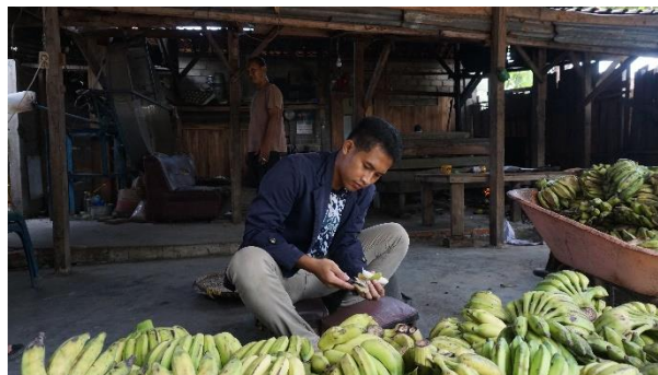
Gambar 1. 6 Pengupasan Kulit Pisang