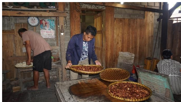
Gambar 1. 9 Pengeringan keripik