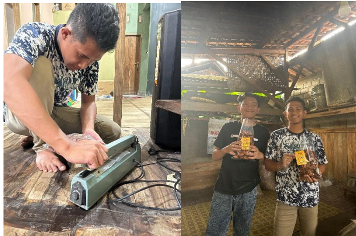
Gambar 1. 11 Pengemasan