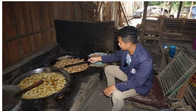
Gambar 1. 8 Penggorengan