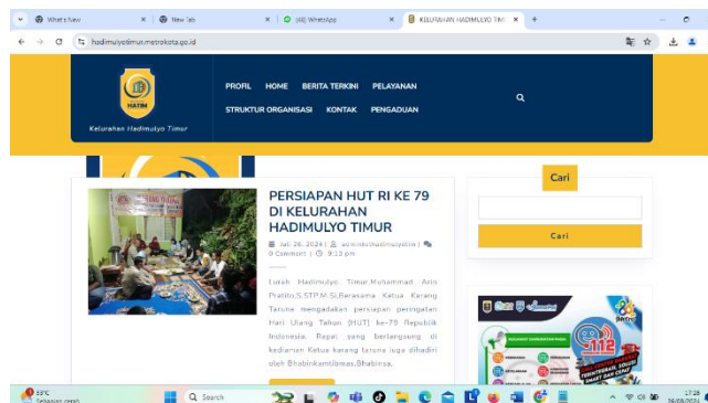
Gambar 1. 3 Website Kelurahan Hadimulyo Timur setelah di perbarui tampilannya dan update informasi rutin.

Merancang pembaharuan berita Website Kelurahan Hadimulyo Timur, pada tahap ini penulis memperbarui dan merancang ulang berita website kelurahan agar mempermudah pelaporan kegiatan pemerintah kelurahan, seperti kegiatan yang akan di lakukan atau sudah di lakukan oleh masyarakat maupun perangkat kelurahan, seperti kegiatan persiapan HUT RI Ke 79 yang akan di lakukan oleh karang taruna C2W, pengambilan beras untuk masyarakat kurang mampu untuk warga masyarakat Kelurahan Hadimulyo Timur, Administrasi kelurahan Hadimulyo Timur, dan Struktur Pemerintah Kelurahan Hadimulyo Timur. Lalu Website yang sudah telah selesai di perbaharui siap untuk dikenalkan kepada perangkat Kelurahan dengan tujuan agar masyarakat dapat mengakses Website Kelurahan.