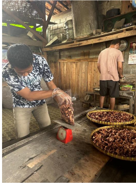
Gambar 1. 10 Penimbangan keripik