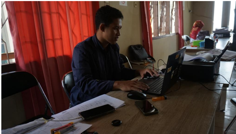
Gambar 1. 2 Melakukan Pengembangan Website Kelurahan Hadimulyo Timur

Pengembangan sistem informasi website adalah merujuk pada proses pembuatan dan pengelolaan situs berita web yang berfungsi sebagai informasi di Kelurahan Hadimulyo Timur dan juga akan di kelola oleh pemerintah Kelurahan.