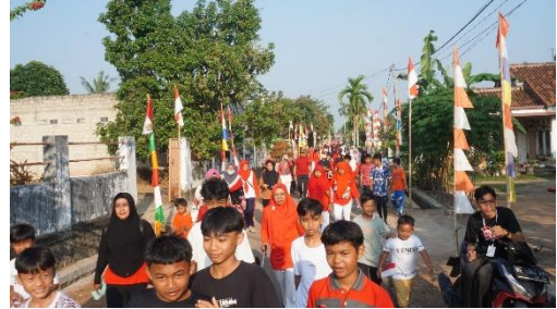
Gambar 1. 13 Berpartisipasi Menjadi Panitia HUT RI