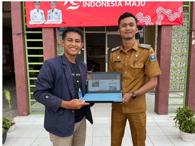
Gambar 1. 5 Penyerahan Web Kelurahan