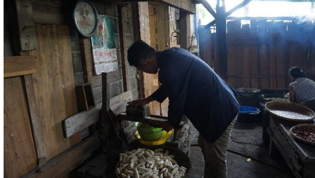
Gambar 1. 7 Pemotongan Pisang