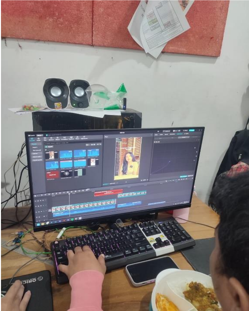
Gambar 1. Mengedit Vidio Promosi