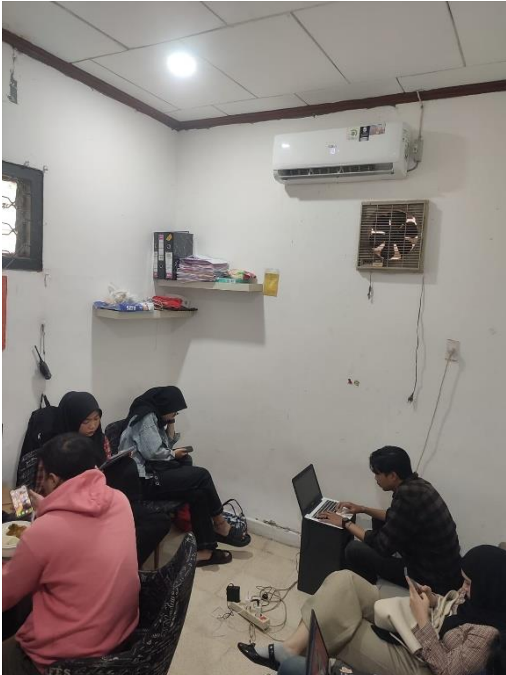
Gambar 3. Mencari Ide Content yang akan dibuat