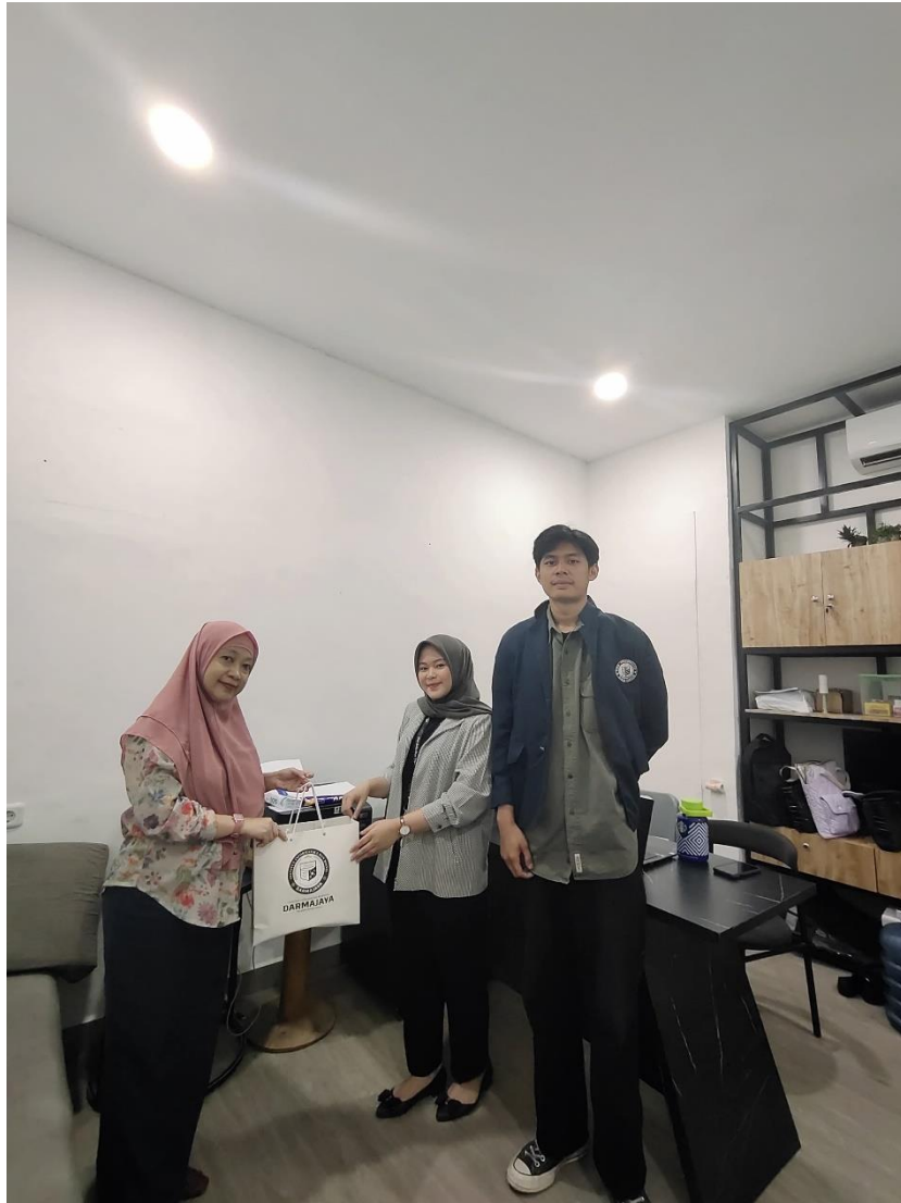
Gambar 9. Pengantaran Kerja Praktik Dan Serah Terima Souvenir