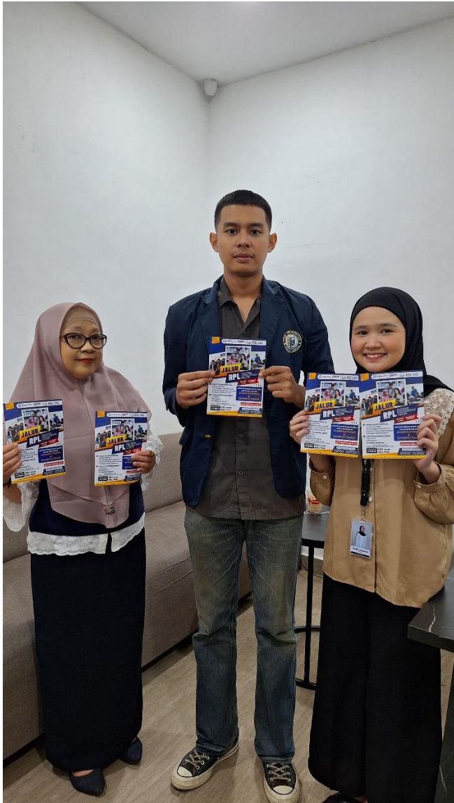
Gambar 10. Penjemputan KP Dan Promosi Program RPL