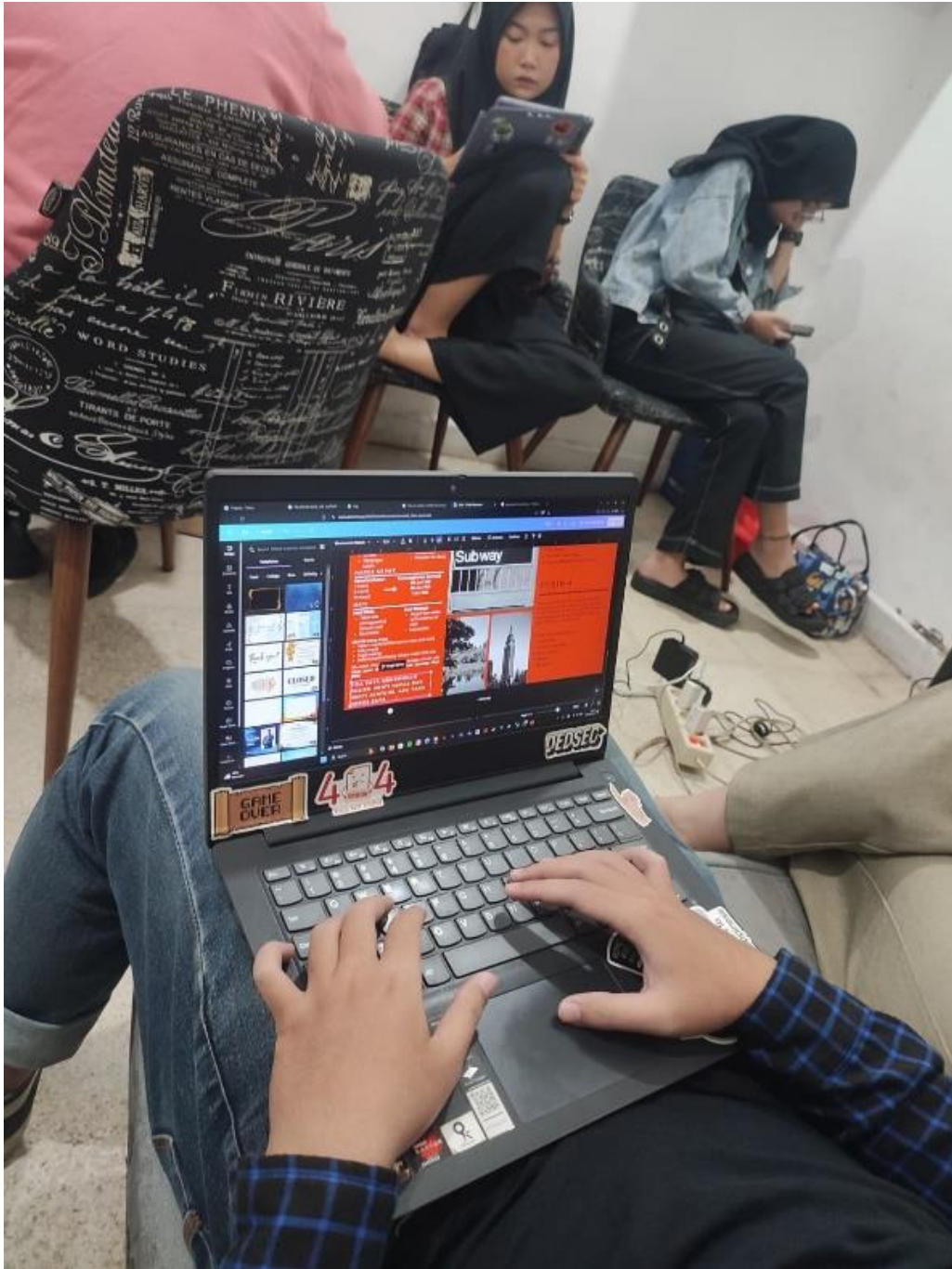
Gambar 4. Mencari desain yang menarik