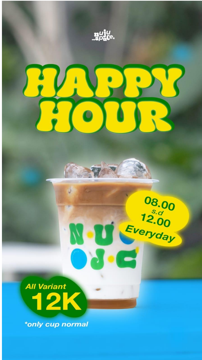
Gambar 6. Promo Payday Sale