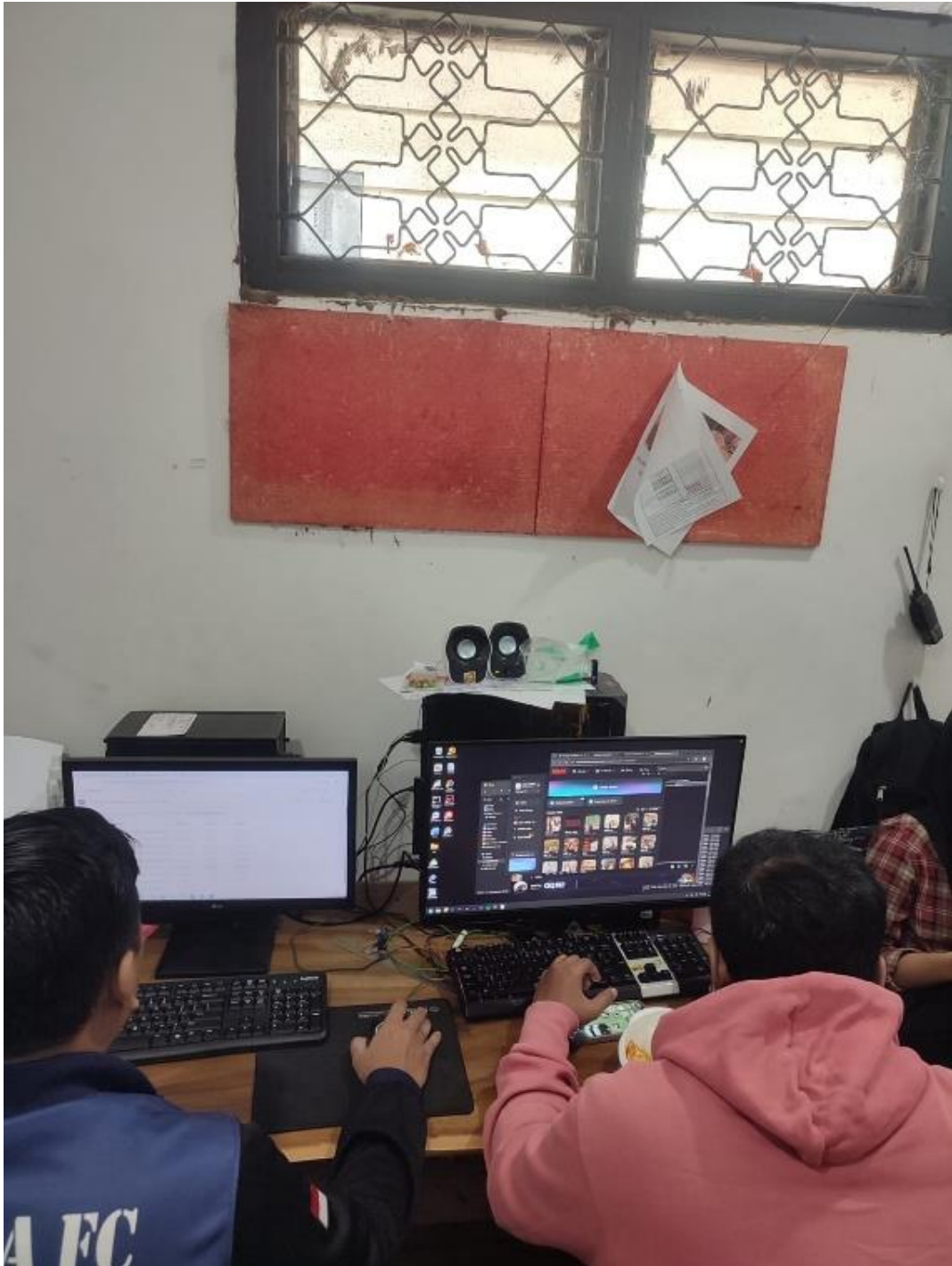
Gambar 2. Mencari Hasil Vidio yang akan Diedit