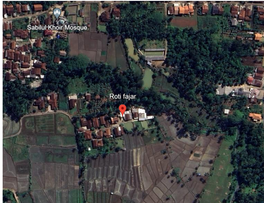
Gambar 1.2. Peta UMKM Roti Fajar