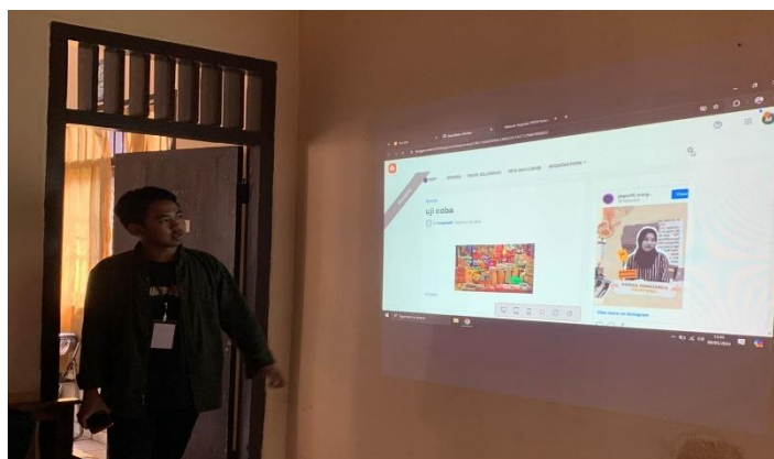
Gambar 2.3 Penjelasan mengenai Blogspot

Dalam hal ini penulis menyelenggarakan pelatihan dan pembuatan Blogspot untuk perangkat Kelurahan Margodadi. Pelatihan ini bertujuan untuk membekali staf dengan pengetahuan dan keterampilan dalam mengelola Blogspot sebagai media informasi publik. Materi yang disampaikan mencakup pengenalan Blogspot, cara pembuatan dan pengelolaan konten, serta tips untuk membuat tampilan yang menarik dan informatif. Dengan pelatihan ini, diharapkan perangkat kelurahan dapat memanfaatkan Blogspot secara efektif untuk berkomunikasi dengan masyarakat.