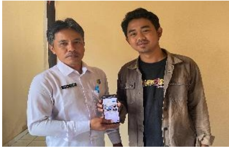
Gambar 2.4 Penyerahan Web Kelurahan Margodadi