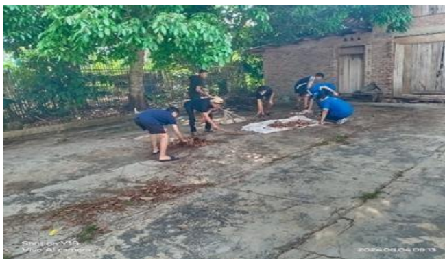
Gambar 2. 4 Gotong Royong