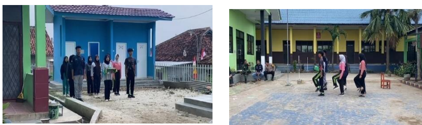
Gambar 2. 5 kegiatan latihan persiapan paskibra