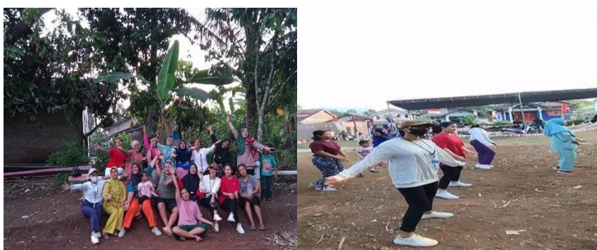
Gambar 2. 3 kegiatan senam bersama di dusun taman rejo

Senam sangat bermanfaat dalam mengembakan komponen fisik dan kemampuan gerak. Orang-orang yang terlibat senam akan berkembang daya tahan ototnya, kekuatannya, kelenturan, koordinasi serta keseimbangan.