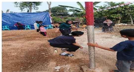
Gambar 2. 7 Lomba HUT-RI Bersama warga Dusun Taman Rejo

Lomba ini dilakukan supaya menjadi kesempatan untuk semua masyarakat dapat bersosialisasi dan melatih Kerjasama dengan karangtaruna maupun mahasiswa PKPM. Lomba ini dilaksanakan agar memeriahkan HUT-RI yang Ke-78.