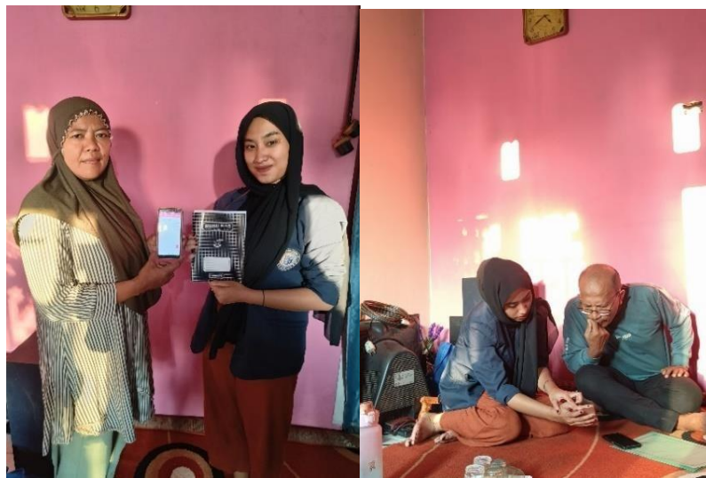
Gambar 2. 1 penerapan dan pembelajaran buku kas manual dan buku kas digital

Buku kas ini berisi pencatatan transaksi-transaksi yang berkaitan dengan pemasukan dan pengeluaran uang kas yang di miliki oleh pemilik usaha tersebut. Sebelum UMKM MELINJO ini belum memiliki pencatatan keuangan dalam bentuk apapun,jadi di sini saya akan memberikan pemahaman serta penerapan dan pembuatan catatan keuangan melalui buku kas manual dan buku kas secara digital agar UMKM ini memiliki informasi pencatatan keuangan agar dapat meningkatkan kinerja keuangan dalam usahanya.