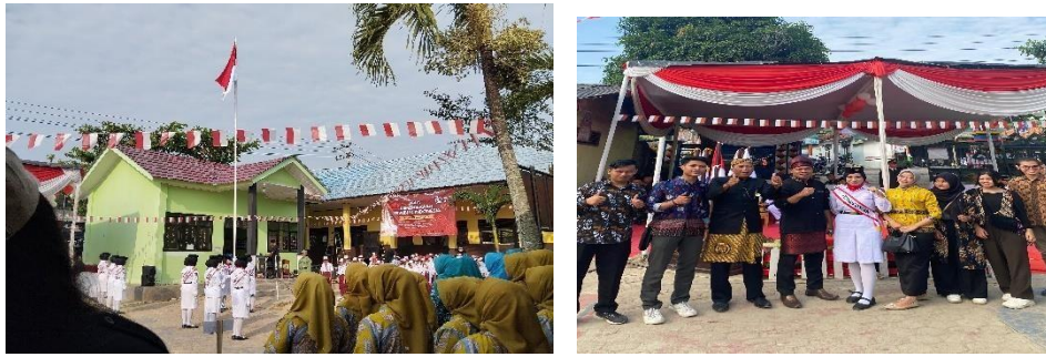
Gambar 2. 6 Upacara HUT-RI