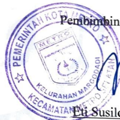
Eti Susilowati, SE