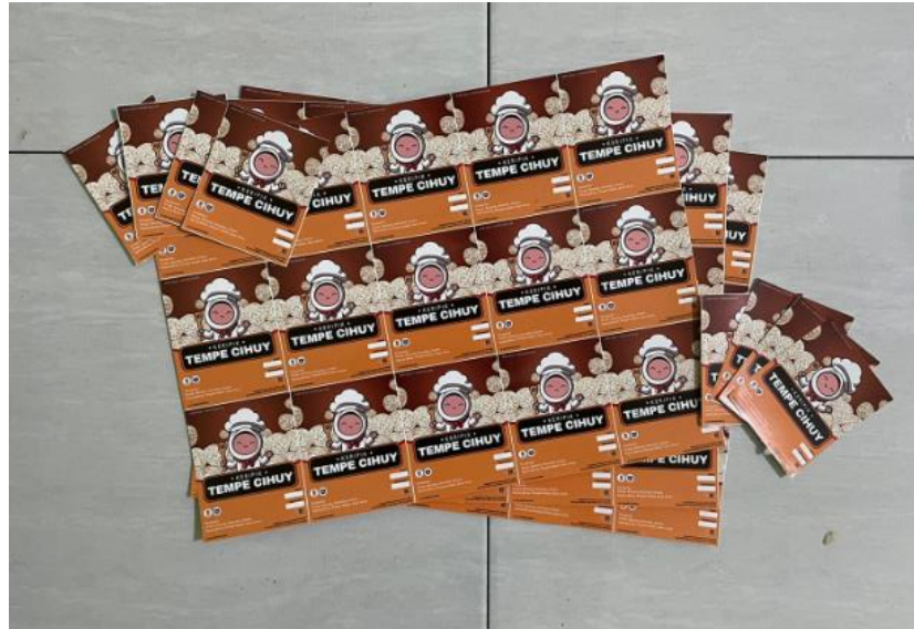
Gambar 2.5 Hasil Cetak Desain Kemasan