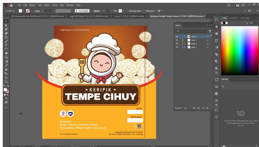
Gambar 2.4 Proses Digitalisasi Desain Kemasan Terpilih