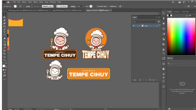
Gambar 2.3 Proses Digitalisasi Menggunakan Adobe Illustrator