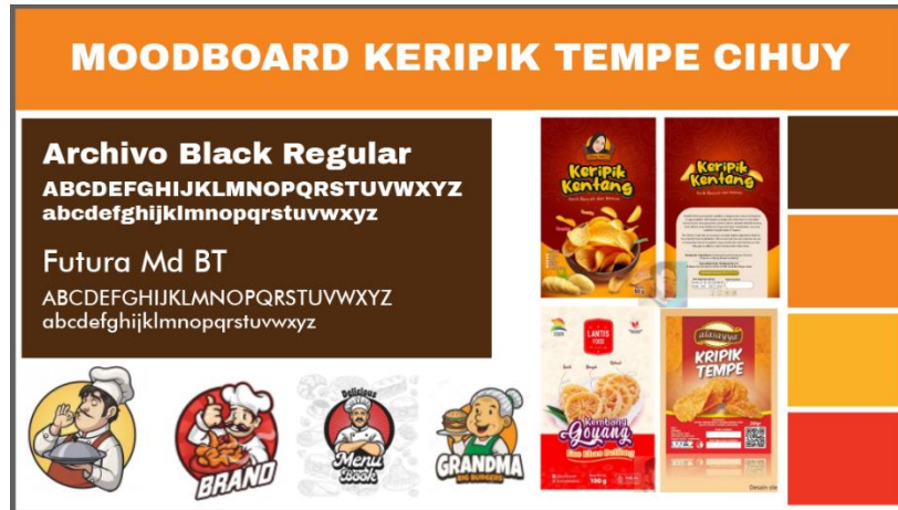
Gambar 2.1 Moodboard Untuk Acuan Pembuatan Desain