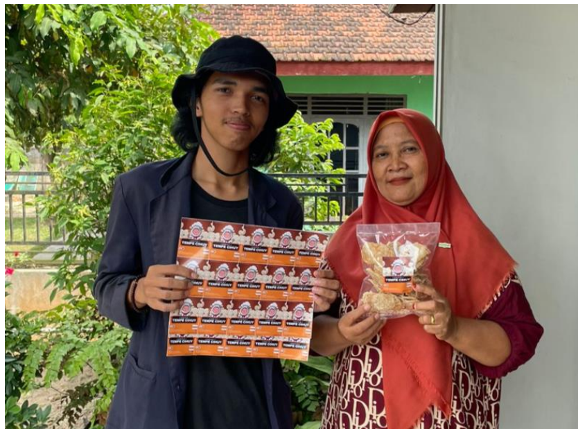
Gambar 2.6 Penyerahan Kemasan Yang Sudah Di Redesign