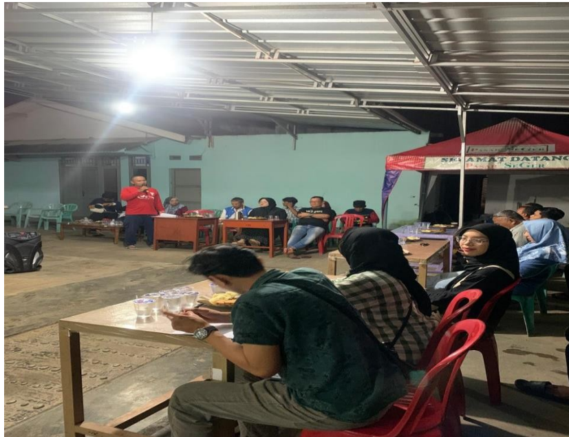
Gambar 2.4. Rapat panitia 17 Agustus bersama warga Yosorejo

Membahas dan menetapkan rencana detail kegiatan yang akan dilaksanakan dalam rangka memperingati Hari Kemerdekaan, seperti upacara bendera, lomba-lomba, dan acara hiburan.