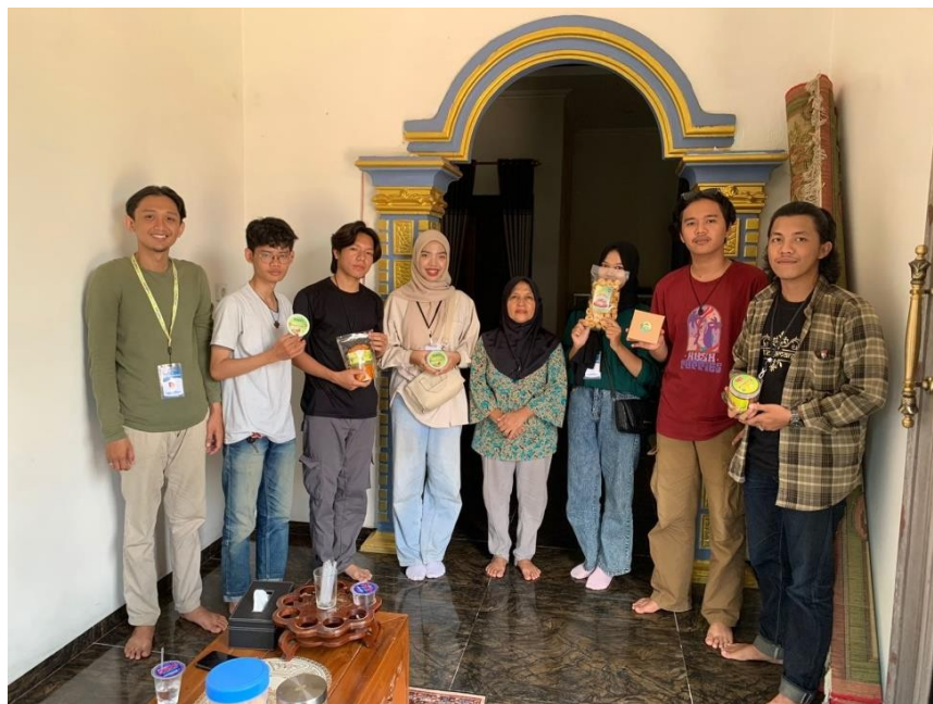
Gambar 2.3 survey UMKM

Survey ini dilakukan untuk mengidentifikasi strategi pemasaran yang dibutuhkan oleh pemilik UMKM. Selain itu, kajian ini juga merupakan tahap awal sebelum merancang dan menerapkan strategi pemasaran dan pengembangan inovasi produk UMKM terkait. Dengan melakukan penelitian, kita dapat mengetahui kebutuhan apa saja yang dibutuhkan UMKM dan melaksanakan program dan rencana pengembangan inovasi sesuai kebutuhan para pemangku kepentingan.