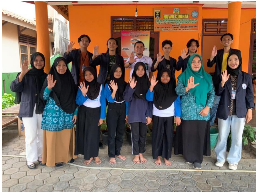
Gambar 2.7 Crew dan Aktor yang terlibat dalam pembuatan ILM

perubahan sikap dan perilaku masyarakat dalam menghentikan kekerasan dalam keluarga. Iklan ini bertujuan untuk memberikan edukasi tentang bentuk-bentuk kekerasan, cara mengenali tanda-tandanya, serta langkah-langkah untuk mendapatkan bantuan. Selain itu, iklan ini juga berupaya mendorong korban atau saksi kekerasan untuk melaporkan kejadian kepada pihak berwenang dan mengakses layanan dukungan yang tersedia. Dengan mempromosikan norma sosial yang positif dan mengajak partisipasi aktif masyarakat.