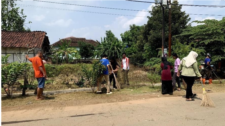
Gambar 2.8 Gotong-royong bersama masyarakat kelurahan Yosorejo