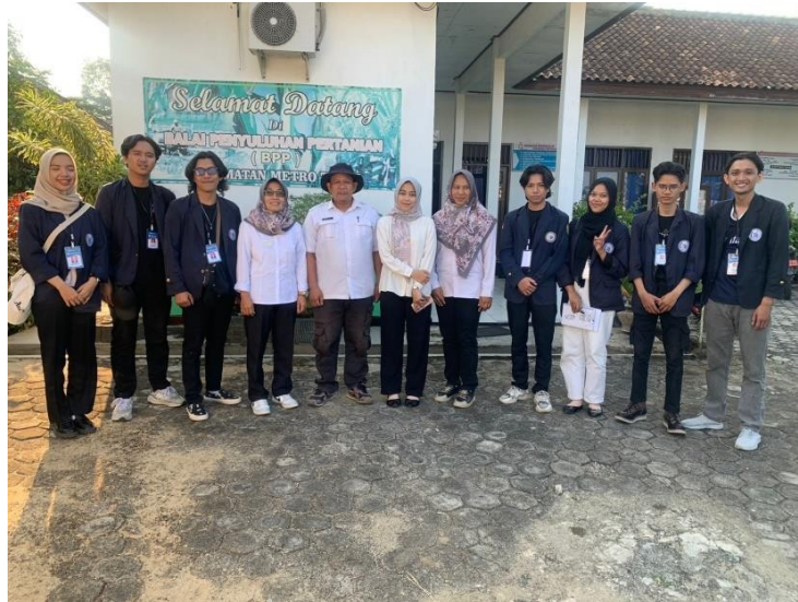
Gambar 2.2 silaturahmi ke BPP kec. Metro Timur