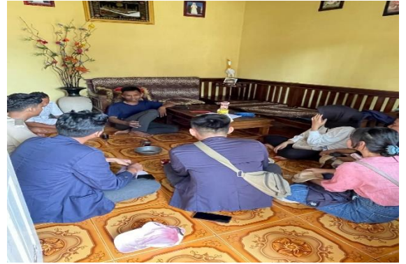
Lampiran 1.8 Kunjungan ke rumah Ketua Karang Taruna