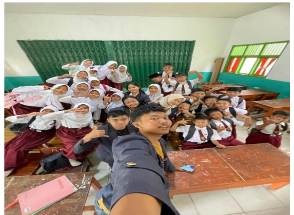
Lampiran 1.12 Sosialisasi Bahaya Merokok pada Siswa/i Kelas 5