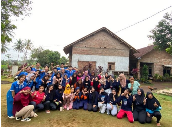
Lampiran 1.13 Senam bersama dengan Ibu-ibu di Dusun 3