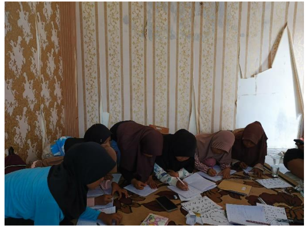
Lampiran 1.22 Mengadakan Rumah Belajar