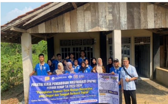
Lampiran 1.3 Pengantaran Mahasiswa