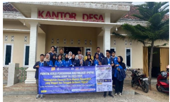
Lampiran 1.4 Penerimaan Mahasiswa PKPM di Balai Desa