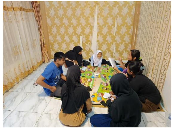
Lampiran 1.20 Mengadakan Rumah Belajar