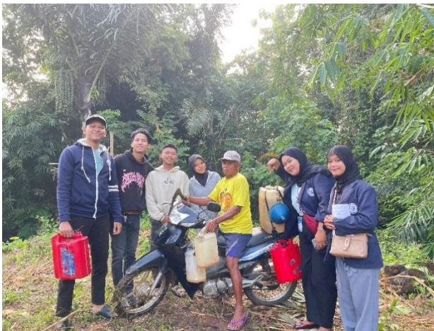
Lampiran 1.17 Melihat Proses Pengambilan Nira