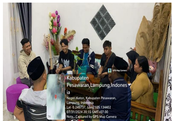
Lampiran 1.6 Kunjungan ke Rumah Kepala Dusun 5