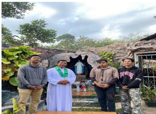
Lampiran 1.25 Kunjungan ke Gereja Katholik