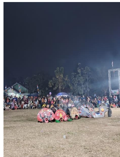
Lampiran 1.24 Pertunjukkan Seni Kuda Kepang