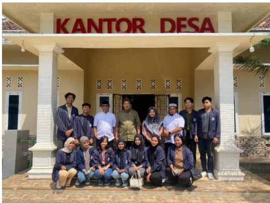
Lampiran 1.1 Survei lokasi PKPM