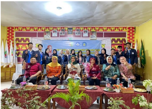
Lampiran 1.11 Menghadiri acara Bundu Paud