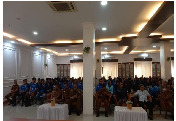
Lampiran 1.2 Pelepasan Mahasiswa PKPM di Kantor Bupati Pesawaran