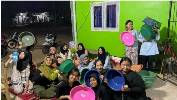
Lampiran 1.15 Melakukan pembungkusan hadiah