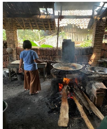
Lampiran 1.18 Kunjungan UMKM Pembuatan Tempe dan Tahu