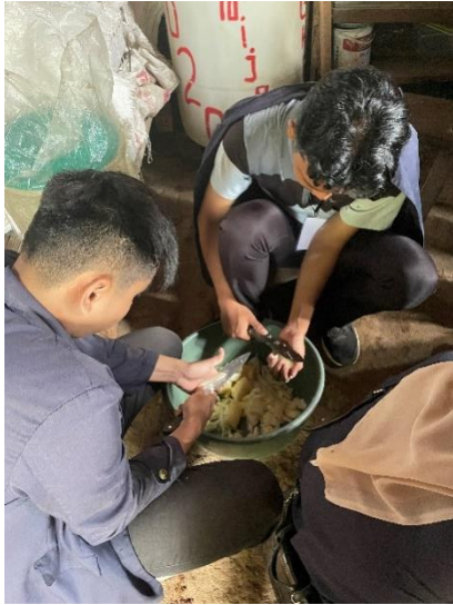
Lampiran 1.19 Pembuatan Kripik Mangleng