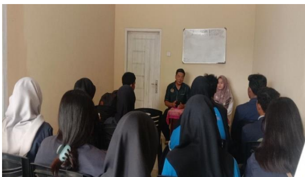
Lampiran 1.23 Rapat dengan Pak Kades dan Bu Sekdes di Balai Desa