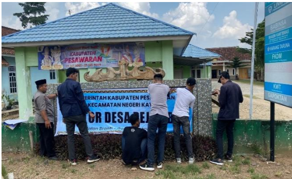
Lampiran 1.9 Pemasangan Banner di Balai Desa