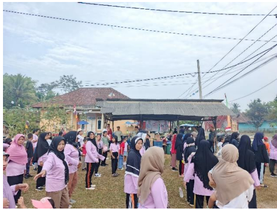
Lampiran 1.21 Senam pagi bersama warga Dusun III