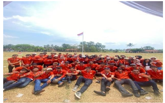
Lampiran 1.16 Perlombaan dengan Karang Taruna