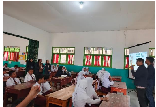
Lampiran 1.10 Sosialisasi Bahaya Bullying pada Siswa/I kelas 6