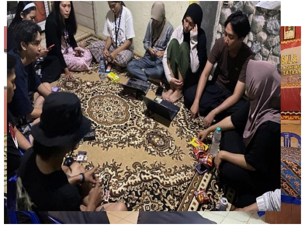
12. Kunjungan DPL