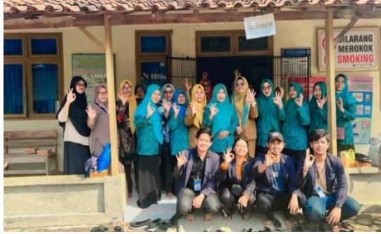
Lampiran 1.19 Mengikuti Kegiatan Ibu PKK