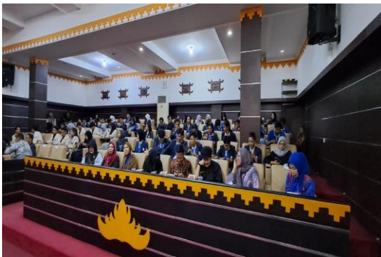
Lampiran 1.17 Penerimaan Mahasiswa PKPM di Kantor Walikota Kota Metro