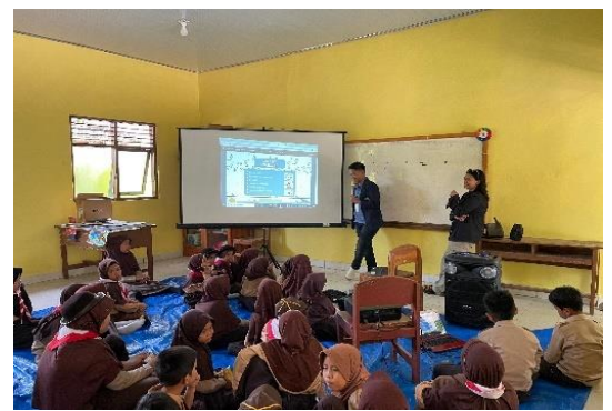
Lampiran 1.28 Penyuluhan pentingnya manajemen waktu yang baik dan bijak dalam menggunakan internet