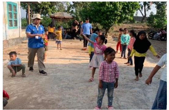
Lampiran 1.22 Kegiatan 17-an