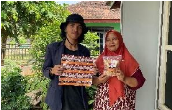
Lampiran 1.27 Rebranding Logo dan Kemasan Keripik Tempe Cihuy