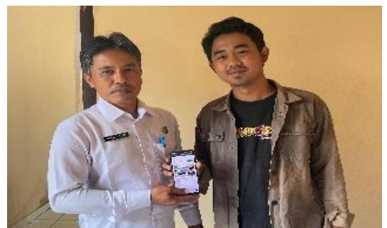
Lampiran 1.24 Penyerahan Web