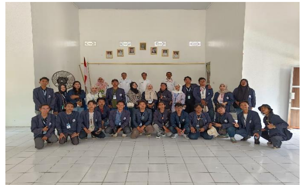
Lampiran 1.4 Penyambutan Mahasiswa/i PKM IIB Darmajaya se Metro