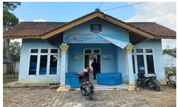
Lampiran 1.6 Kegiatan bersih- Kantor bersih Perpustakaan