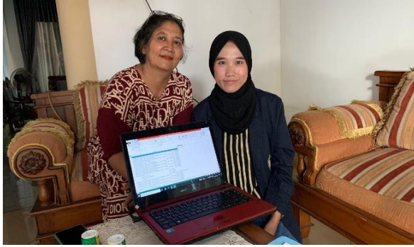
Lampiran 1.25 Penerapan pencatatan laporan keuangan sederhana dengan Cihuy menggunakan aplikasi Ms. Excel pada UMKM Keripik Tempe Cihuy