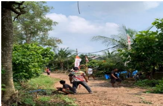
Lampiran 1.21 Kegiatan Gotong Royong