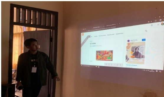
Lampiran 1.23 Presentasi dan pelatihan web Kelurahan Margodadi