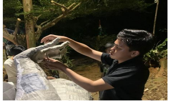
Lampiran 1.20 Membantu pembuatan ogoh-ogoh