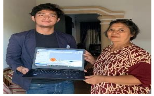
Lampiran 1.26 Pembuatan akun Sosial Media Keripik Tempe