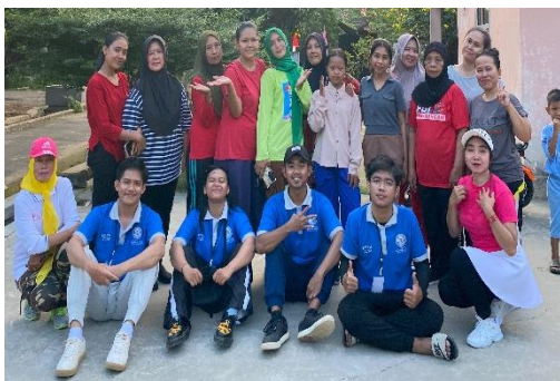
Lampiran 1.9 Mengikuti Kegiatan Senam Bersama Ibu-Ibu RW 05