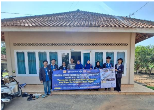
Lampiran 1.3 Pelepasan Mahasiswa/i PKM IIB Darmajaya Didampingi DPL