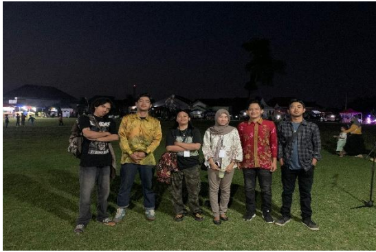
Lampiran 1.13 Panitia Karnval di Kelurahan Margodadi