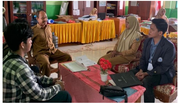
Lampiran 1.14 Kunjungan ke SD N SD N 6 Margodadi