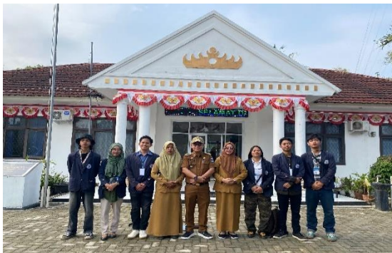
Lampiran 1.5 Kegiatan Upacara/ Apel di Kecamatan Metro Selatan