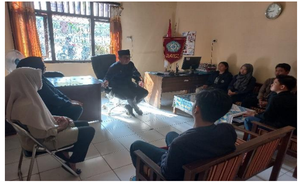
Lampiran 1.2 Kunjungan Ke Kantor Kelurahan Margodadi