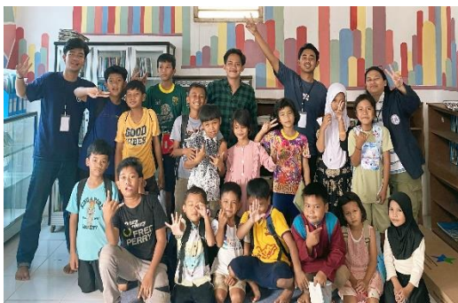
Lampiran 1.11 Kegiatan Les