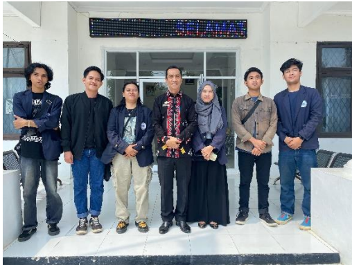
Lampiran 1.1 Kunjungan ke Kantor Kecamatan Metro Selatan