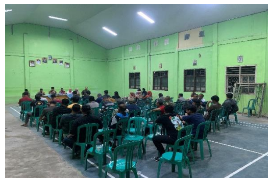
Lampiran 1.12 Menghadiri Pembentukan Panitia untuk Kegiatan Karnaval