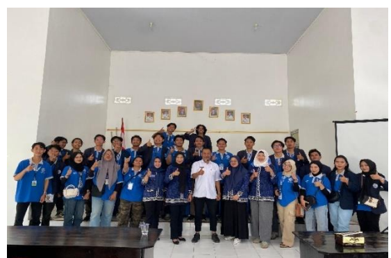
Lampiran 1.30 Penarikan PKPM di Kantor Kecamatan Metro Selatan