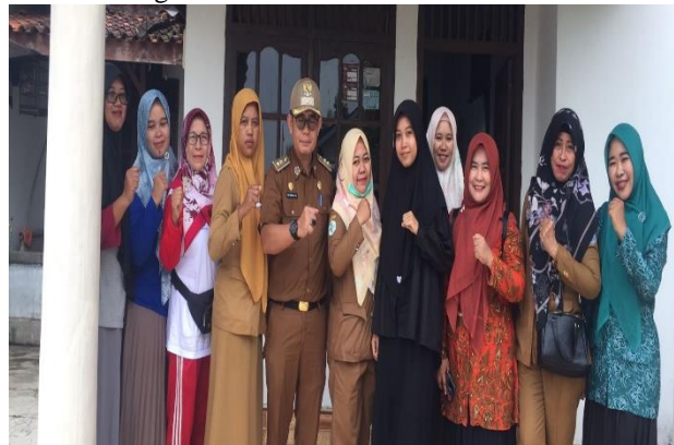
Lampiran 1.16 Kegiatan Homecare Bumil