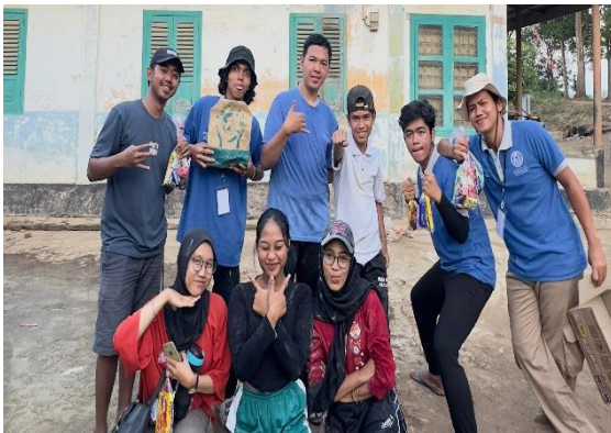
Lampiran 1.15 Panitia 17-an di RW 05