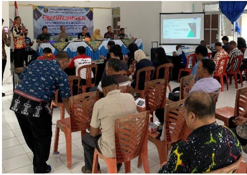
Lampiran 1.7 Menghadiri Kegiatan FGD (Forum Grup Diskusi)