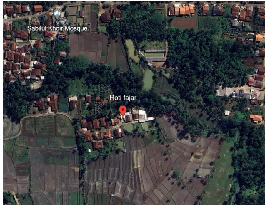
Gambar 1. 2 peta UMKM Roti Fajar