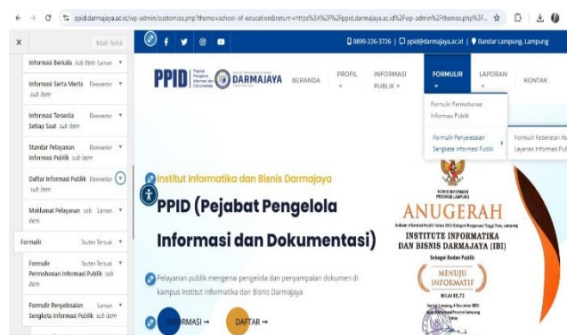
Gambar 1.6 Pembuatan UI Website PPID Darmajaya