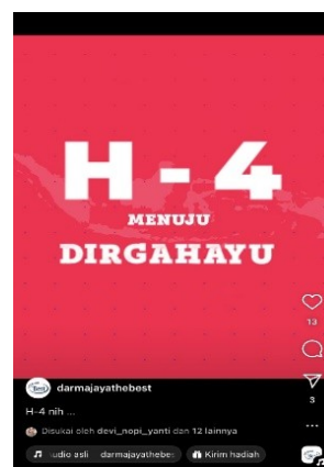
Gambar 1.4 Promosi Pendaftaran Mahasiswa