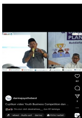
Gambar 1.5 Youth Business Camp