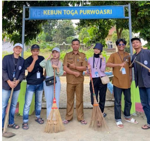
Gambar 2 12 Kerja Bakti dan Penanaman Toga

Kegiatan kerja bakti dan penanaman tanaman obat keluarga (TOGA) di kantor Kelurahan Purwoasri. Dalam kegiatan ini, kami membersihkan lingkungan sekitar kantor kelurahan dan menanam berbagai jenis tanaman obat yang memiliki manfaat kesehatan, seperti jahe, kunyit, dan serai. Kerja bakti ini tidak hanya bertujuan untuk memperindah dan menjaga kebersihan lingkungan kantor kelurahan, tetapi juga untuk mempromosikan pentingnya keberadaan tanaman obat keluarga sebagai sumber pengobatan alami yang mudah diakses oleh masyarakat. Melalui penanaman TOGA ini, diharapkan masyarakat lebih sadar akan manfaat tanaman herbal dan semakin termotivasi untuk memanfaatkan lahan pekarangan mereka dengan menanam tanaman yang bermanfaat bagi kesehatan.