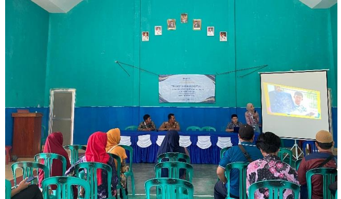
Gambar 2.3.1 Praktik Pelatihan Foto Produk

Meskipun hasil pelatihan ini sudah menunjukkan kemajuan yang positif, diperlukan langkah-langkah lanjutan untuk memastikan semua UMKM di Kelurahan Purwoasri Metro Utara dapat sepenuhnya mengadopsi dan memanfaatkan teknologi digital. Oleh karena itu, disarankan untuk terus melakukan pendampingan dan evaluasi secara berkala guna mendukung keberhasilan proses Foto Produk bagi pelaku UMKM.