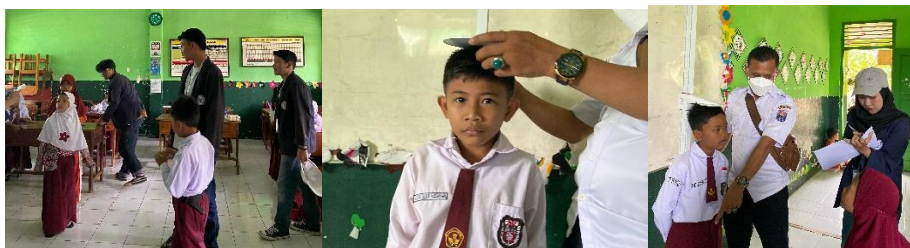
Gambar 2 13 Bekerja Sama dengan Posyandu Keliling

Kegiatan kolaboratif antara pihak sekolah, Puskesmas, dan mahasiswa dalam program Posyandu keliling yang diadakan di SD Negeri 5 Metro Utara. Program ini merupakan bentuk pelayanan kesehatan yang dibawa langsung ke lingkungan sekolah dengan tujuan untuk memantau kesehatan