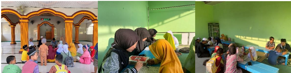
Gambar 2 14 Mengajar di Masjid Darussalam

Dokumentasi ini menampilkan kegiatan mengajar mengaji di Masjid Darussalam, Kelurahan Purwoasri, di mana kami 28ersama-sama dengan para guru ngaji mengajar ngaji Kegiatan ini dirancang untuk memperkuat fondasi keagamaan di kalangan generasi muda, dengan mengajarkan mereka cara membaca ayat-ayat suci Al-Qur'an dengan tartil dan tajwid yang benar. Selain itu, kami juga menekankan pemahaman makna dari setiap ayat yang dibaca, sehingga mereka dapat mengaplikasikan nilai-nilai Islam dalam kehidupan sehari-hari. Melalui pembelajaran ini, kami berharap dapat menumbuhkan kecintaan terhadap Al-Qur'an dan meningkatkan kesadaran akan pentingnya mengaji sebagai bagian dari perjalanan spiritual dan pembentukan karakter yang baik.