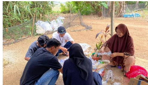
Gambar 2 11 Kegiatan Pilah Sampah

Foto dokumentasi ini menunjukkan kegiatan pilah sampah yang dilakukan oleh BSU di Kelurahan Purwoasri, Metro Utara. Dalam kegiatan ini, anggota BSU berkolaborasi dengan masyarakat setempat untuk memilah sampah berdasarkan jenisnya, seperti organik, anorganik, dan berbahaya. Tujuan dari kegiatan ini adalah untuk meningkatkan kesadaran dan keterampilan masyarakat dalam pengelolaan sampah yang lebih efektif, serta mendukung upaya kelestarian lingkungan di wilayah tersebut. Melalui kegiatan ini, kami berharap dapat mengedukasi masyarakat tentang pentingnya memilah sampah untuk mengurangi dampak negatif terhadap lingkungan dan mendorong praktek-praktek ramah lingkungan di komunitas.