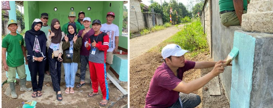
Gambar 2 15 Gotong Royong Mengecat Gardu

Dalam rangka menyambut HUT RI Ke-79 Bersama dengan Linmas, Ketua RT 08, dan seluruh warga, kami dengan penuh semangat melaksanakan gotong royong untuk mengecat Gardu RW 02. Kegiatan ini tidak hanya bertujuan untuk meningkatkan keindahan lingkungan, tetapi juga sebagai wujud nyata dari semangat kebersamaan dan kerja sama yang kuat di antara masyarakat. Melalui kegiatan ini, diharapkan tali persaudaraan dan rasa kepedulian terhadap lingkungan sekitar dapat semakin erat terjalin, sehingga menciptakan suasana yang lebih harmonis dan nyaman bagi seluruh warga.