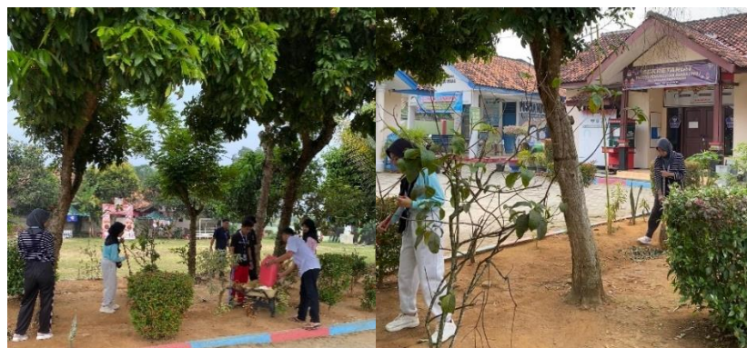
Gambar 2 16 Kegiatan Jum'at Bersih

Kegiatan Jumat Bersih yang berfokus pada upaya membersihkan lapangan serta lingkungan sekitar Kantor Kelurahan Purwoasri. Kegiatan ini