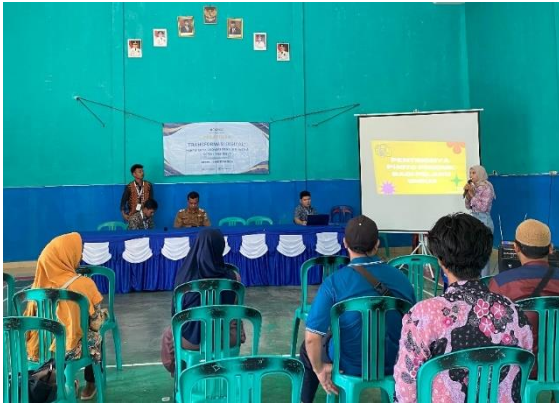
Gambar 2.3.1 Pelatihan Foto Produk Bagi Pelaku UMKM

Simulasi Foto Produk: Peserta akan diajak langsung mempraktikkan teknik-teknik yang diajarkan, seperti memotret produk, mengatur pencahayaan, dan melakukan editing.