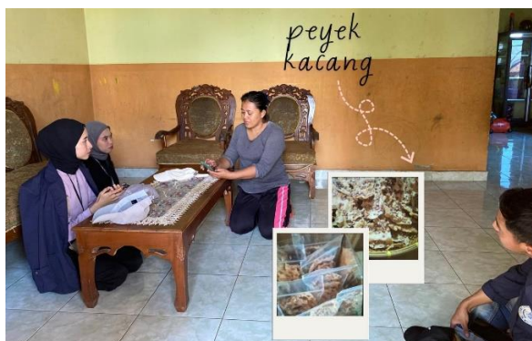
Gambar 2 1 Kunjungan Ke UMKM Kacang