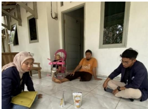
Gambar 2 4 Kunjungan Ke UMKM Dwi Putri