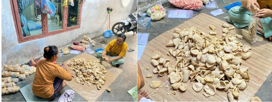
Gambar 2 8 Kunjungan Ke UMKM Kerupuk Jangek

UMKM Kerupuk Jangek di Purwoasri 24 fokus pada produksi kerupuk jangek, camilan tradisional yang terbuat dari kulit sapi yang diolah dengan bumbu khas. Produk ini dikenal karena kerenyahannya dan cita rasa gurih yang khas, menjadikannya salah satu camilan yang digemari di berbagai acara. Meski masih berskala mikro, UMKM ini memiliki potensi untuk berkembang lebih besar dengan inovasi pada kemasan dan strategi pemasaran digital yang lebih efektif.