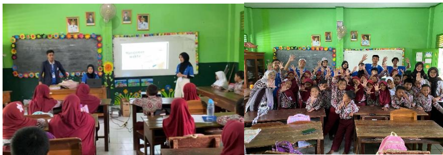
Gambar 2 10 Sosialisasi di SD N 5 Metro Utara

Dokumentasi foto ini menangkap momen saat kami mengajar di SD Negeri 5 Metro Utara dengan tema 'Manajemen Waktu'. Dalam sesi ini, kami memperkenalkan konsep manajemen waktu kepada siswa dengan tujuan untuk membantu mereka memahami pentingnya mengatur waktu secara efektif dalam kegiatan sehari-hari mereka. Melalui berbagai aktivitas dan diskusi, kami memberikan mereka alat dan strategi praktis yang dapat mereka terapkan untuk meningkatkan produktivitas dan efisiensi dalam belajar dan beraktivitas. Kami berharap, pembelajaran ini dapat memotivasi siswa untuk lebih terampil dalam mengelola waktu mereka, baik di sekolah maupun di rumah.