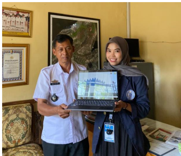
Gambar 2 9 Penyerahan Video Profile