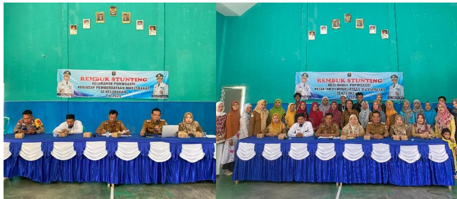
Gambar 2 17 Acara Rembuk Stunting

Menghadiri acara Rembuk Stunting yang diselenggarakan di aula Kelurahan Purwoasri, sebuah pertemuan penting yang melibatkan berbagai pihak, termasuk pemerintah setempat, tenaga kesehatan, tokoh masyarakat, dan perwakilan warga. Acara ini bertujuan untuk membahas langkah-langkah strategis dalam menurunkan angka stunting di wilayah Purwoasri, serta menyusun rencana aksi yang melibatkan semua pemangku kepentingan. Diskusi yang berlangsung dalam suasana yang penuh keterbukaan dan kolaborasi ini diharapkan dapat menghasilkan solusi yang konkret dan berkelanjutan untuk mengatasi masalah gizi buruk pada anak-anak, dengan fokus pada peningkatan kesadaran, pemberdayaan masyarakat, dan penguatan program kesehatan di tingkat lokal.