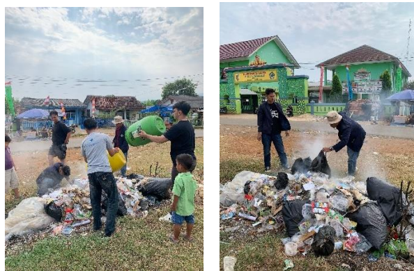
Gambar 2 12 Gotong Royong di Lapangan Tri Tura

f. Gotong royong membersihkan Lapangan Tri Tura Kecamatan Kedondong.