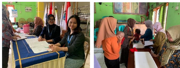
Gambar 2 9 Kegiatan Posyandu Desa Kedondong