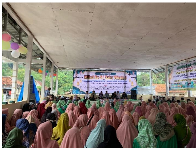
Gambar 2 13 Pengajian Bersama Ibu-ibu Desa Kedondong

g. Pengajian bersama ibu-ibu Dusun Cimahi.