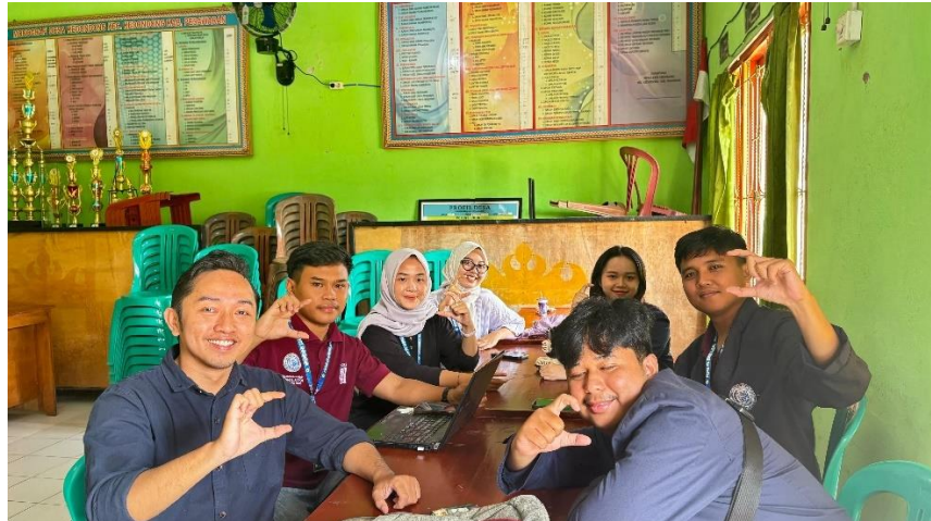
Gambar 2 3 Proses Pengecekan Web Desa

transparan, seperti laporan keuangan, kegiatan desa, serta pengumuman penting lainnya. Selain itu, website desa bisa digunakan untuk mempromosikan potensi desa, seperti pariwisata, produk unggulan, budaya, dan lain-lain, sehingga menarik perhatian wisatawan atau investor.