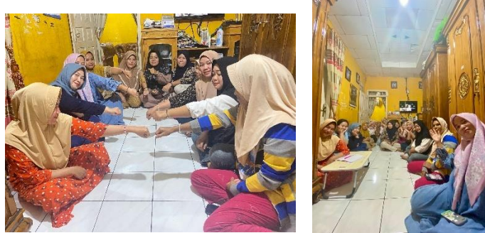
Gambar 2 14 Pelatihan Kewirausahaan bersama Ibu-ibu PKK