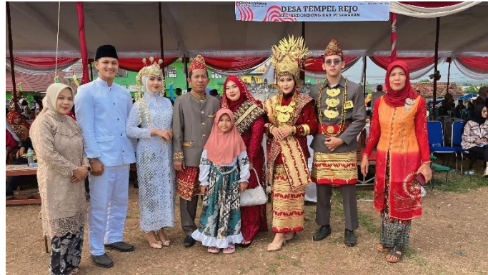
Gambar 2 8 Menjadi Pengantin pada Acara Festival Budaya