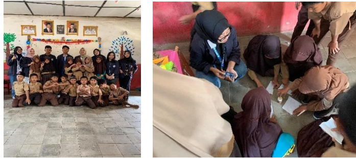
Gambar 2 11 Mengajar di SDN 9 Kedondong

e. Mengajar dan menghias kelas di SD Negeri 9 Kedondong.