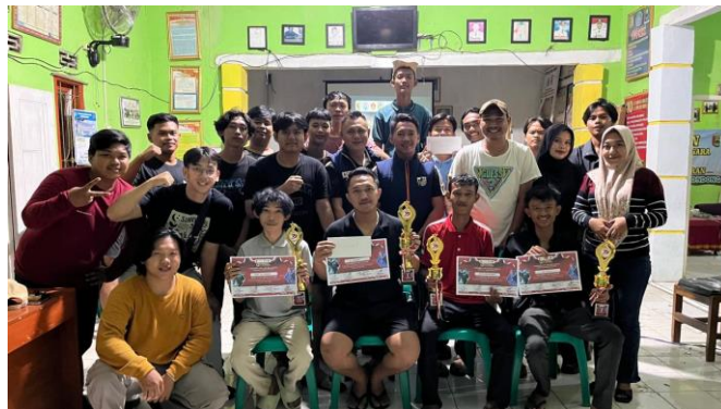
Gambar 2 15 Mengadakan Lomba Mobile Legend antar Kecamatan