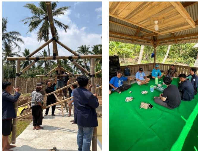
Gambar 2 6 Kunjungan ke BUMDES Desa Kedondong

Bumdes di Desa Kedondong terbilang masih baru dikarenakan mereka baru saja membuka usaha pemancingan ikan lele dan ikan gurame. Kami diberikan kesempatan untuk langsung terjun membantu masyarakat membangun kolam pemancingan.