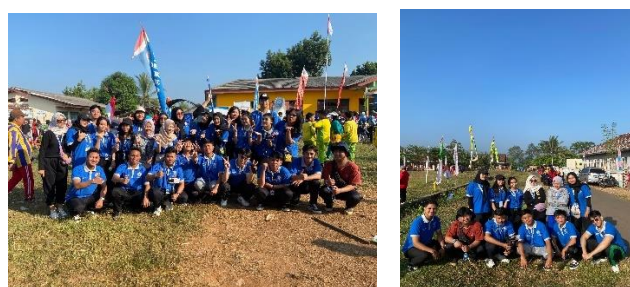
Gambar 2 10 Jalan Sehat se-Kecamatan Kedondong