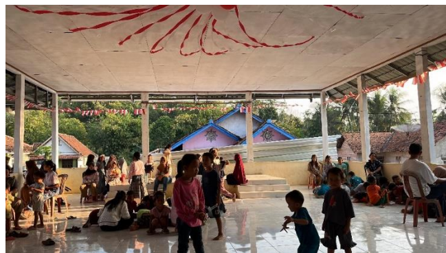
Gambar 2 7 Persiapan Acara HUT RI ke-79