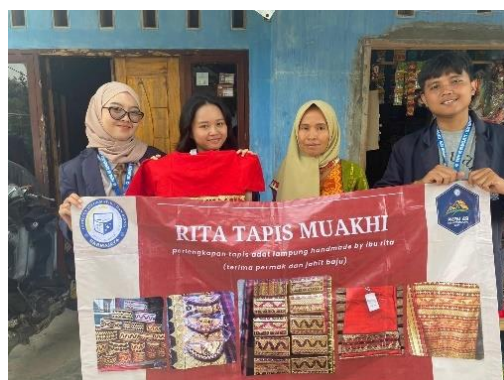
Gambar 2 5 Pembuatan Banner UMKM Rita Tapis Muakhi

Banner berfungsi sebagai alat promosi yang efektif untuk menarik perhatian calon pelanggan. Dengan desain yang menarik dan informasi yang jelas, banner dapat meningkatkan kesadaran publik terhadap keberadaan UMKM. Selain itu, banner dapat digunakan untuk mempromosikan produk atau jasa tertentu, termasuk penawaran khusus, diskon, atau event. Ini membantu menarik minat konsumen untuk membeli atau menggunakan layanan yang ditawarkan.