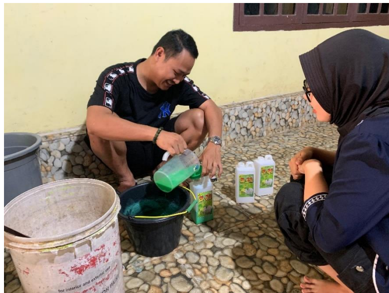
Gambar 2 1 Melihat Langsung Pembuatan S-21

Pada kegiatan ini saya bersama teman-teman memberikan pelatihan serta edukasi mengenai pentingnya laporan keuangan bagi pelaku UMKM. Laporan keuangan tidak hanya bertujuan untuk kepentingan pencatatan saja, tetapi laporan keuangan dapat digunakan penjual sebagai acuan dan evaluasi kinerja penjualan setiap harinya.