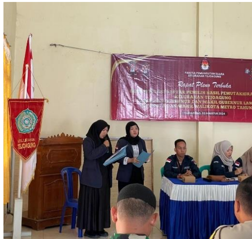
Gambar 11 Rapat Pleno Terbuka Yang di Adakan oleh KPU