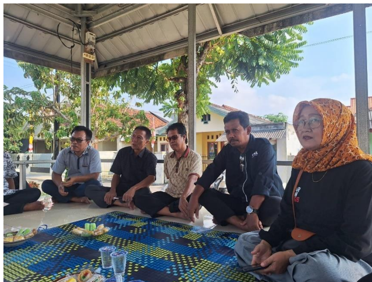
Gambar 6 Rapat Kepanitian Persiapan Jalan Sehat Yang