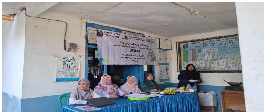
Gambar 3 Pelatihan Menu B2SA