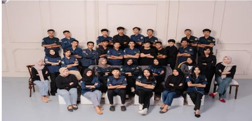
Gambar 13 Foto Bersama Karang Taruna Dan Kepanitiaan HUT RI Ke-17 RW 001