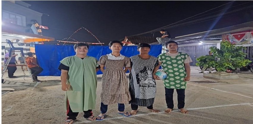
Gambar 1 Memeriahkan HUT RI KE-79 Tahun di RW 003