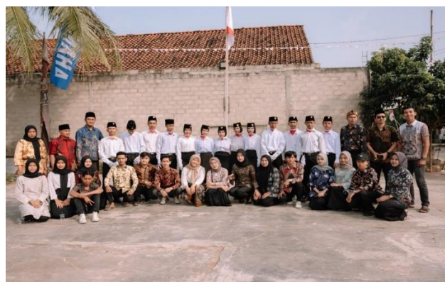
Gambar 9 Upacara Memperingati HUT R1 79 Tahun Bersama Warga RW 001