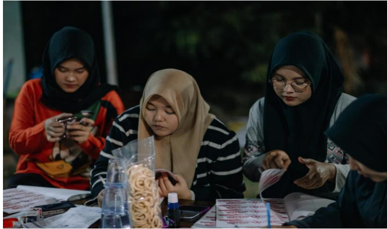
Gambar 4 Mengecap Kupon Jalan Sehat di RW 001