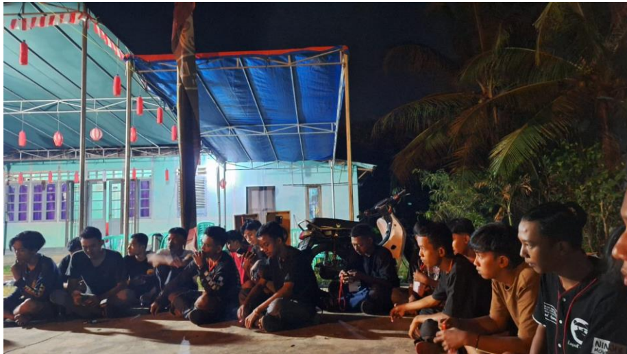
Gambar 2 Mengikuti Rapat Koordinasi Persiapan 17 Agustus di RW 001