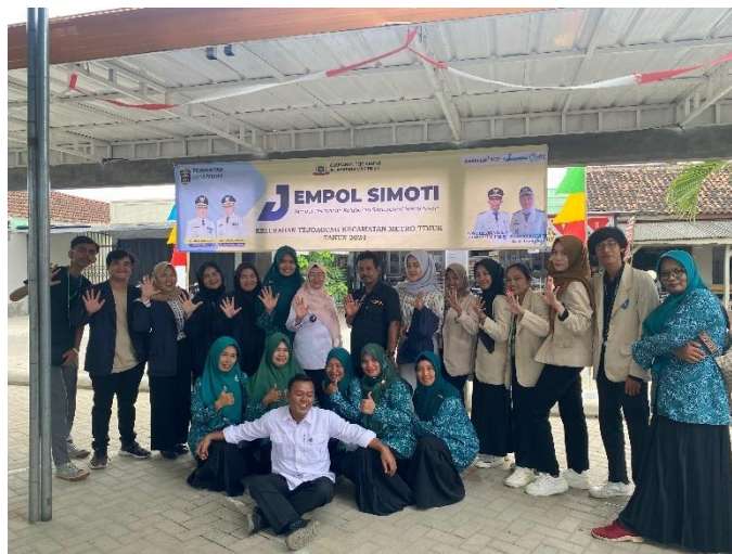
Gambar 12 Jempol Simoti