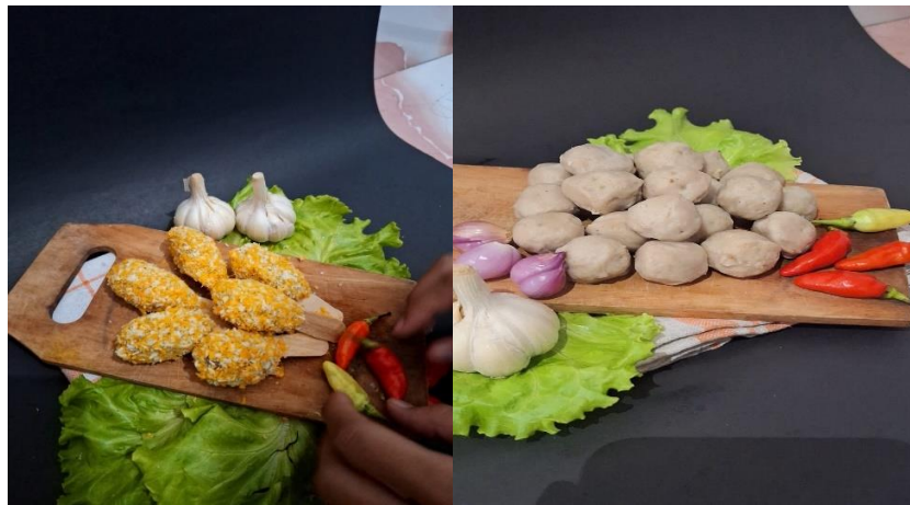
Gambar 5 Foto Produk Untuk UMKM Bakso Kembar