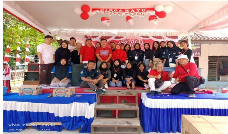
Gambar 7 Foto Bersama Kepanitain Jalan Sehat Kelurahan

Diselenggarakan Oleh Kelurahan Tejo Agung