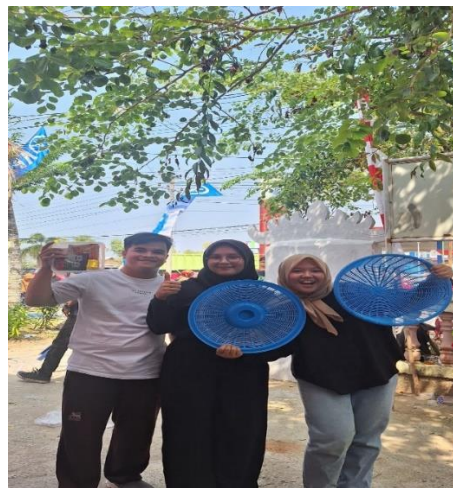
Gambar 8 Mendapatkan Dooprize Jalan Sehat Kelurahan