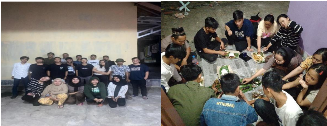
Gambar 14 Makan Bersama Karang Taruna Tejo Agung Sebelum Perpisahan PKPM