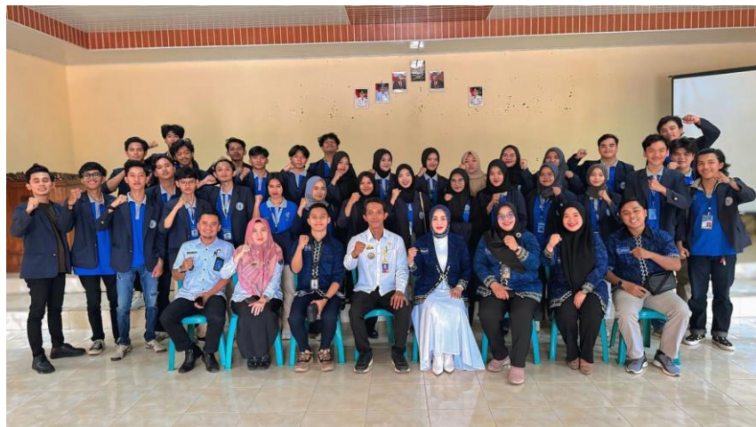
Gambar 15 Foto bersama penjemputan PKPM bersama Bapak Camat