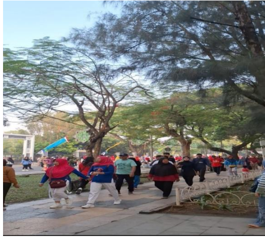
Gambar 10 Car Free Day “Sehat Gembira Silaturahmi”