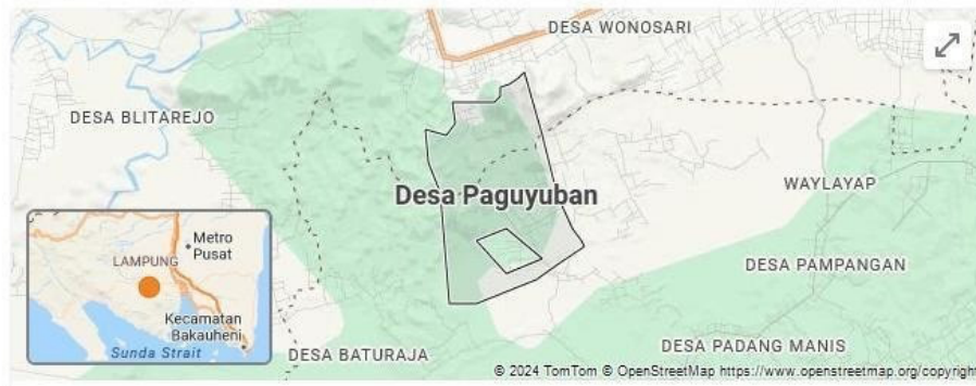
Gambar 1.1.1 Peta Desa paguyuban

Desa Paguyuban merupakan salah satu Desa dengan status Mandiri di Provinsi Lampung yang sebelumnya Desa berkembang berdasarkan Peraturan Menteri Desa dan Pembangunan Daerah Tertinggal tentang Indeks Desa Membangun. Untuk mencapai kemandirian Desa,