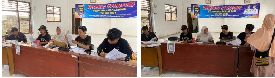
Gambar 2.4 Panitia Pembagian Beras Bulog di Kelurahan Banjarsari