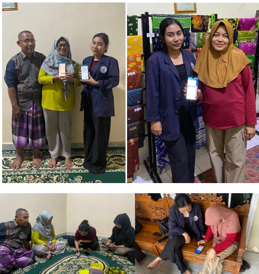
Gambar 2.2 Penyerahan Program Kerja ke Yumna Food Industry dan Canting Batik Metro