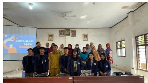
Gambar 2.3 Presentasi dan Foto Bersama Pelaku UMKM untuk melakukan sosialisasi