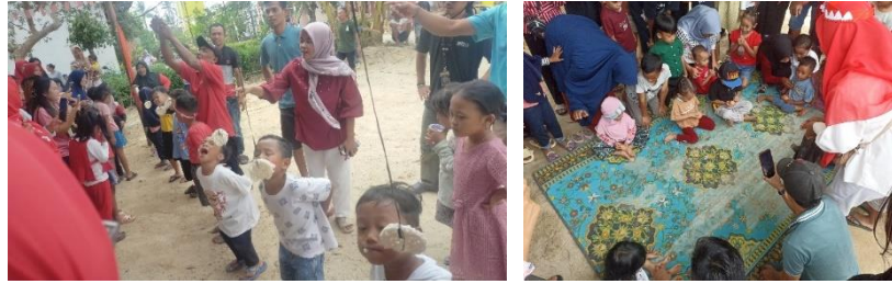
Gambar 2.5 Lomba di RW 08 dan 09