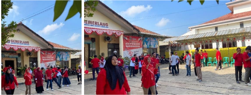
Gambar 2.6 Lomba di Kecamatan Metro Utara