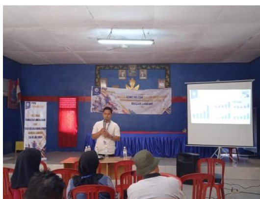
Gambar 4.4 Dokumentasi Kegiatan Pelatihan Tata Kelola Manajemen

Sebagian besar masyarakat belum mengerti serta memahami bagaimana pentingnya Tata Kelola Manajemen saat ini, Namun masyarakat menyambut baik dan antusias dengan pelatihan yang diberikan. Masyarakat mulai memahami bagaimana pentingnya Tata Kelola Manajemen.