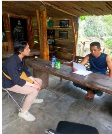
Gambar 4.3 Dokumentasi penyebaran undangan ke pemilik usaha

Penulis dan Tim Ormawa melakukan Penyebaran undangan dan pemberitahuan terkait pelaksanaan pelatihan Tata Kelola Manajemen yang akan dilaksanakan. Dalam kesempatan ini penulis dan Tim Ormawa melakukan penyebaran undangan ke tempat pemilik usaha wisata maupun usaha bisnis lainnya Guna berharap agar masyarakat pemilik usaha datang ke pelatihan Tata Kelola Manajemen tersebut.