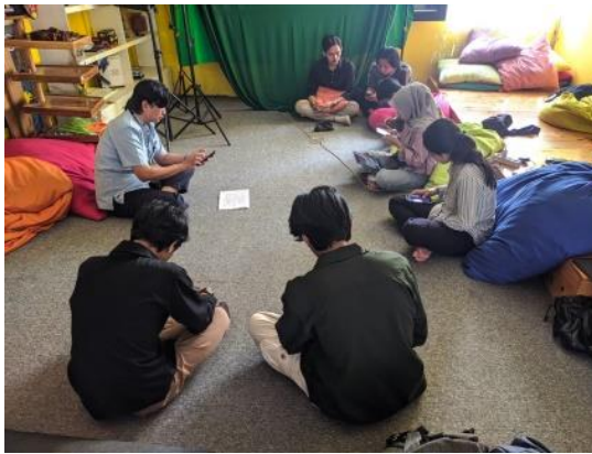
Gambar 4.1 Dokumentasi rapat persiapan pelatihan Tim Ormawa

Setelah dilakukan tahap persiapan penulis bersama Tim Ormawa memulai tahap selanjutnya dengan mengundang masyarakat setempat yaitu daerah yang menjadi tempat penelitian. Penulis bersama Tim Ormawa juga mengundang perangkat daerah setempat mulai dari pihak kecamatan, kelurahan, sampai dengan karang taruna