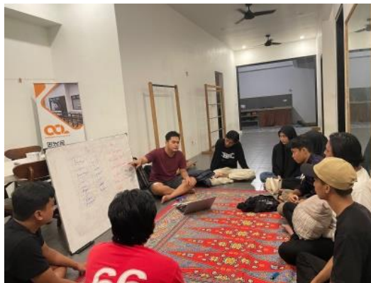
Gambar 4.2 Dokumentasi diskusi Tim Ormawa dengan masyarakat setempat

Masyarakat memiliki antusias yang baik dalam menyambut adanya program pelatihan yang akan diberikan. Masyarakat menyambut baik pengetahuan pengelolaan, Sehingga masyarakat mulai memahami bagaimana pentingnya Tata Kelola Manajemen. Sebelum melakukan program pelatihan Tata Kelola Manajemen si Penulis dan Tim Ormawa dibantu dosen pembimbing yang turut ikut berdiskusi bersama Tokoh masyarakat dan Pemilik usaha, Wisata, dan pelaku usaha lainnya agar tau keluhan yang dialami oleh masyarakat untuk pengelolaan usaha masing-masing