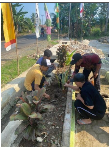
Gambar 16 Jumat Bersih