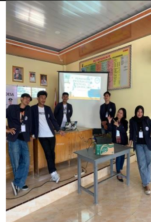
Gambar 6 Pemaparan Program kerja