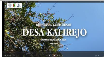
Gambar 5 Video Profil Desa Kalirejo