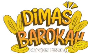
Gambar 2 Logo UMKM Keripik Pisang