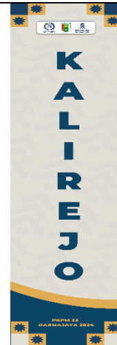
Gambar 3 Umbul Umbul