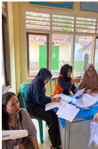
Gambar 11 Membantu Ibu Ibu Posyandu