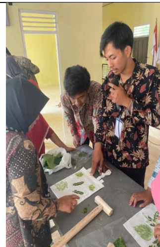
Gambar 9 Pelatihan Ecoprint