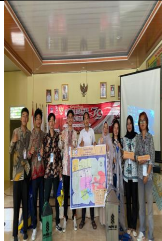
Gambar 14 Penyerahan Candramata