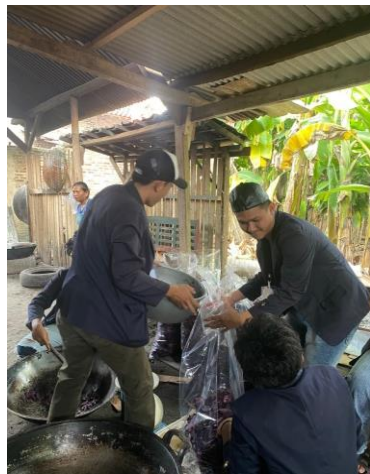
Gambar 13 Membantu Produksi UMKM