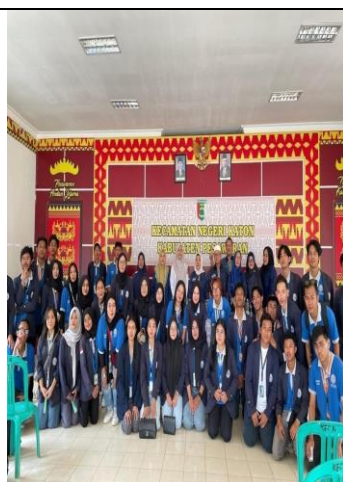
Gambar 18 Pelepasan PKPM 2024