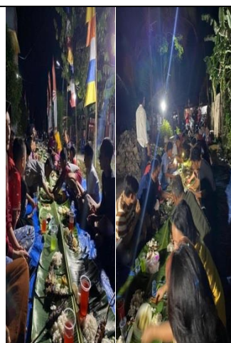
Gambar 17 Bakar2 Perpisahan bersama Aparatur & warga Desa