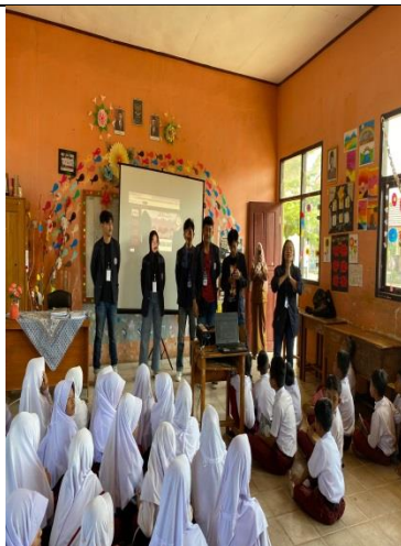
Gambar 7 Sosialisasi SD 8 Negeri Katon