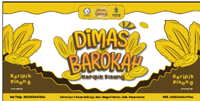
Gambar 1 Banner UMKM Keripik Pisang Dimas