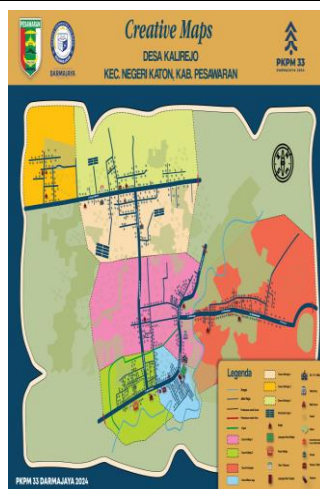
Gambar 8 Denah Desa Kalirejo