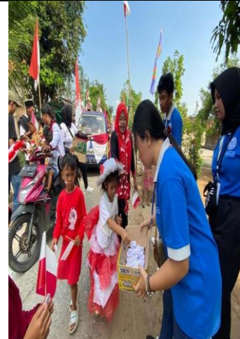
Gambar 15 Karnaval Desa Kalirejo