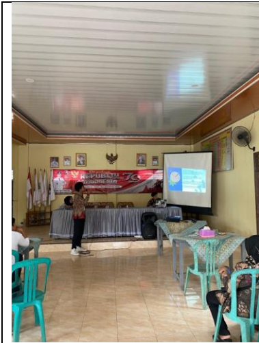
Gambar 10 Sosialisasi Branding & canva