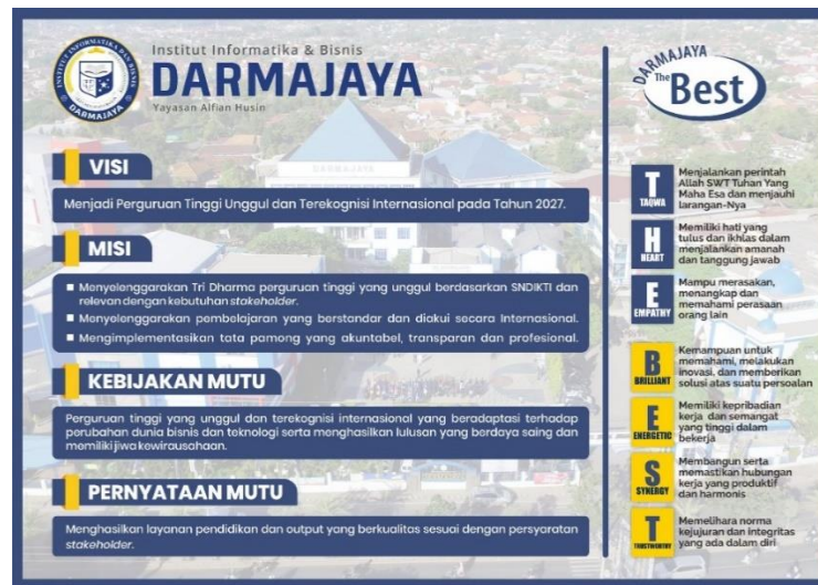
Gambar 2.1 Visi Misi Perusahaan