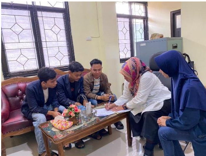
Gambar 2.1 Koordinasi dengan perangkat kelurahan

Berkoordinasi terkait program kerja dan kegiatan yang dilakukan selama satu bulan PKPM di Kelurahan Imopuro, ditunjukkan pada gambar berikut ini :