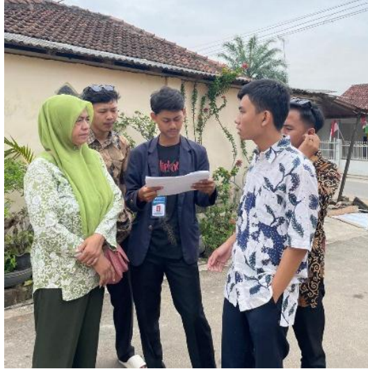
Gambar 2.2 Survei UMKM

Kegiatan yang dilakukan untuk mengetahui potensi apa saja yang ada pada UMKM di Kelurahan Imopuro, ditunjukkan pada gambar berikut ini :