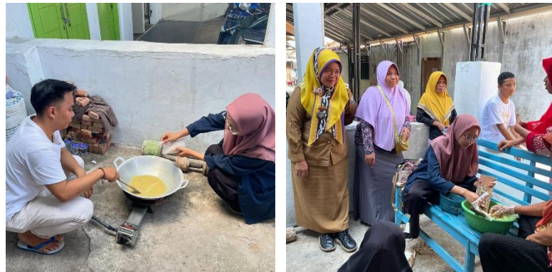
Gambar 2.4 Proses pembuatan Jamu Jahe Bubuk

Proses produksi adalah serangkaian kegiatan yang mengubah input (bahan baku, tenaga kerja, mesin, dan modal) menjadi output (produk atau jasa) yang memiliki nilai tambah. Dalam kegiatan ini proses produksi masih sangat tradisional dengan menggunakan alat seadanya mulai dari proses pembersihan bahan baku, pemotongan, penjemuran bahan-bahan dan merebus serta pengemasan produk.