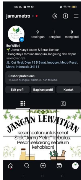
Gambar 2.5 Sosial media Instagram UMKM