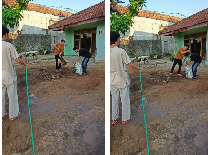
Gambar 2.7 Mengikuti kegiatan gotong royong

Mengikuti kegiatan gotong royong bersama masyarakat Kelurahan Imopuro di RT setempat