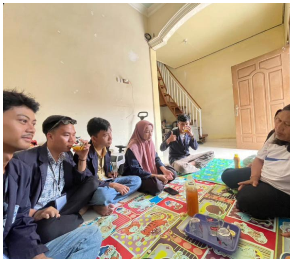
Gambar 2.3 Silaturahmi dengan pemilik UMKM Jamu Metro

Melakukan survei lokasi dan silaturahmi dengan pemilik UMKM di Kelurahan Imopuro agar kegiatan PKPM ini dapat berjalan dengan baik, ditunjukkan pada gambar berikut ini :