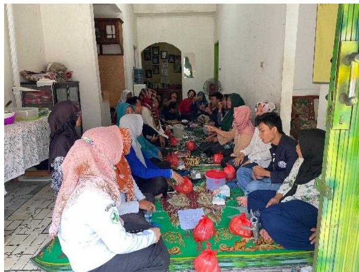
Gambar 2.8 Mengikuti kegiatan posyandu

Mengikuti kegiatan rutin posyandu, penyuluhan kesehatan, mencegah stunting pada anak-anak