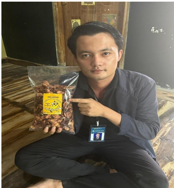
Gambar 2.10 Setelah Tepung Pis 3 a 0 ng Dikemas