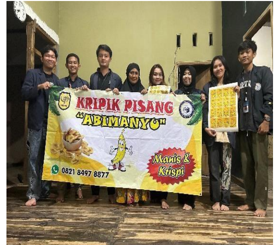
Gambar 2.10 penyerahan benner pemilik umkmk