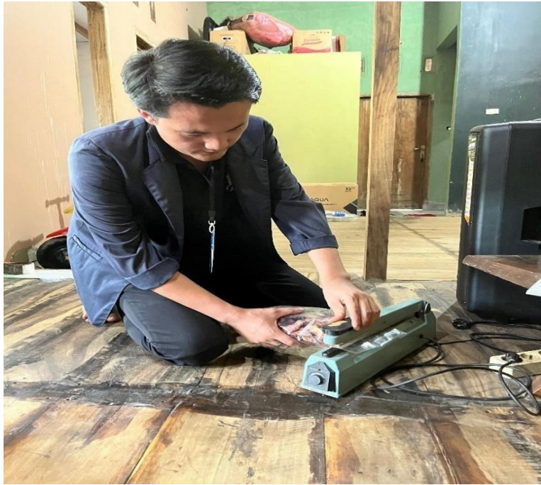
Gambar 2.9 Proses Pengemasan kripik Pisang