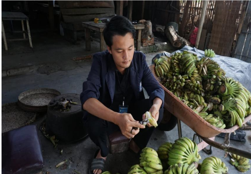
Gambar 2.4 Proses Pengupasan Kulit Pisang