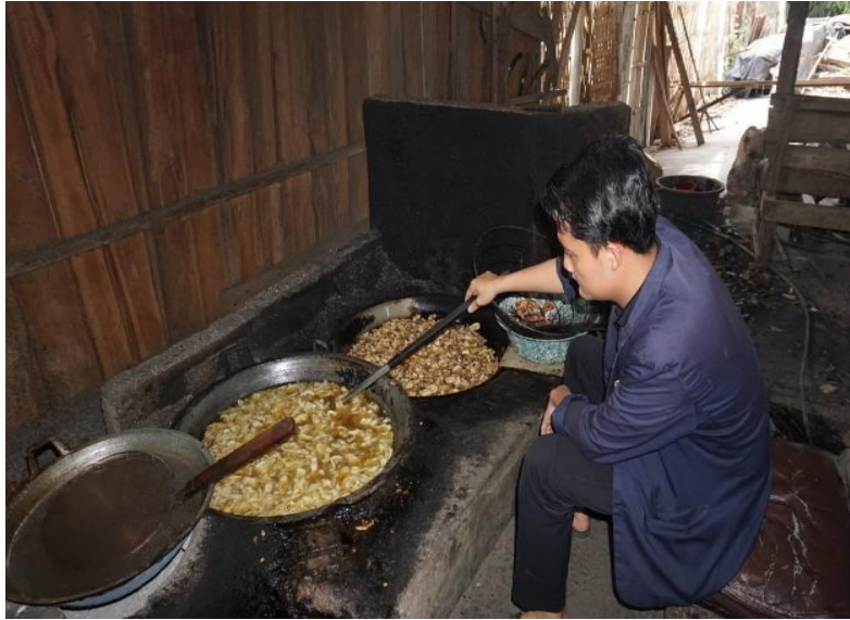
Gambar 2.6 Proses penggorengan