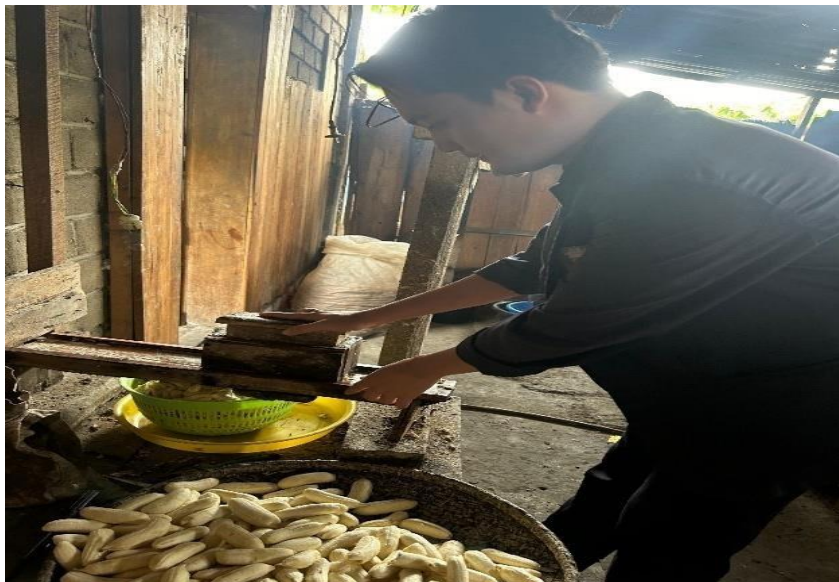
Gambar 2.5 Proses Pematangan Pisang Menjadi Tipis