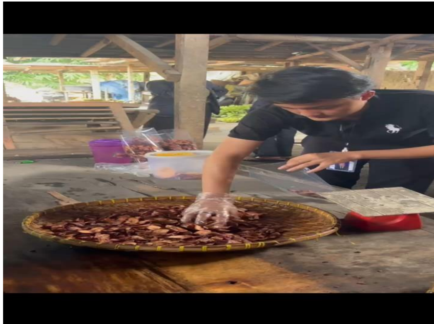
Gambar 2.7 proses pengeringan ditampah