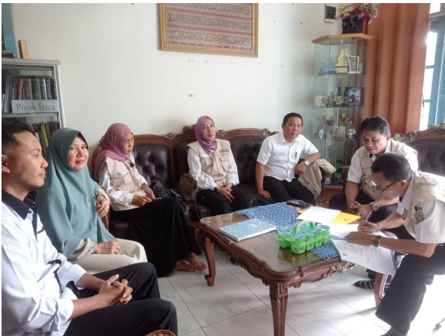
Menjalin Kerjasama dengan Pihak Eksternal