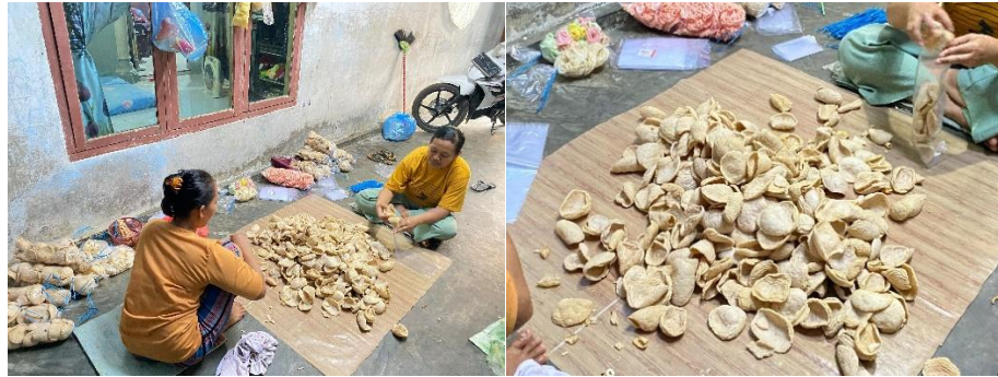
Gambar 2 11 Kunjungan Ke UMKM Kerupuk Jangek

UMKM Kerupuk Jangek di Purwoasri 26 fokus pada produksi kerupuk jangek, camilan tradisional yang terbuat dari kulit sapi yang diolah dengan bumbu khas. Produk ini dikenal karena kerenyahannya dan cita rasa gurih yang khas, menjadikannya salah satu camilan yang digemari di berbagai acara. Meski masih berskala mikro, UMKM ini memiliki potensi untuk berkembang lebih besar dengan inovasi pada kemasan dan strategi pemasaran digital yang lebih efektif.