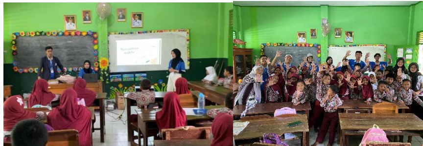
Gambar 2 13 Sosialisasi di SD N 5 Metro Utara

Dokumentasi foto ini menangkap momen saat kami mengajar di SD Negeri 5 Metro Utara dengan tema 'Manajemen Waktu'. Dalam sesi ini, kami memperkenalkan konsep manajemen waktu kepada siswa dengan tujuan untuk membantu mereka memahami pentingnya mengatur waktu secara efektif dalam kegiatan sehari-hari mereka. Melalui berbagai aktivitas dan diskusi, kami memberikan mereka alat dan strategi praktis yang dapat mereka terapkan untuk meningkatkan produktivitas dan efisiensi dalam belajar dan beraktivitas. Kami berharap, pembelajaran ini dapat memotivasi siswa untuk lebih terampil dalam mengelola waktu mereka, baik di sekolah maupun di rumah.