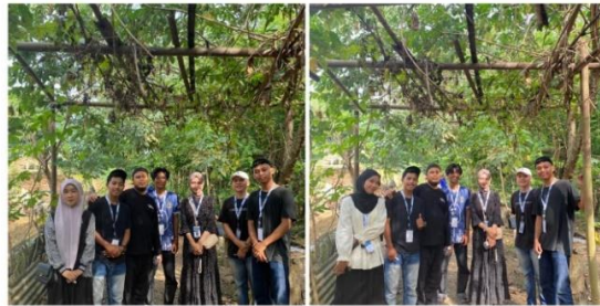
Gambar 2 10 Kunjungan Ke UMKM Lebah Madu

UMKM Lebah Madu bergerak dalam produksi madu alami yang dihasilkan dari peternakan lebah lokal. Madu yang dihasilkan dikenal memiliki kualitas tinggi karena dipanen langsung dari sarang lebah yang dibudidayakan secara tradisional. Selain madu, usaha ini juga menghasilkan produk turunan seperti propolis dan lilin lebah. Produk-produk ini tidak hanya dijual di pasar lokal tetapi juga diminati oleh konsumen dari luar daerah karena manfaat