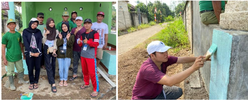
Gambar 2 18 Gotong Royong Mengecat Gardu

15. Gotong Royong bersama Linmas, Ketua RT 08 dan warga serta mengecat Gardu RW 02