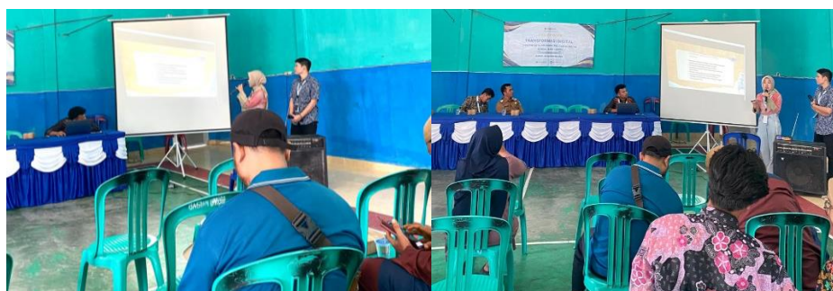
Gambar 2 1 Pemaparan Materi Google Business Profile

Setelah melakukan beberapa kunjungan ke berbagai UMKM di Kelurahan Purwoasri, kami menemukan beberapa kendala yang signifikan dalam proses digitalisasi usaha. Salah satu tantangan utama yang kami temui adalah adanya ketidakmauan atau resistensi dari beberapa pelaku UMKM terhadap penerapan teknologi digital dalam operasional mereka. Beberapa pelaku usaha merasa ragu atau tidak siap untuk mengadopsi platform digital karena alasan yang beragam, termasuk ketidakpahaman akan manfaatnya, kekhawatiran akan kompleksitas teknologi, dan ketakutan akan perubahan drastis dalam cara mereka menjalankan bisnis.