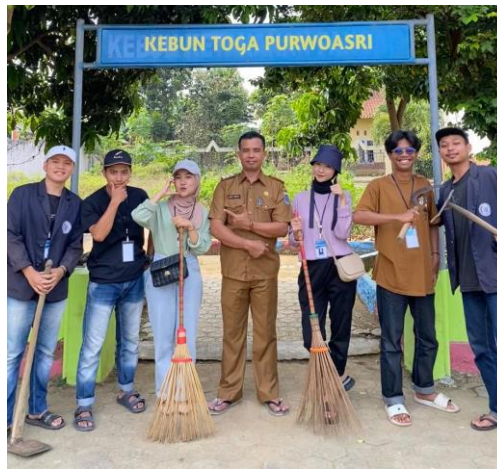
Gambar 2 15 Kerja Bakti dan Penanaman Toga

Kegiatan kerja bakti dan penanaman tanaman obat keluarga (TOGA) di kantor Kelurahan Purwoasri. Dalam kegiatan ini, kami membersihkan lingkungan sekitar kantor kelurahan dan menanam berbagai jenis tanaman obat yang memiliki manfaat kesehatan, seperti jahe, kunyit, dan serai. Kerja bakti ini tidak hanya bertujuan untuk memperindah dan menjaga kebersihan lingkungan kantor kelurahan, tetapi juga untuk mempromosikan pentingnya keberadaan tanaman obat keluarga sebagai sumber pengobatan alami yang mudah diakses oleh masyarakat. Melalui penanaman TOGA ini, diharapkan masyarakat lebih sadar akan manfaat tanaman herbal dan semakin termotivasi untuk memanfaatkan lahan pekarangan mereka dengan menanam tanaman yang bermanfaat bagi kesehatan.