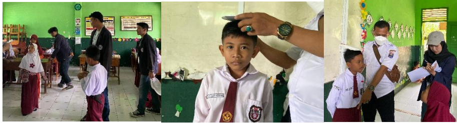
Gambar 2 16 Bekerja Sama dengan Posyandu Keliling

Kegiatan kolaboratif antara pihak sekolah, Puskesmas, dan mahasiswa dalam program Posyandu keliling yang diadakan di SD Negeri 5 Metro Utara. Program ini merupakan bentuk pelayanan kesehatan yang dibawa langsung ke lingkungan sekolah dengan tujuan untuk memantau kesehatan dan pertumbuhan anak-anak, terutama dalam hal gizi, perkembangan fisik, dan imunisasi. Kerjasama ini melibatkan tim medis dari Puskesmas yang bekerja sama dengan para guru dan orang tua untuk memastikan setiap anak mendapatkan pemeriksaan kesehatan yang rutin dan teratur. Melalui Posyandu keliling ini, diharapkan dapat meningkatkan kesadaran akan pentingnya kesehatan sejak dini dan memastikan anak-anak tumbuh sehat dan kuat, sehingga mampu belajar dengan lebih baik di sekolah.