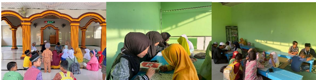
Gambar 2 17 Mengajar di Masjid Darussalam

Dokumentasi ini menampilkan kegiatan mengajar mengaji di Masjid Darussalam, Kelurahan Purwoasri, di mana kami 30ersama-sama dengan para guru ngaji mengajar ngaji Kegiatan ini dirancang untuk memperkuat fondasi keagamaan di kalangan generasi muda, dengan mengajarkan