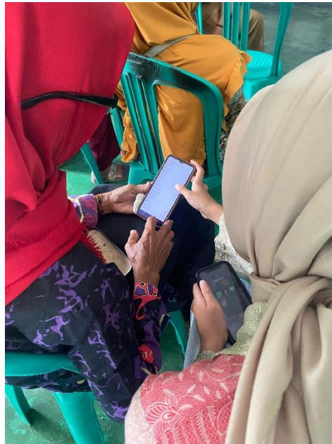
Gambar 2 2 Praktek Pelatihan Google Business Profile

daya saing di pasar yang lebih luas. Kami mengundang beberapa UMKM untuk ikut serta dalam pelatihan tersebut.