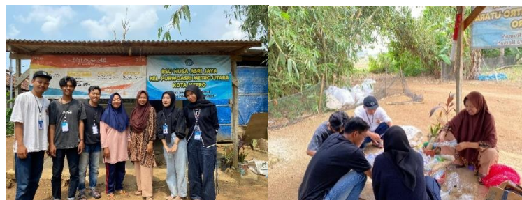
Gambar 2 14 Kegiatan Pilah Sampah

Foto dokumentasi ini menunjukkan kegiatan pilah sampah yang dilakukan oleh BSU di Kelurahan Purwoasri, Metro Utara. Dalam kegiatan ini, anggota BSU berkolaborasi dengan masyarakat setempat untuk memilah sampah