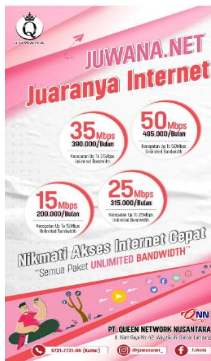
Gambar 2. 1 Juwana Net

Berikut Lampiran terkait produk yang disediakan oleh PT. Queen Network Nusantara :