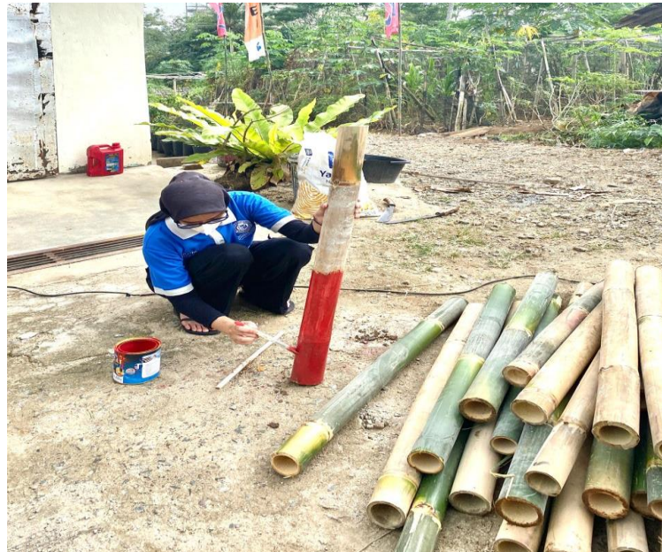
gambar 2. 10 kerja bakti di desa bernung