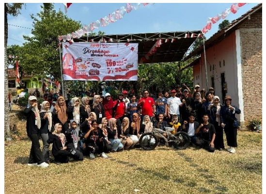
gambar 2. 12 mendampingi aparatur desa membagi sepeda