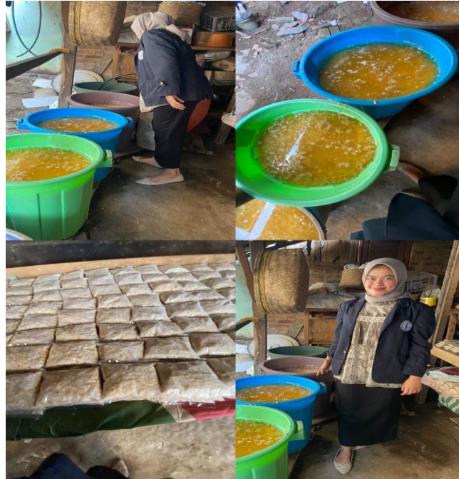
gambar 2. 1 halaman survey tempat dan mencari data-data