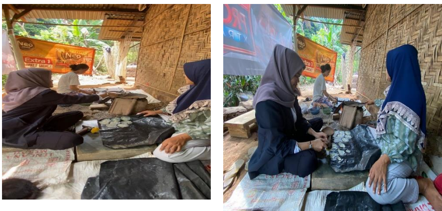
gambar 2. 2 halaman Survey tempat