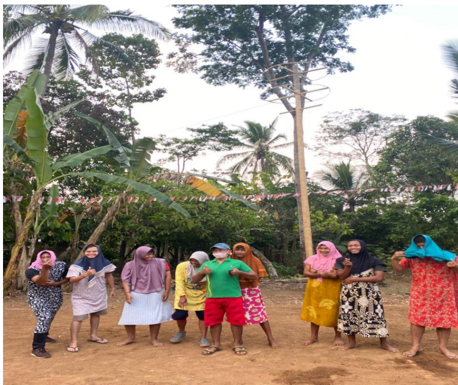
gambar 2. 14 lomba 17 agustus di dusun taman rejo