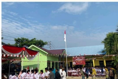
gambar 2. 13 melaksanakan upacara hut ri ke 79