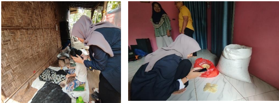
gambar 2. 3 halaman Masuk Pengontenan Emping