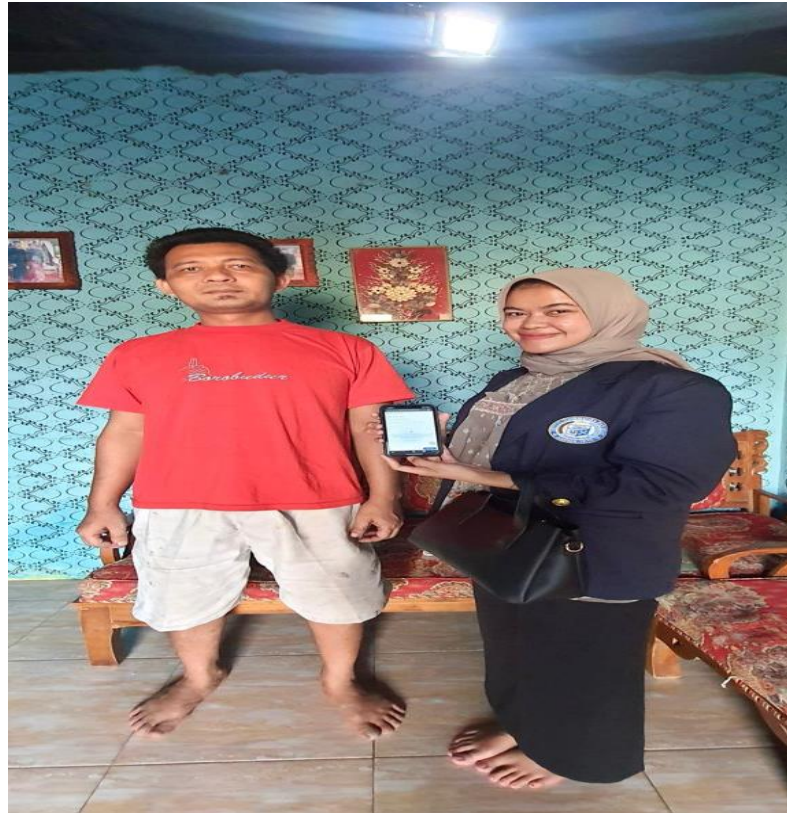
gambar 2. 7 Penyerahan Akun