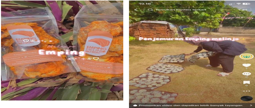
gambar 2. 5 halaman Masuk ke sosial media dan promosi f) Membuat Google Profil Bisnis Tempe Bapak Supriadi