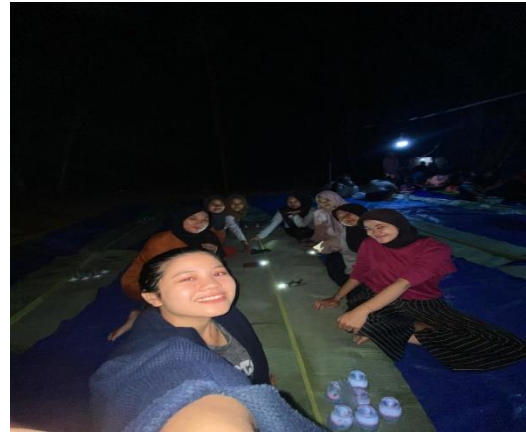
gambar 2. 11 menjadi panitia jalan sehat