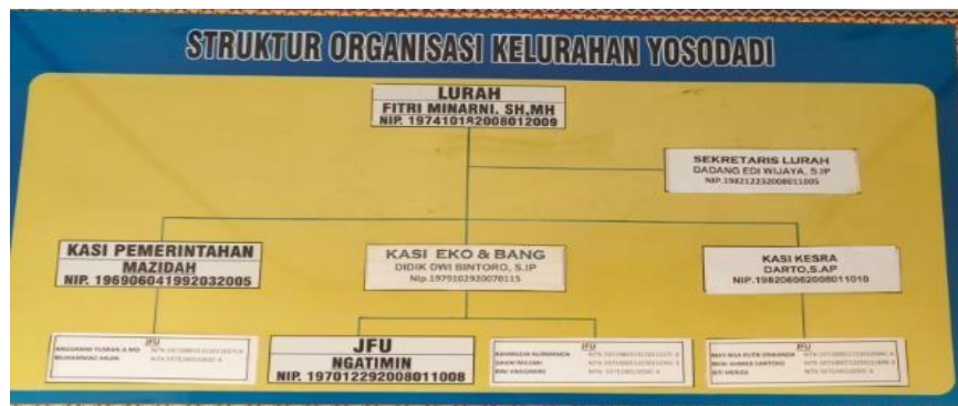
Tabel 1. 2 Struktur Organisasi Kelurahan Yosodadi