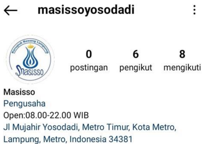
Gambar 2.2 hasil pembuatan akun instagram

bawang masisso kini berada pada posisi yang lebih baik untuk menghadapi persaingan di pasar digital. Diharapkan pengelolaan dan pembaruan konten secara berkala dapat terus dilakukan untuk mempertahankan kinerja yang optimal dan meningkatkan efektivitas promosi serta penjualan.