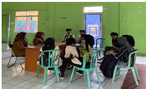
Gambar 2.4 Diskusi bersama mahasiswa Dharma Wacana

Melaksanakan kegiatan penginputan buku ke dalam web desa dan data BPS Sitanduk di kelurahan Yosodadi. Kegiatan ini dilakukan sebagai bentuk membantu kelurahan persiapan mengikuti perlombaan kelurahan tingkat nasional. Kegiatan ini meliputi pendataan buku yang tersedia di perpustakaan kelurahan secara online ke dalam web yang disediakan, penginputan data warga desa Yosodadi ke dalam Sitanduk. Kegiatan ini dilakukan bersama mahasiswa dari Dharma Wacana, yang juga melaksanakan PKPM di kelurahan Yosodadi.