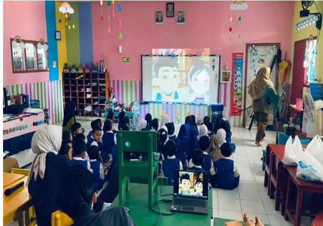
Gambar 2.3 Menonton bersama di TK