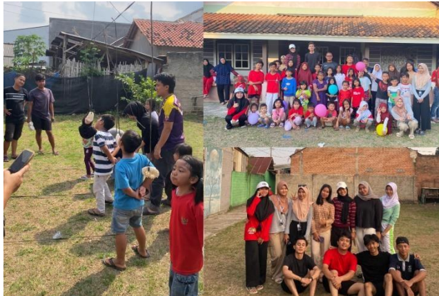
Gambar 2.6 Pelaksanaan Lomba Agustusan