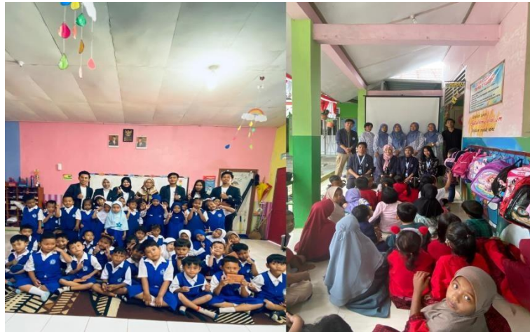
Gambar 2. 5 Kunjungan ke TK PKK 1 & TK PKK 2

Mengadakan kegiatan bermain serta menonton film edukatif bersama dengan anak-anak di TK PKK 1 dan TK PKK 2. Kegiatan ini meliputi menonton film bersama, kemudian dilanjutkan dengan sesi bermain bersama, seperti tanya jawab, berhitung serta membaca, bernyanyi bersama dan unjuk bakat dengan anak-anak, yang kemudian pemberian hadiah sebagai apresiasi terhadap aksi yang dilakukan.