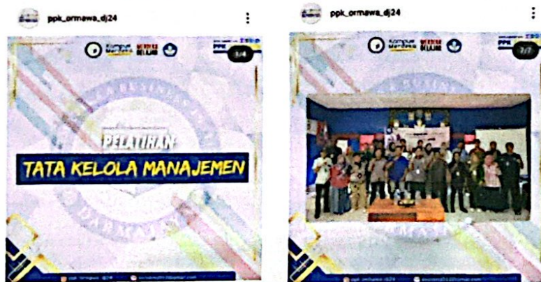
Gambar 4.1 Desain feed di platform media sosial PPK ORMAWA IIB Darmajaya

Hasil desain grafis berupa feed instagram Desain feed ini dirancang dengan konsep yang modern dan dinamis, memadukan elemen visual yang kuat untuk memperkuat pesan PPK ORMAWA. Warna-warna yang digunakan mencerminkan semangat kolaborasi dan pemberdayaan, sementara tata letaknya dibuat rapi dan menarik untuk memudahkan audiens dalam memahami informasi. Setiap elemen, dari tipografi hingga ikonografi, dipilih dengan cermat untuk menciptakan identitas visual yang profesional dan inspiratif. Feed ini diharapkan dapat meningkatkan keterlibatan masyarakat serta mempromosikan program dan kegiatan PPK ORMAWA secara efektif di media sosial.