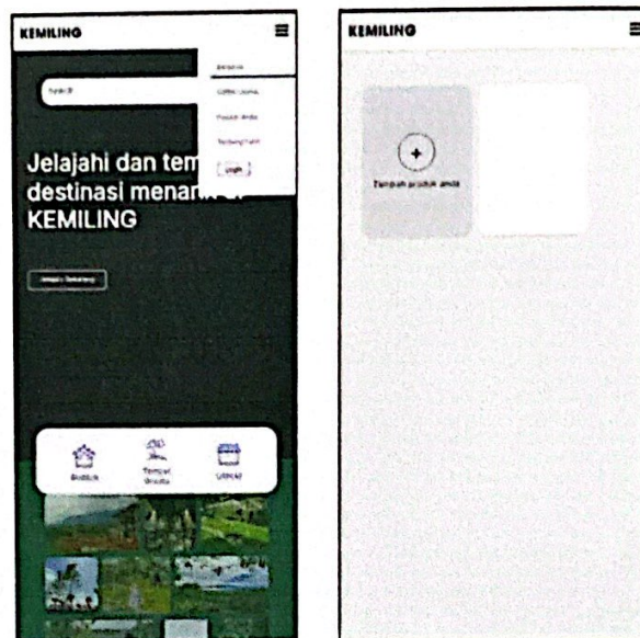
Gambar 4.3 Desain Antarmuka (UI) Aplikasi KEMILING

Setiap elemen, mulai dari tombol, ikon, hingga latar belakang, dirancang untuk menciptakan suasana yang tenang dan segar, seolah-olah pengguna sedang berada di tengah-tengah alam yang asri. Desain ini tidak hanya estetis, tetapi juga fungsional, memastikan pengalaman pengguna yang intuitif sekaligus mengingatkan akan pentingnya menjaga lingkungan sekitar.