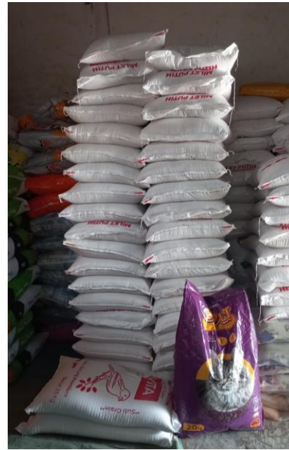
Barang Pakan Karungan