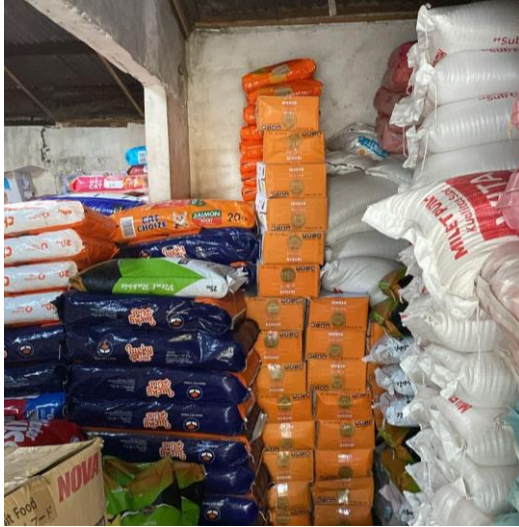
Barang Pakan Dus-an