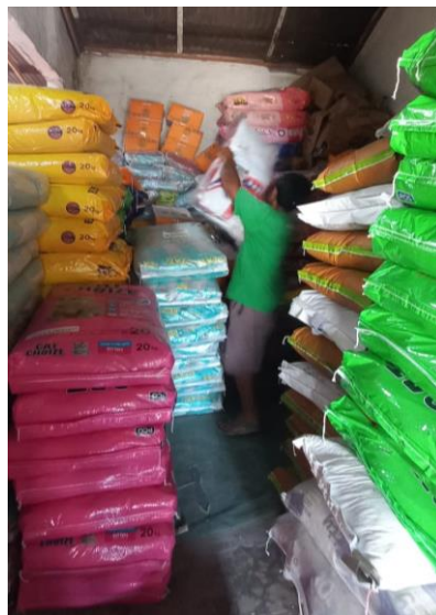
Proses Penyusunan Barang Di gudang