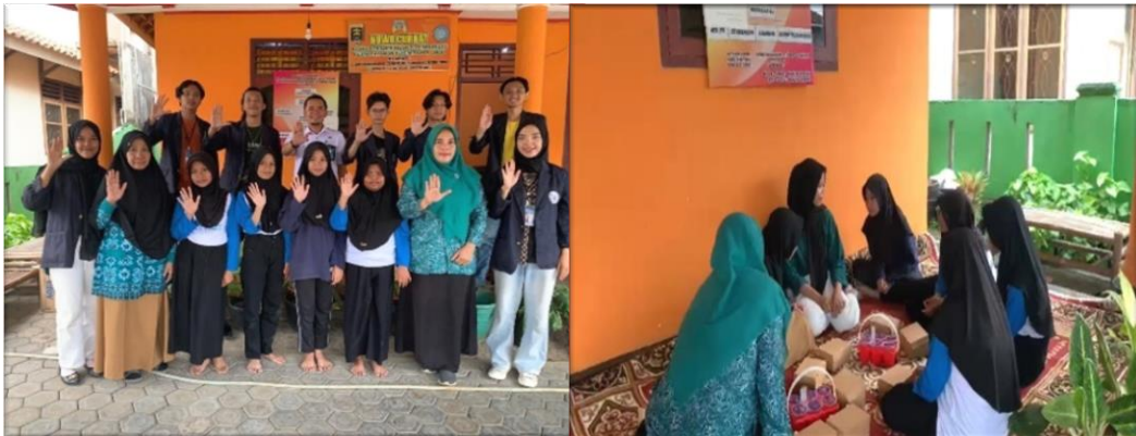
gambar 2.7 pembuatan video forum anak tentang kekerasan ibu dan anak

Membuat video mencegah kekerasan ibu dan anak dengan tujuan untuk meningkatkan kesadaran terhadap orang tua, agar menjaga mental anak