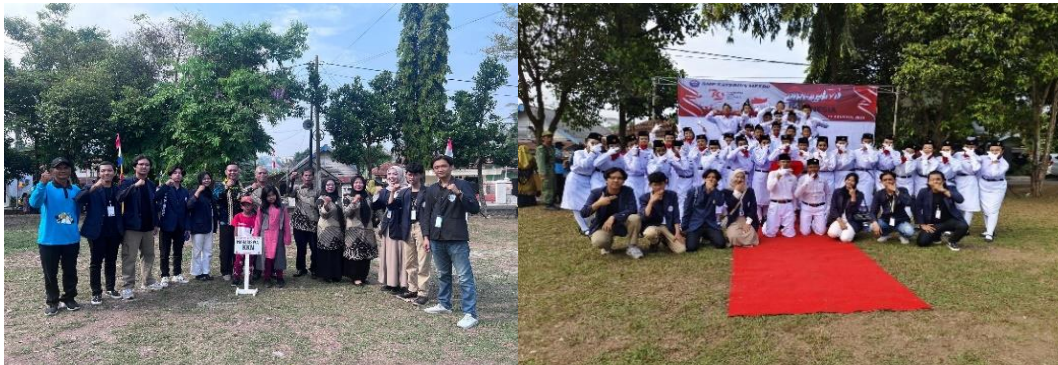
gambar 2.5 menghadiri upacara bendera pada HUT RI Ke-79 di Kelurahan Yosorejo

Mahasiswa PKPM IIB Darmajaya mengikuti upacara bendera dalam rangka HUT RI Ke-79 di kelurahan Yosorejo