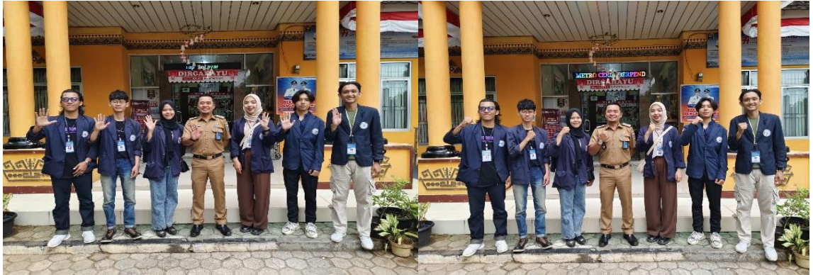
gambar 2.4 apel pagi setiap senin di Kecamatan Metro Timur

Kegiatan rutin yang dilakukan oleh Kelurahan di kecamatan yang dilaksanakan setiap hari senin