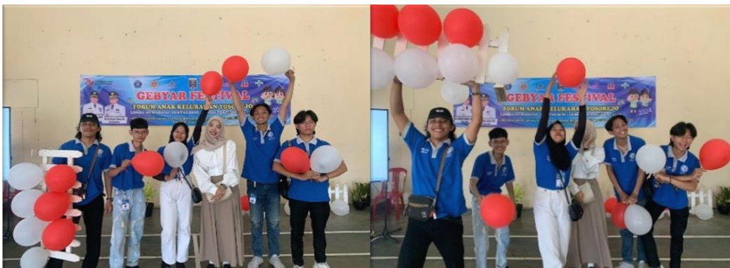
gambar 2.9 mengikuti kegiatan Gebyar Festival Forum anak di Kelurahan Yosorejo

Mengikuti kegiatan Gebyar Festival Forum anak dengan berbagai perlombaan khususnya unuk anak anak dari berbagai Tk dan anak-anak berkebutuhan khusus dengan tujuan mempererat Silaturahmi.