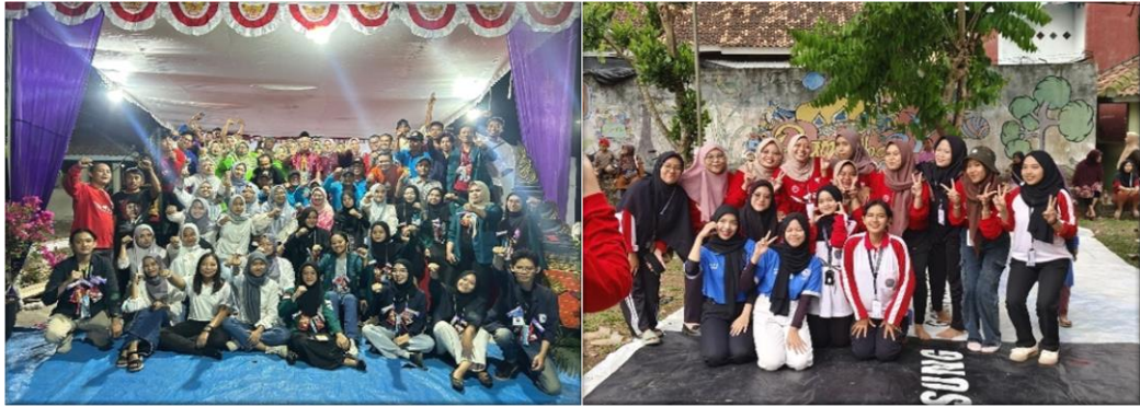
gambar 2.6 berpartisipasi menjadi panitia HUT RI Ke-79

Berpartisipasi dalam kegiatan yang diselenggarakan oleh Rw 01 sampai Rw 13 di kelurahan Yosorejo dalam memeriahkan HUT RI Ke-79 dengan berbagai macam perlombaan.