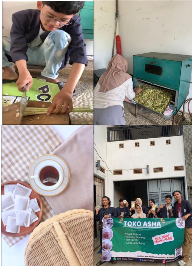
Gambar 2.3 Ikut Serta Dalam Pembuatan Dan Pengemasan teh serah

Mahasiswa turun langsung ikut serta dalam pembuatan teh serah yang terbuat dari 100% serah