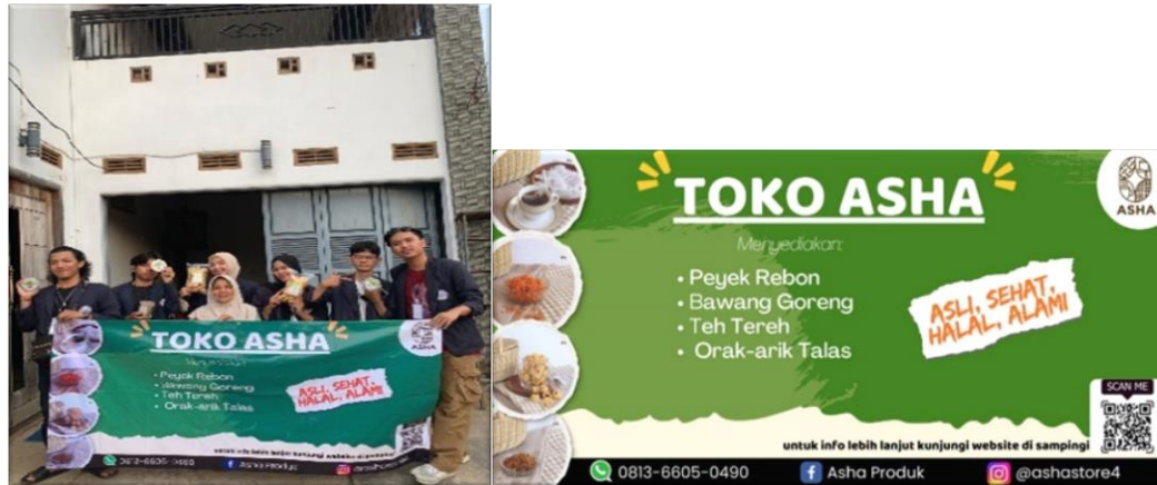
Gambar 2.10 penyerahan banner kepada UMKM ASHA

Banner ini nantinya digunakan sebagai identitas dan sebagai penanda bagi para pelanggan dan juga calon pelanggan agar mengetahui lokasi dan jenis usaha yang di jalankan