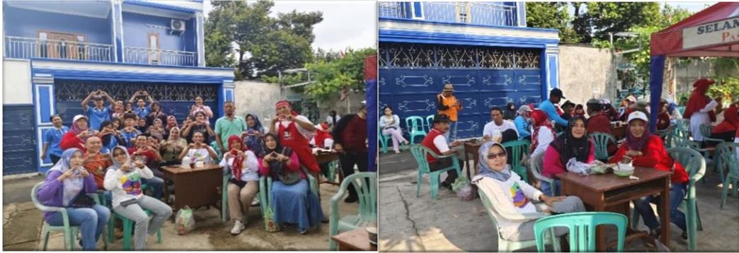
gambar 2.8 mengikuti kegiatan di pasar seger Kelurahan Yosorejo

Mengikuti Acara Yang Di Gelar Oleh Ibu-Ibu Kelompok Wanita Tani (KWT) Serta Rw 08 Dan Karang Taruna Serta Serta Warna Kelurahan Yosorejo